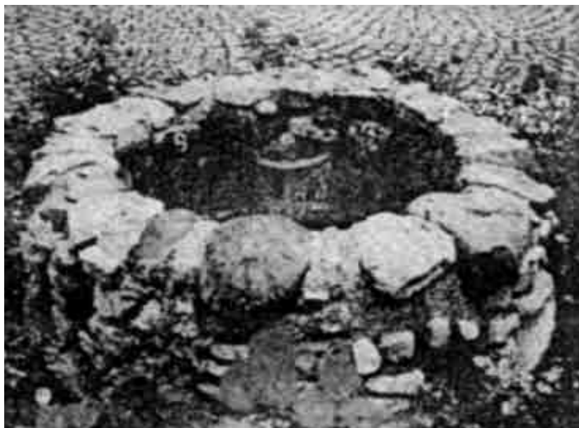
Unterirdische Schachtmanipulation, jetzt ausgegraben und als Brunnen genutzt

Außerhalb des Maierhofes befindet sich noch eine Schachtmanipulation (9), welche eine WL zur Anastasia-Kapelle erzeugt (siehe Foto).