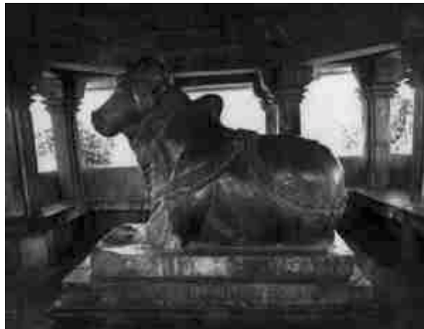
Heiliger Stier Nandi. Sandstein. Angeblich aus dem 11. Jh.n.Chr. [1, S. 127]. Er hätte sich vielleicht sogar in einer spanischen Arena gegen die Matadoren behaupten können.

Geschichte Indiens eine Menge von Lücken existiert und viele Perioden vorhanden sind, über die wir wenig (oder überhaupt nichts?) wissen.