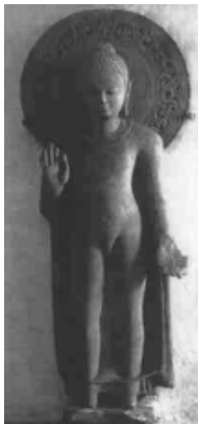
Stehender Buddha aus Sandstein mit einem katholischen Heiligenschein. Soll aus dem 5. Jh.n.Chr. stammen (warum nicht aus dem 15.?) [1, S. 57]

Ein besonderes Augenmerk verdiente in Augen der deutschen Reisenden die indische Gesellschaftsordnung. Das Kastenwesen überraschte die europäischen Beobachter sehr. Hatten sie doch nicht einmal einen entsprechenden Terminus in der deutschen Sprache gehabt (was kaum für die tiefen Kontakte mit Indien vor 1500 spricht). Einzelne soziale Gruppierungen, ethnische Gruppen und Sprachen, geographische Unterschiede in der Gliederung der Gesellschaft in verschiedene soziale Schichten – all das war im Blickpunkt der Berichterstatter. Nur nicht die Chronologie all dieser Gesellschaften.