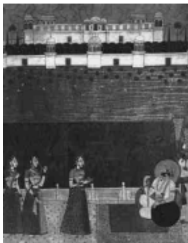
Endlich mal eine Festung! Maharaja Takhat Singh von Jaipur, 1850.

Noch mehr, er schreibt sogar darüber, dass die nationalistische Weltanschauung und die falsch verstandenen Interessen der Nation viele bewegt haben, die ausgedachten „Fakten“ in der indische Geschichte zu implantieren. Viele hochgebildete (im westlichen Sinne?) Inder sollen das für eine legitime und selbstverständliche Tätigkeit gehalten haben. Diese sehr wichtige Beobachtung wurde leider von Nehru im weiteren Verlauf des Buchs nicht berücksichtigt: er wiederholt viele kaum begründete Behauptungen der Geschichtler, die an der Erdichtung langer indischer Geschichte in vorangegangenen 100 bis 150 Jahren aktiv Teil genommen haben.