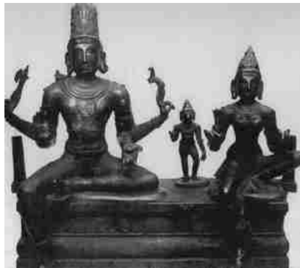
Kein Herrscherpaar, sondern Gott Shiva mit seiner Partnerin Parvati. Bronze, angeblich aus dem 11. Jh.n.Chr. [1, S. 132]

Und schon produziert einer der Ideologen der indischen Befreiungsbewegung, der künftige indische Regierungschef Jawaharlal Nehru, das umfangreiche Buch [9]. Das Buch ist nicht nur der politischen Situation im noch für die eigene Unabhängigkeit kämpfenden Indien, sondern auch der indischen Geschichte gewidmet. Und er tut das nicht in der Abgelegenheit einer Bibliothek oder des eigenen Arbeitszimmers, sondern mitten im antikolonialistischen Kampf und in der Einsamkeit einer Gefängniszelle (das Buch wurde 1944 abgeschlossen, er saß im Gefängnis vom 9. August 1942 bis zum 28. März 1945 und schrieb das ca. 650 Seiten dicke Buch in nur fünf Monaten).