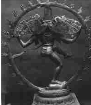
Tanzender Shiva mit Engelsflügeln. Angeblich aus dem 10. Jh.n.Chr. [1, S. 131]

Für die Geschichtler im alten Europa war es wichtig zu zeigen, dass auch in anderen Teilen der Welt eine alte Geschichte existiert. Dann, dachten sie, wird man auch ihnen das Märchen von der 2,5-tausend Jahre langen europäischen Geschichte abnehmen.