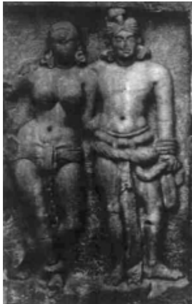
Stifterfiguren am Eingang eines Höhlentempels, Staat Bombay, 1. Jh.n.Chr. nach traditioneller Datierung [1, S. 53], Sandstein. Sind das die indischen Adam und Eva? Trägt „Adam“ einen mittelalterlichen Turban?

Ein von der schulischen Geschichtsschreibung verhypnotisierter aber im gewissen Sinne gut ausgebildeter Leser wird auch danach noch zweifeln, ob man vor mehr als hundert Jahren wirklich noch nichts über die Geschichte Indiens zu berichten wusste. Vielleicht fällt ihm ein folgendes Gegenargument ein: für Oskar Jäger war doch die ganze Weltgeschichte eine klare europäisch-mediterrane Angelegenheit. Darum ist es auch nicht verwunderlich, wird er sagen, dass im zweiten Band von [4] Indien nur einmal auftaucht: wenn „der Mongole“ Timur 1398 die Stadt Delhi erobert haben soll.