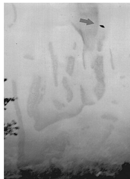
Die von Epp im Flug fotografierte Flugscheibe über der Hohen Tatra. Die Schlieren auf dem Bild stammen von Schweiß, weil Epp es in einem Strumpf versteckt durch die Kriegswirren geschmuggelt hat.

Epp war mehrfach Zeuge von Erprobungsflügen der Scheiben, ist jedoch niemals selbst mitgefliegen. Begeistert schilderte er mir die von ihm beobachteten Flugmanöver, die von keinem damaligen Flugzeugtyp nachgefliegen werden konnten. Auf die Triebwerksgeräusche angesprochen, sagte er, dass außer einem leisen Summen nichts hörbar gewesen sei, im Vergleich zu den herkömmlichen Flugzeugen, deren Motorgeräusche man schon von weitem hörte, bevor sie da waren. Leider besaß er nur noch zwei Fotos einer Flugscheibe, die er im Flug über die Hohe Tatra mit einer einfachen Kamera fotografiert hatte. Auf diesen Bildern sind jedoch leider keine Einzelheiten der Scheibe erkennbar. Epp erzählte, dass die Scheibe so schnell geflogen sei, dass er kaum mit dem Fotografieren nachkam. Auf dem dritten Foto, das heute nicht mehr existiert, sei die Scheibe bereits verschwunden gewesen. Die beiden Bilder schmuggelte er bei seiner abenteuerlichen Flucht durch das Kriegsgebiet und Gefangenschaft, versteckt in einem seiner Strümpfe. Seinen anderen Flugscheiben-Fotos, die er hatte, trauerte er nach, genauso wie seinen Plänen und Zeichnungen, die er vernichten musste, damit sie nicht in die Hände der anrückenden Russen fallen konnten. Heute wären sie stichhaltige Beweise für die oftmals verleugnete Existenz dieser Geräte.