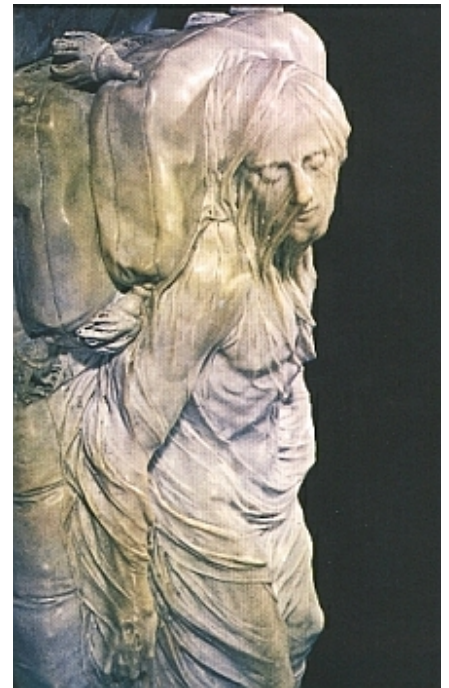
„Il Cristo Velato“ (1753, Giuseppe Sammartino) (Museo Cappella Sansevero, Napoli)

In dem ovalen Raum stehen heute zwei große Ausstellungsschränke. In jedem befindet sich das Skelett eines Erwachsenen - eines Mannes und einer Frau. Doch dies allein ist nicht das eigentlich Erschreckende. Wie von Wurzeln einer menschlichen Alraune werden die bleichen Knochen durch die versteinerten Arterien, Venen und Kapillaren des Blutkreislaufes umschlungen. Das Gewebe, und bei dem männlichen Skelett auch ein Teil der Fußknochen, ist offensichtlich entfernt worden, wäh-