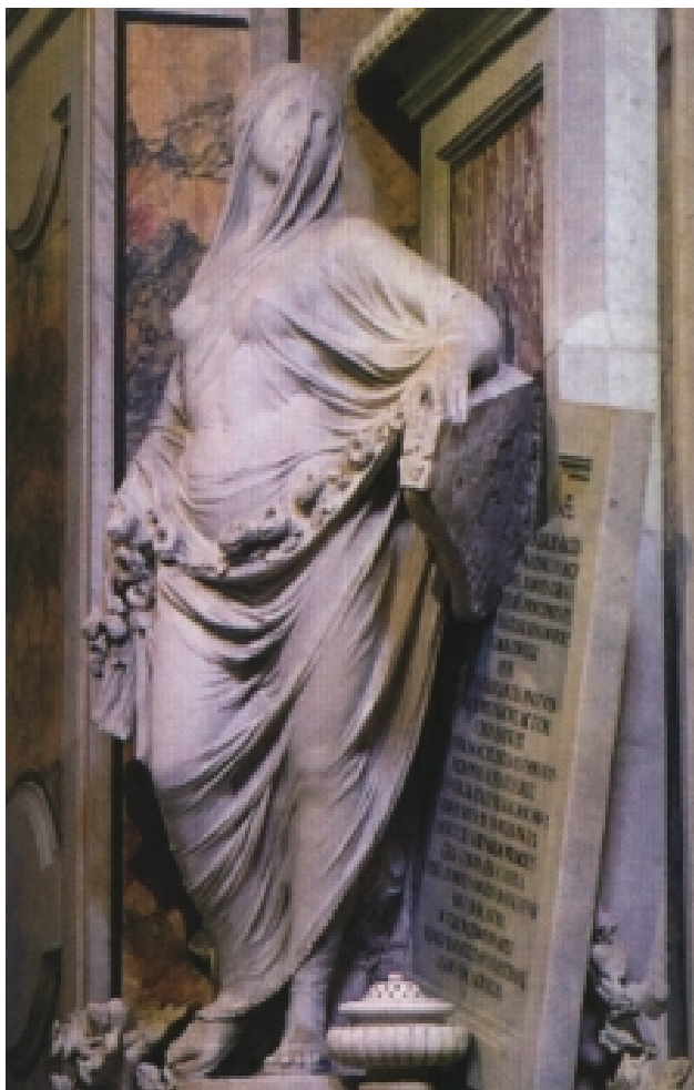
„La Pudicizia“ (1752, Antonio Corradini) (Museo Cappella Sansevero, Napoli)

Tatsache, dass bei der Rekonstruktion der Kapelle in den achtziger Jahren in der Krypta Teile einer Laboraus-rüstung aufgefunden worden sind. Diese Gerätschaften gehörten zweifellos zum Besitz des Prinzen von Sansevero.