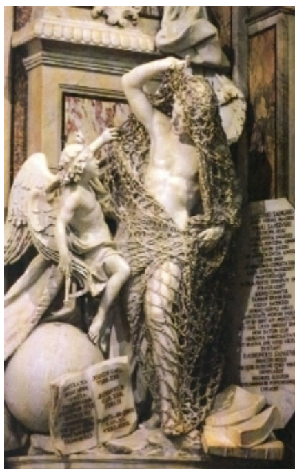
„Il Disinganno“ (1757, Francesco Queirolo) (Museo Cappella Sansevero, Napoli)