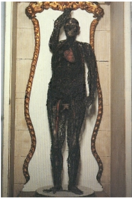
„Studio anatomico donna“ (1760) (Museo Cappella Sansevero, Napoli)

„nützliches Handbuch für Militärübungen der Infanterie“. Dieses Werk erlangte eine große Bedeutung für die Militärs jener Epoche und trug ihm schließlich sogar ein Lob König Friedrichs II. von Preußen ein.