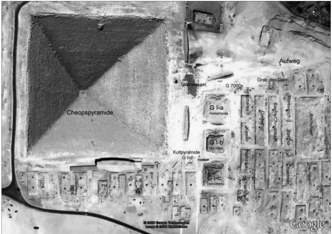
Blick auf die Cheopspyramide mit der östlichen Umgebung. Das Barkenmuseum befindet sich am Südrand der Pyramide.

Wer schon einmal in Ägypten auf dem Gizeh-Plateau war, dem wird die eine oder andere längliche Grube aufgefallen sein, jeweils durch ein Gelände gesichert. Bei diesen Gruben handelt es sich um in den gewachsenen Fels des Plateaus gehauene „Begräbnisstätten“ für Boote bzw. Barken. Sie wurden einem Pharao oder höheren Würdenträger für das Leben nach dem Tod mitgegeben.