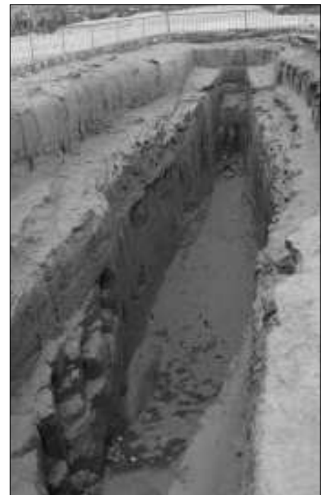
Bootsgrube neben der Königin Hetepheres-Pyramide.

Die Rekonstruktion dieses ältesten erhaltenen Schiffes der Welt durch den Restaurator Ahmed Youssef Moustafa dauerte mehr als zehn Jahre, zumal eine Reihe von Teilen mühsam ausgebessert oder gegen neue Holzteile ausgetauscht werden musste. Insgesamt fünfmal hat Moustafa das 43,40 Meter lange und 5,90 Meter breite Schiff, das einen Tiefgang von 1,50 Meter hat, zusammengesetzt und wieder auseinander genommen, ehe die Rekonstruktion zufriedenstellend gelang.