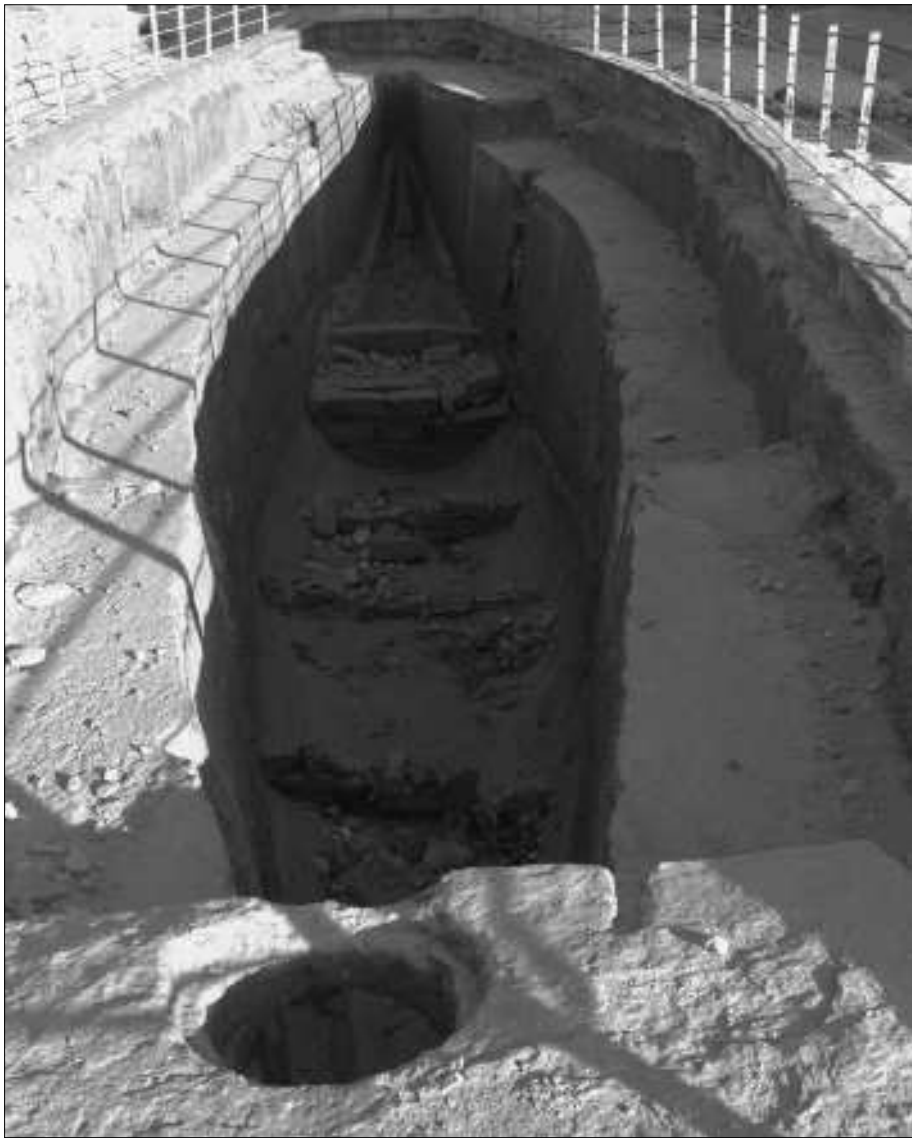
Bootsgrube neben der Königin Henutsen-Pyramide.