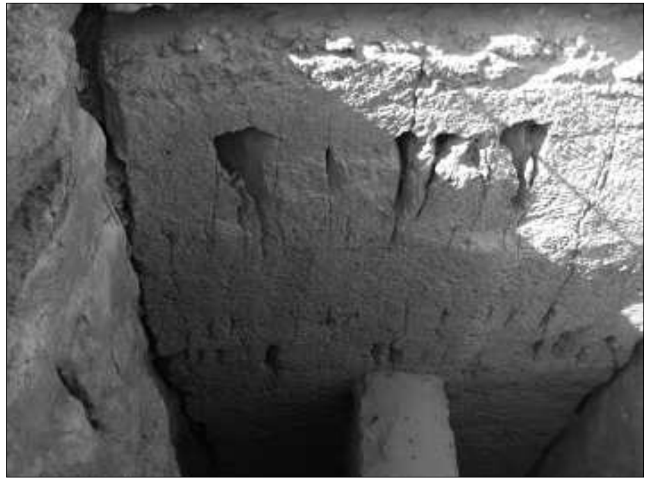
Eine Grube auf der Ostseite der Cheopspyramide

Die Bootsgruben haben nichts mit den zum Teil recht tiefen und großen Gruben und Schächten zu tun, die ebenfalls auf dem Gizeh-Plateau rund