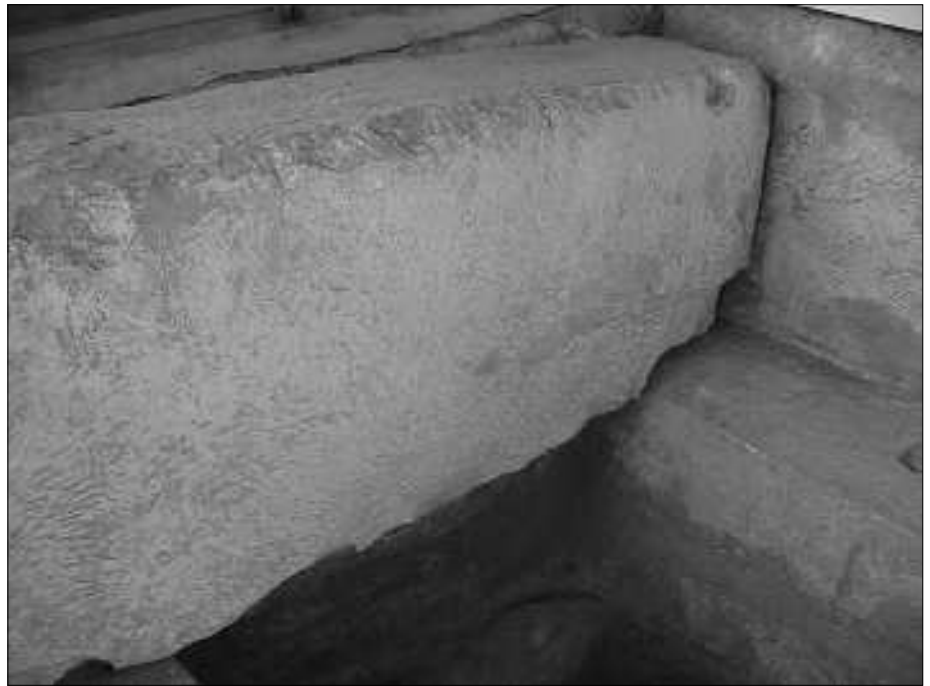
Blick in die Bootsgrube. Man kann gut den Sims erkennen, auf dem die Decksteine auflagen.