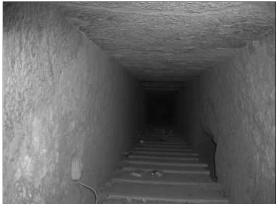
Die „Trial Passage“ - blickt man durch die vergitterte Außentür, so sieht man einen abwärts führenden, in der Finsternis der Tiefe verschwindenden Gang von etwa den Dimensionen des aufwärts führenden Ganges in der Cheopspyramide. Aber offiziell gibt es ja keine Gänge unterhalb des Gizeh-Plateaus...

um die Cheopspyramide vorhanden und durch Geländer gesichert sind. Diese weisen teilweise eine Tiefe von mir geschätzten dreißig Metern auf. In der Tiefe kann man teilweise abzweigende Seitengänge erkennen.