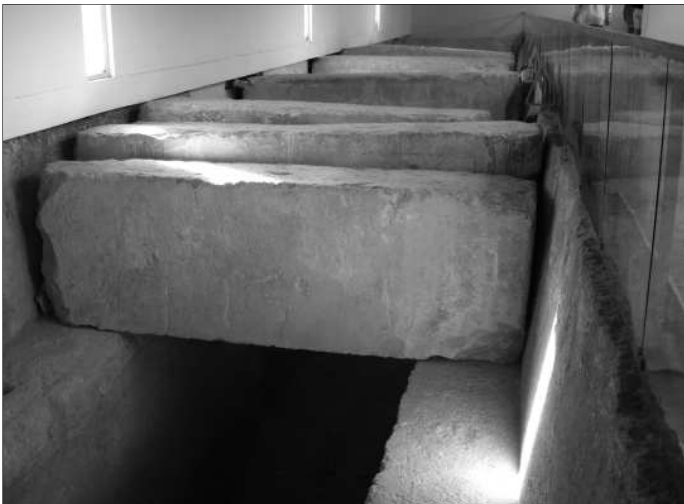
Teil der Bootsgrube, wie sie heute im Barkenmuseum besichtigt werden kann. Damit man in die Grube schauen kann, wurde nur ein Teil der Abdeckblöcke wieder darüber gelegt. Die restlichen Blöcke lagern außerhalb des Museums.

Der damalige Ausgrabungsleiter Kamal el-Mallakh vermutete intuitiv, dass die Südmauer deshalb näher an die Pyramide gebaut wurde, um etwas zu verbergen. Tatsächlich kamen, nachdem seine Arbeiter den Boden freigelegt hatten, die riesigen Abdeckblöcke zum Vorschein, von denen man zunächst nicht wusste, dass sie eine Schiffsgrube abdeckten.