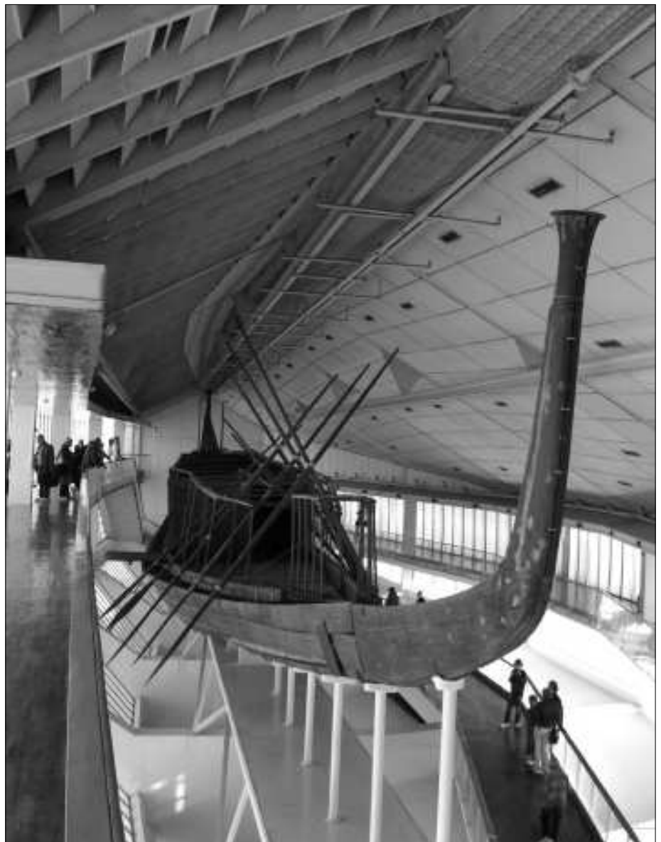
Die rekonstruierte Barke kann von verschiedenen Ebenen aus betrachtet werden.