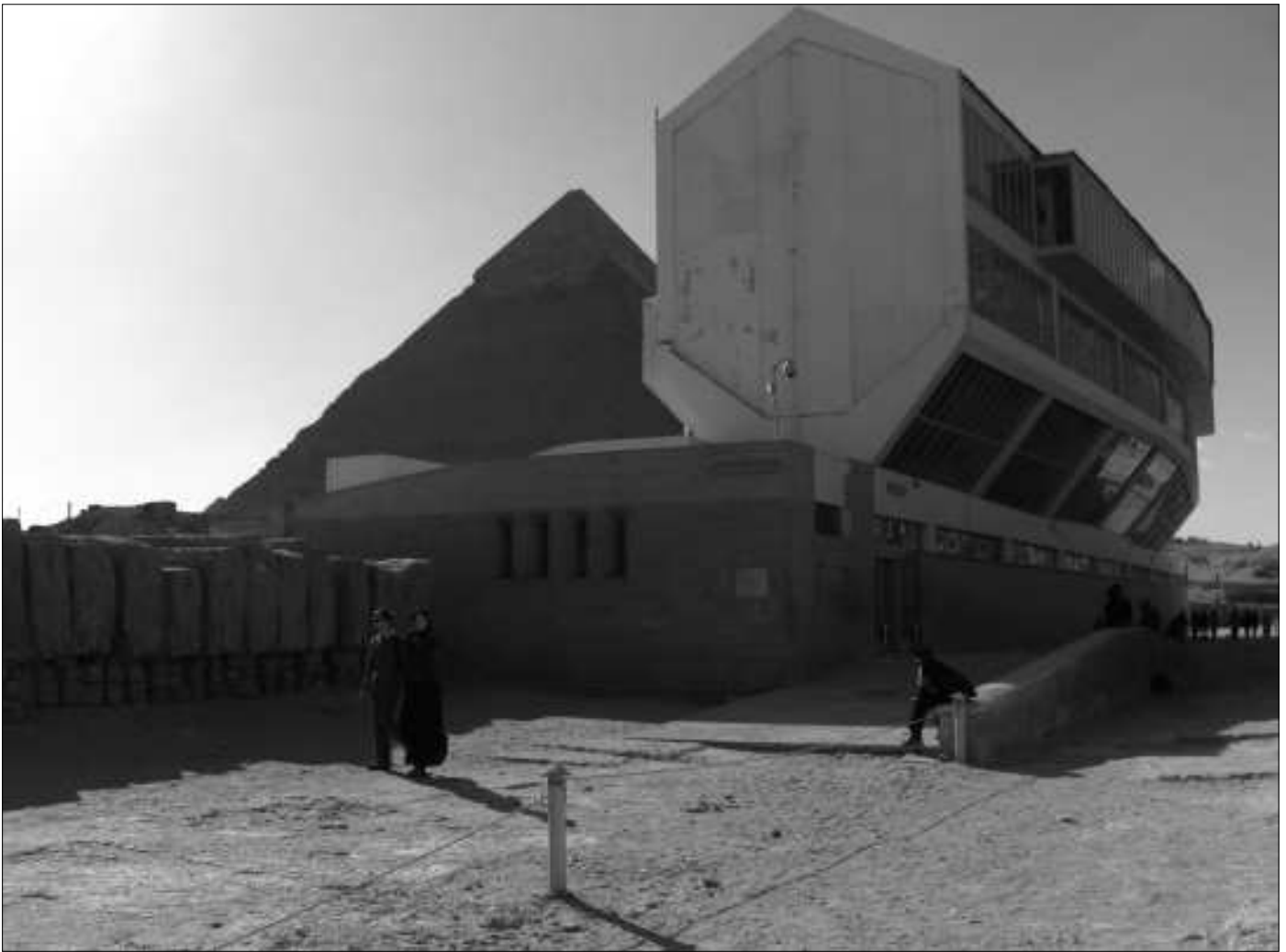
Das Barkenmuseum mit dem rekonstruierten Boot des Pharaos Cheops wurde über der Bootsgrube errichtet. Links im Bild sieht man die aufgereihten Abdeckblöcke, die im Museum nicht mehr über die Grube gelegt wurden.

bei anderen Pyramiden, etwa in Saqqara, Bootsgruben.