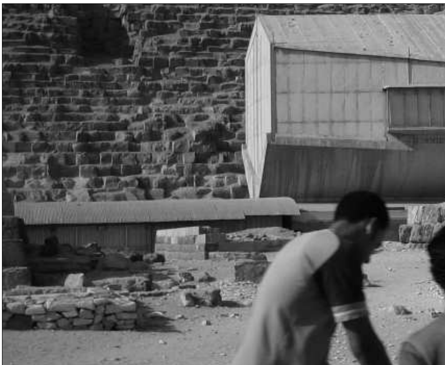
In dieser unscheinbaren Wellblechbaracke hinter dem Barkenmuseum lagert eine weitere zerlegte Barke.

Die Barke, von der man zunächst nicht wusste, dass sie in der Grube lag, war in 1224 Einzelteile zerlegt. Zwei Monate dauerte es, bis allein die großen Gruben-Decksteine mittels Kränen abgehoben waren. Da stellt sich auch hier wieder die Frage, mit welchen Methoden die alten Ägypter so spielerisch mit den schweren Gesteinsmassen umgingen. Immerhin wiegen die Decksteinblöcke jeweils rund sechzehn Tonnen.