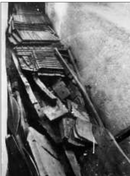
So lag 1954 bei ihrer Entdeckung die Barke zerlegt in der Bootsgrube.

Die Bootsgrube wurde ursprünglich von 41 riesigen Steinblöcken abgedeckt und verschlossen. Ein Teil davon ist noch heute erhalten und liegt wieder über der nun leeren Bootsgrube, über die das Barkenmuseum errichtet wurde. Die restlichen Abdeckblöcke hat man auf der westlichen Seite des Barkenmuseums aufgestellt.