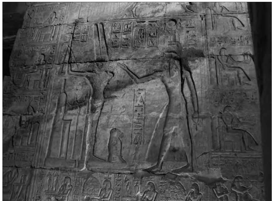
Gott Min (Abydos, Sethos-Tempel)

gischer Deutung hält er mit seiner Hand eine Geißel. Auf den von mir gefundenen Darstellungen hält er jedoch die hochgerekte flache Handfläche nach hinten, während die Geißel (oder ein anderes dreieckiges Gerät) über der Handfläche abgebildet ist.