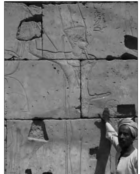
Diese vier Fotos: Amun-Re-Tempel, Luxor.