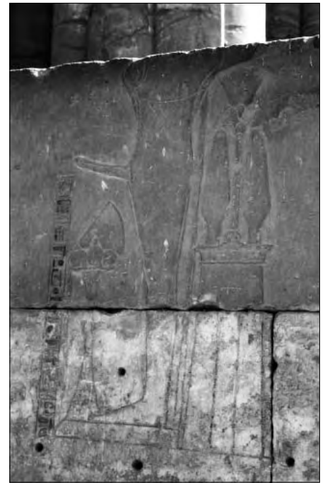
Diese drei Fotos: Amun-Re-Tempel, Luxor.