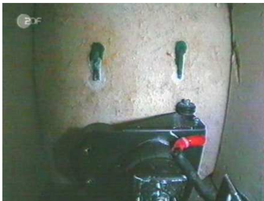
Der Roboter „Pyramid Rover“ vor dem Verschlussstein des Südschachtes. Links der abgebrochene Zapfen.

Hinzu kommt, dass es in der Wissenschaft um viel Geld geht, das sich verdienen lässt, wenn auch die eigentlichen Forscher davon so gut wie nichts haben. Hinzu kommt eine Fernsehübertragung in 141 Länder. Ein Medienereignis, welches gerade in der heutigen Zeit, in der die Werbeeinnahmen die Kriegsführung mit Live-Bildern indirekt bestimmen, nicht unterschätzt werden darf. Einen Flop kann sich weder ein Regisseur noch ein Fernsehsender leisten. Unter