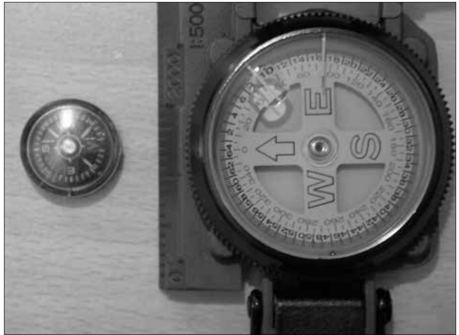
Kompassvergleich: Links ein auf einer Schanze umgepolter Kompass im Vergleich zu einem nicht umgepolten (rechts).

Das über einer Schanze in der Luft erzeugte, anscheinend nach oben gerichtete, ionisierende Feld reicht offensichtlich hoch genug in die Atmosphäre hinein, um für eine Wetterbeeinflussung verantwortlich zu sein. Den hervorgegerufenen Effekt kann jeder beobachten. Es kann bei vielen (aktiven, nicht bei gestörten oder zerstörten) Keltenschanzen mit bloßem Auge beobachtet werden, dass bei leichter Bewölkung genau über der Schanze die Wolkendecke