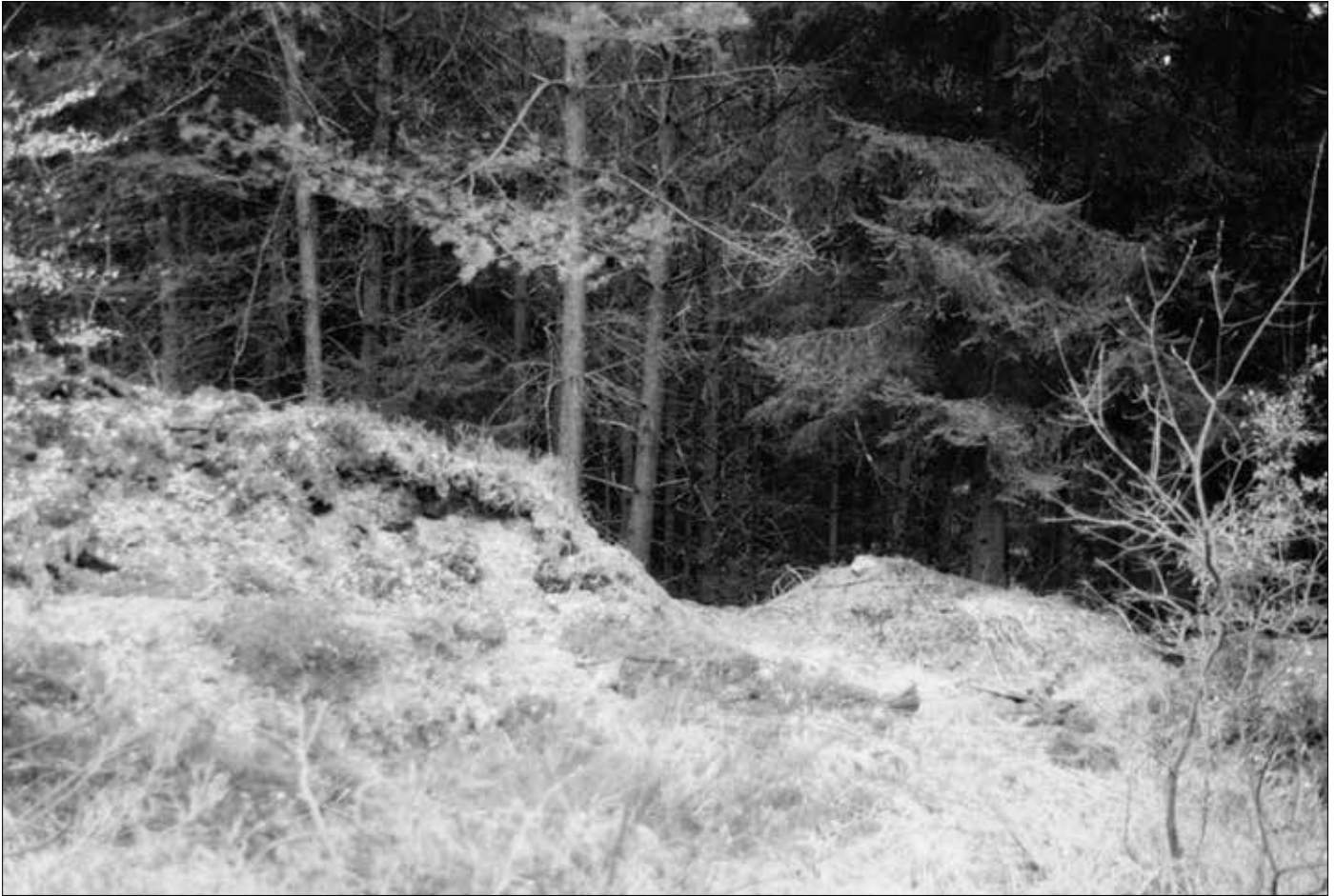
Schanze bei Biesdorf: Wallanlage.

regelmäßigen Verunglimpfungen der Rutengänger. Besonders negativ meinungsbildend sind Fernsehsendungen, die sich „wissenschaftlich“ nennen und „Tests“ zeigen, in denen (natürlich nur drittklassige) Rutengänger vorgeführt werden, wie sie falsche Aussagen machen. Das wird dann verallgemeinernd als „die Radiästhesie = Scharlatanerie“ dargestellt.