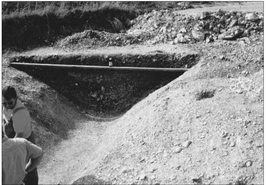
Bopfingen: Schnitt durch den ehemaligen Schanzen-Graben.

Dass so wenig über die Schanzen bekannt ist, liegt auch daran, dass zunächst einmal nur sehr wenige dieser