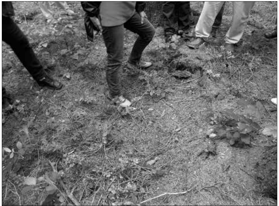
Schanze bei Zell (Niederbayern): Der eingesunkene Korrekturschacht.

Mindestens jedoch enthält jeder Landstrich - egal, ob in Deutschland oder einem anderen europäischen Land