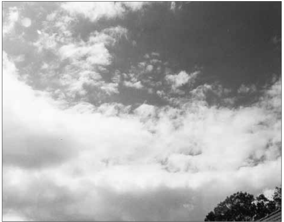
Kreisförmiger Wolkenaufriss über einer Schanze.

Bedingt durch ihre Konstruktion arbeitet eine funktionsfähige Keltenschanze technisch gesehen anscheinend ähnlich wie ein großer Kondensator. Über dem Schanzengelände bildet sich eine Art ionisiertes Feld, das unter anderem eine Wetterbeeinflussung zur Folge hat. So kann man beispielsweise über (heute noch) aktiven Keltenschanzen beobachten, dass bei bewölktem Himmel hier die Wolkendecke aufreißt.