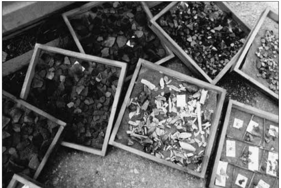
Bopfingen: Müll aus den letzten 500 Jahren.

Anlagen archäologisch einigermaßen untersucht worden sind, und dass man bei diesen Untersuchungen keinerlei Artefakte oder Sonstiges finden konnte, die über den Sinn und die Funktion einer Schanze Auskunft geben könnten, mit Ausnahme von Müll in den oberen Schichten. Wie intensiv und genau Keltenschanzen archäologisch untersucht werden, mag ein Beispiel zeigen: