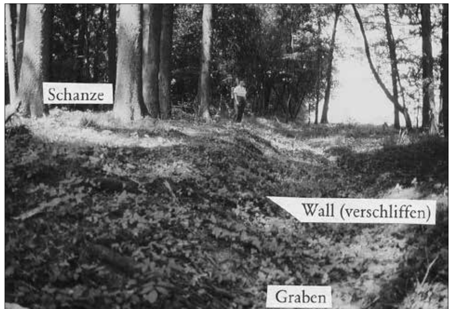
Moosinning, Schanze 3.

da sind. Dann hört das „Wissen“ auf und verliert sich in mehr oder weniger nebulösen Märchen und Annahmen. Viele Leute haben überhaupt noch niemals von diesen Anlagen gehört, obwohl es die mysteriösesten und häufigsten Bauwerke Europas sind, die zu unserem Lebensraum gehören. Dass sie überall vorhanden sind, ist trotzdem kaum jemandem bekannt. Wenn man sich für die Keltenschanzen-Thematik interessiert und versucht, aus Literatur weitere Informationen zu erhalten, wird man sehr schnell enttäuscht.