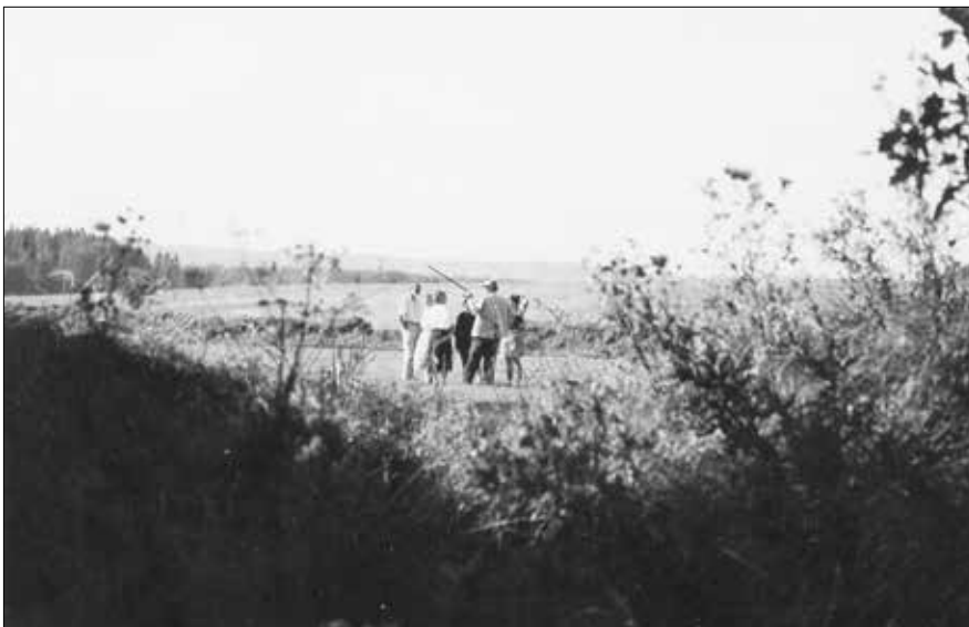
Schanze bei Wolfratshausen: Blick durch den Wall.

Warum werden solche Fehlinformationen verbreitet? Es hängt einfach damit zusammen, dass die Wissenschaft im Dunkeln tappt und sich fantasievolle Deutungen ausdenkt, um