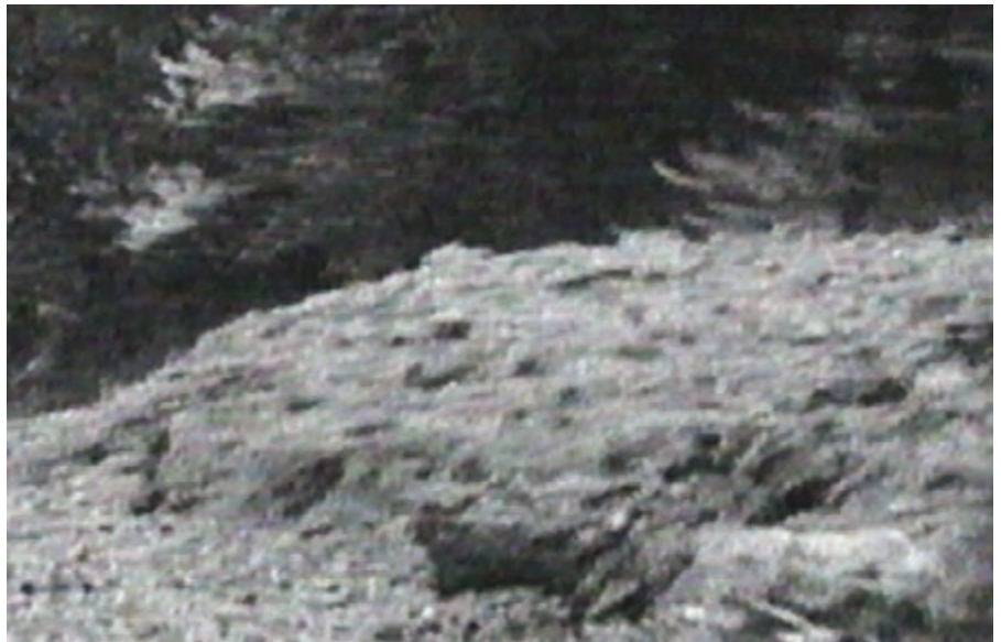
Wurde die katastrophale „Jahrhundertflut“ in diesem Jahr künstlich erzeugt?

Dies wird in den öffentlichen Darstellungen einem Treibhauseffekt zugeschrieben, der durch ein Ansteigen des Kohlendioxid-Gehaltes durch Industrialisierung und Autoabgase einen Wärmestau eingestrahelter Sonnenenergie in der Atmosphäre hervorrufen würde. Die gegenwärtige Bundesregierung hat diese Argumentation dankbar aufgegriffen, um