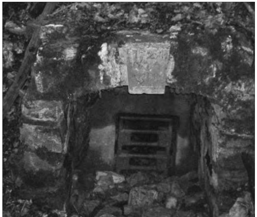
Bild 2: Weiter unterhalb des Felsens befindet sich rechts ein Stollen.