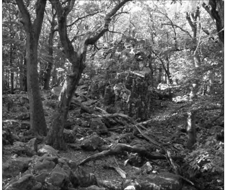
Bild 1: Der Goldgrubenfelsen auf dem archäologischen Rundwanderweg.

Durch radiästhetische Messmethoden, welche in dem Buch von Landspurg, „Orte der Kraft“ beschrieben sind, konnten bezüglich des Goldgrubenfelsens verschiedene Pendelergebnisse erzielt werden. Je nach Jahreszeit verändern sich die