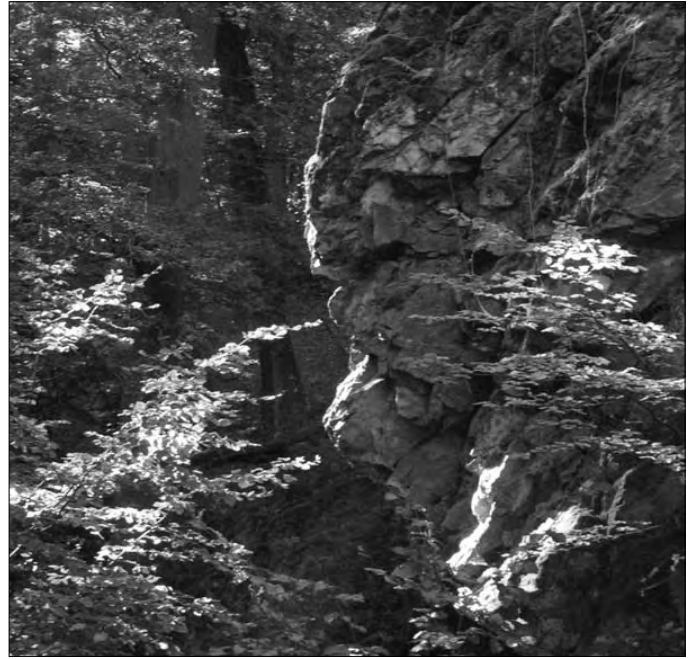
Bilder 3 - 5: Gesicht im Stein.