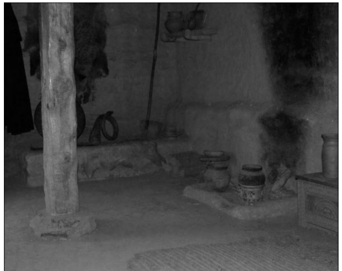
Links Abb. 8: Numantia, keltisches Haus. Rechts Abb. 9: Das Haus von innen.

Die Moral der römischen Truppe war möglicherweise nicht besonders hoch. Erst als Rom den Bezwinger Karthagos nach Spanien schickte, Publius Cornelius Scipio, wendete sich das Blatt. Scipio warf als erstes sämtliche Huren und Händler aus dem römischen Lager und ließ dann die Truppe kräftig arbeiten. Numantia wurde komplett mit Belagerungsgräben und Palisaden umgeben, ein lückenloses Belagerungssystem.