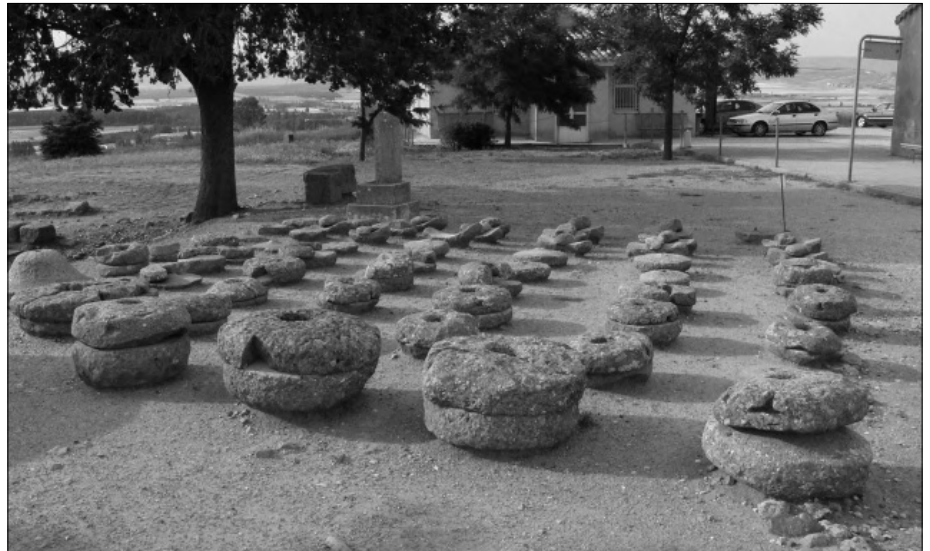
Abb. 4: Numantia, Mühlsteine