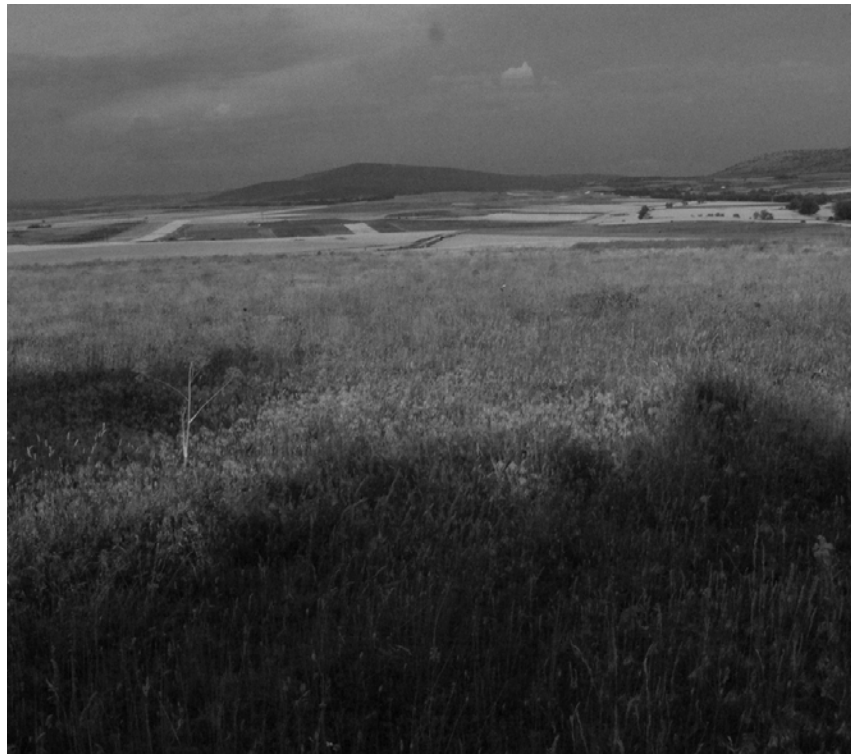
Abb. 1: Ebene um Numantia

Rund zehn Jahre lang verteidigte sich die Stadt unter großen