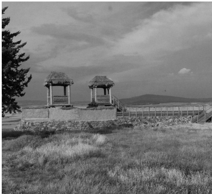
Abb. 2: Numantia, Mauer