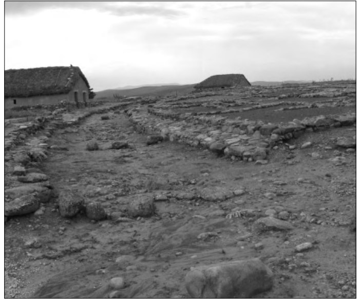
Links Abb. 6: Numantia, Zisterne, rechts Abb. 7: Numantia-Grundmauern.