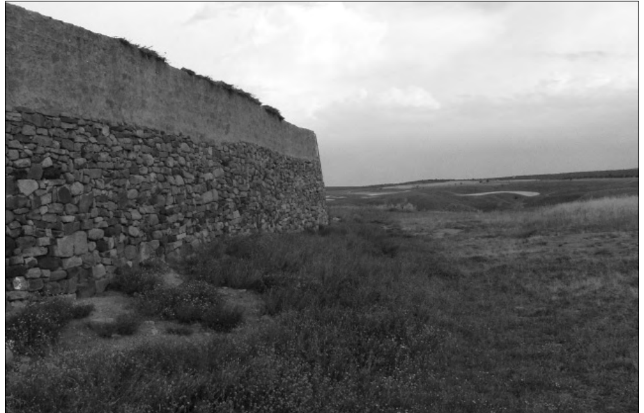
Abb. 3: Numantia, Mauer

Verschiedene Gründe sprechen für die Kelten. Die Bevölkerungszahl scheint in der Stadt und der umgebenen fruchtbaren Ebene relativ hoch gewesen zu sein. Sehen Sie sich allein die Zahl der Getreidemühlsteine an, die im Stadtbereich gefunden wurden (siehe Bild 4).