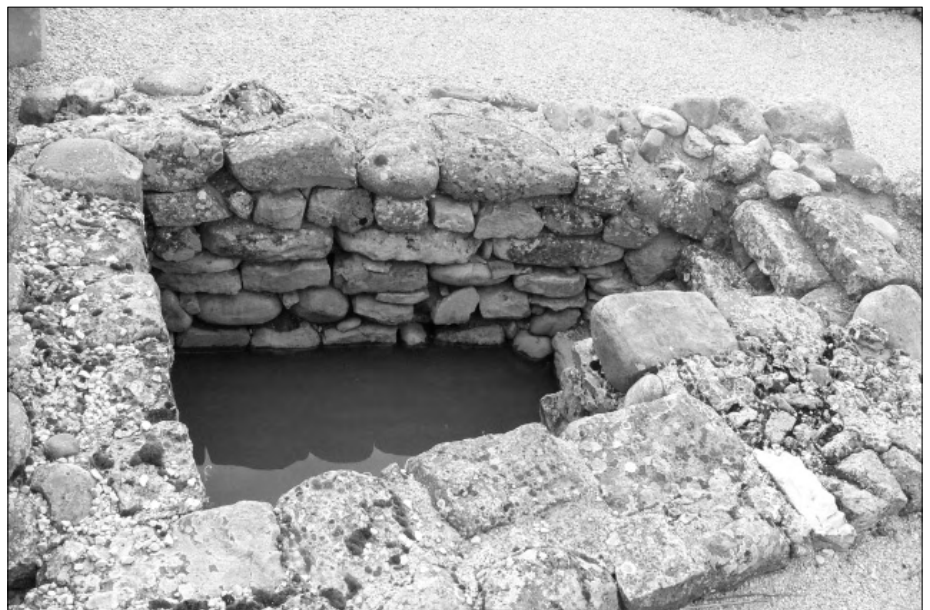
Abb. 5: Numantia, Zisterne