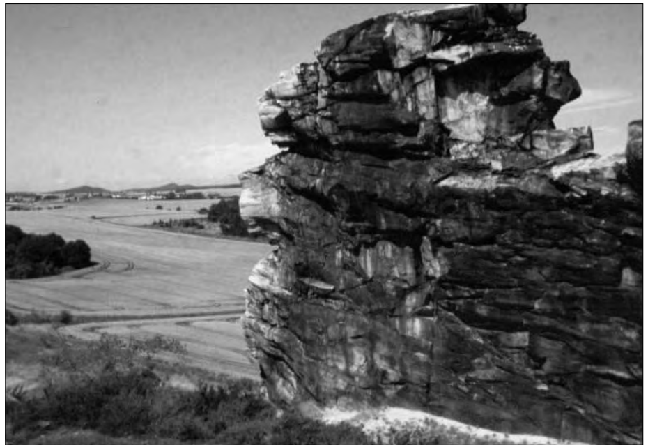
Abb. 5 und 6