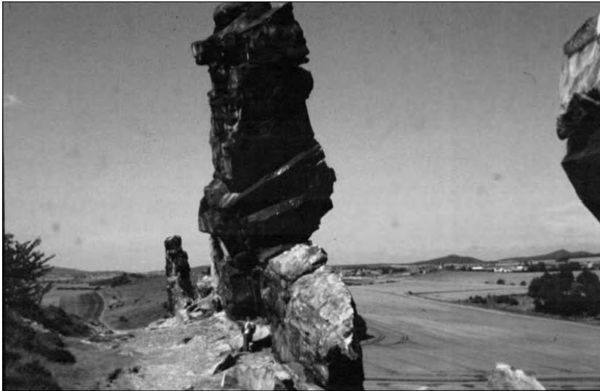
Abb. 1: Sitzt der Teufel noch auf seiner Mauer?

In jener Zeit, als Gott und Teufel die Erde unter sich aufteilten, schlossen sie eine Vereinbarung. Dem Teufel solle alles Land gehören, welches er in einer Nacht bis zum ersten Hahnenschrei mit einer Mauer umbauen könnte.