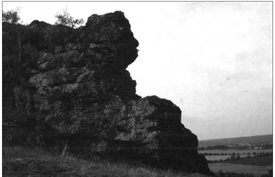
Abb. 4: Eine Sphinx?