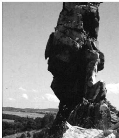
Abb. 2: Hat sich hier ein alter Indianer manifestiert?

Und was sagt die Geologie? Der Harz wurde in der Jura- und Kreidezeit auf das Vorland in Norden aufgeschoben und um einige hundert