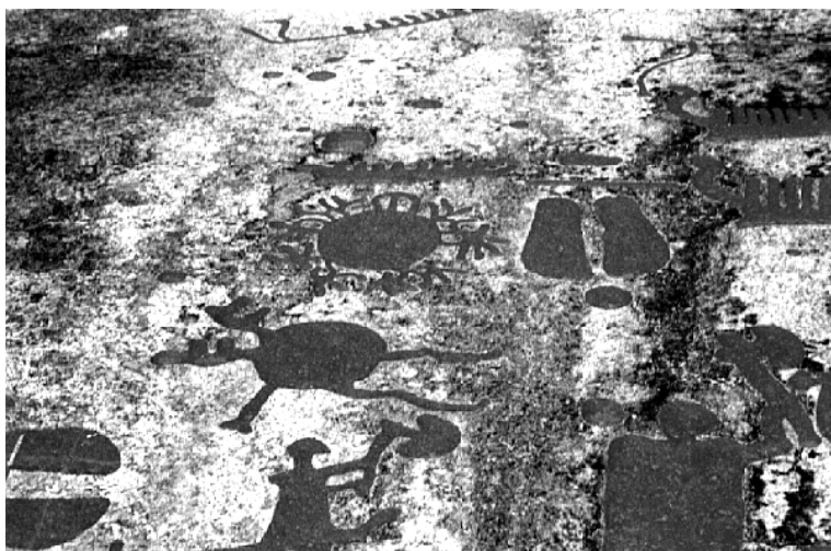
Abb. 2: Fossum

Das Bild zeigt aber noch mehr, nämlich zwei abstrahlende Kugeln, welche zumeist als Sonnen deklariert werden. Auch wenn man noch so viel Phantasie aufbringt, eine Sonne mit fünf justierten Strahlen ist nun einmal schwer vorstellbar. Interessant hier auf jeden Fall die zu sehenden Adoranten (Zauberer) mit Axt und eher einer Schwertscheide ähnelndem „Schwanz“.