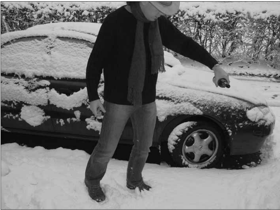
Abb. 9 und 10 - Soll ein Vorhaben gelingen, so muss, das haben wir dort unten gelernt, vorher ein Ritual zu Ehren der Mutter Erde - Pacha Mama - durchgeführt werden. Normalerweise braucht man dazu noch Koka-Blätter, aber wir improvisierten es mit den Utensilien, die irgendwie greifbar waren, und etwas Kölsch zum Verschütten hat man im Bergischen Land ja immer im Hause :-). Dennoch weisen wir darauf hin, derartige Rituale mit der angebrachten Ernsthaftigkeit und gebührendem Respekt vorzunehmen und sich nicht über die Bräuche anderer Völker lustig zu machen, zumal wir ja selber von der Wirksamkeit derartigen Handlungen - lautere Absichten vorausgesetzt - überzeugt sind.