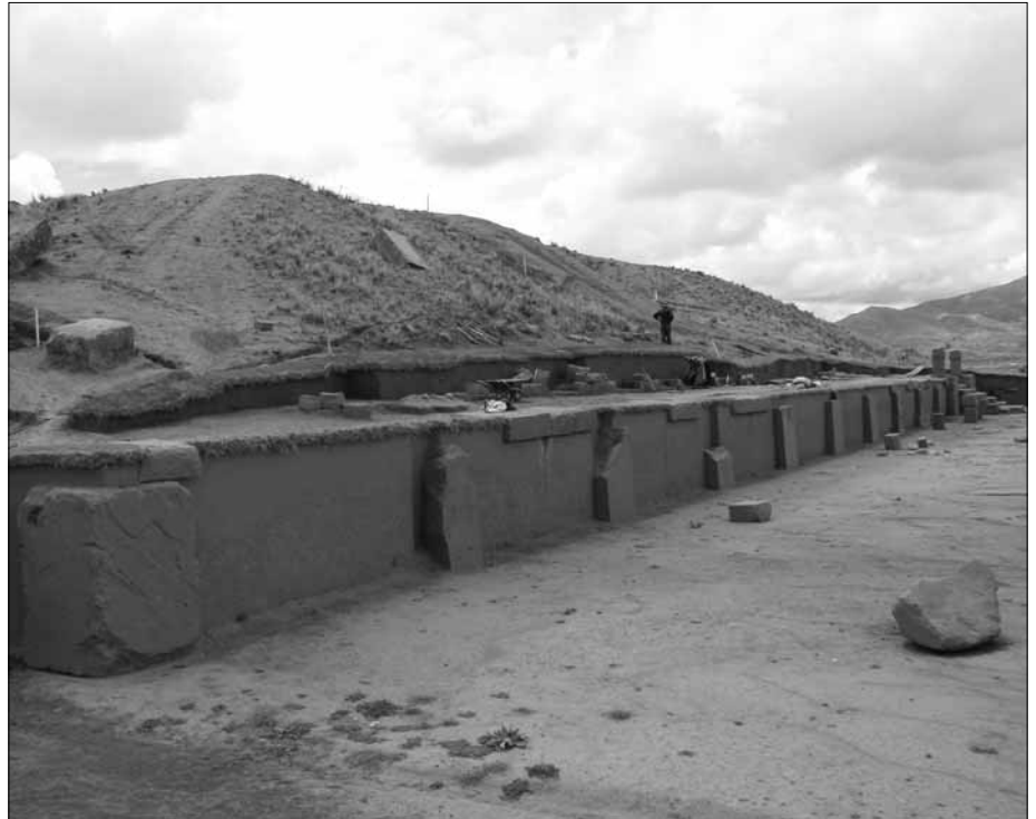
Abb. 1: Freigelegte Mauer der Westseite von der Acapana-Pyramide als Ergebnis der in den letzten Jahren durchgeführten Grabungs- und Restaurationsaktivitäten. Von diesem Bauwerke stammt unsere Gesteinsprobe.

Bei Betrachtung der mittlerweile uns in mannigfaltiger Art vorliegenden Fotos und Detailaufnahmen von Tiahuanaco und Puma Punku fragten wir uns schon seit Längerem, ob angesichts der völlig abwesenden Bearbeitungsspuren in Form von Schleif- oder Schlageinwirkungen auf den Oberflächen sämtlicher von uns untersuchten Exemplare eine Option der künstlichen Herstellung des Baumaterials nicht auf diesen mysteriösen Ort zutreffen könnte, vielleicht auf