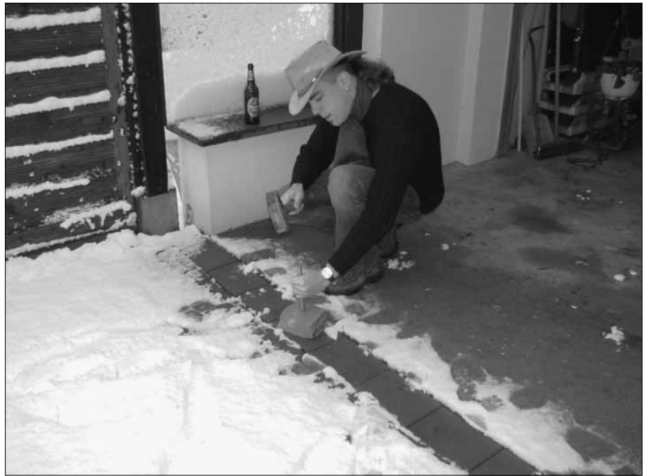
Abb. 11 und 12 - Das Zeremonialbier wird abgestellt, denn nun wird es ernst: Nach einem kritischen Blick, wo am günstigsten draufzukloppen sei, wird die Probe nun mit einem dumpfen Schlag zerteilt.