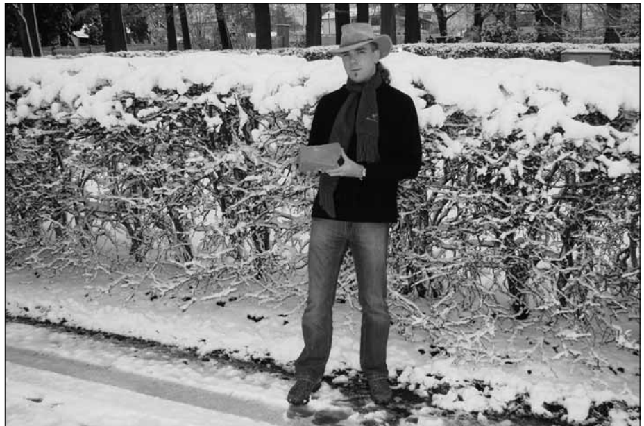
Abb. 7 und 8 - Nach nicht gerade einer alkoholfreien Nacht in Köln (wir konnten nichts dafür, dass Karneval war) fällt es uns, besonders mir, zwar etwas schwer, uns wieder der Ernsthaftigkeit des Themas zu widmen, dennoch halten wir stolzerfüllt ein Stück südamerikanischer Geschichte in der Hand. Wer daran wohl wann gearbeitet hat und in welchem Gebäude es einst einen Platz fand?