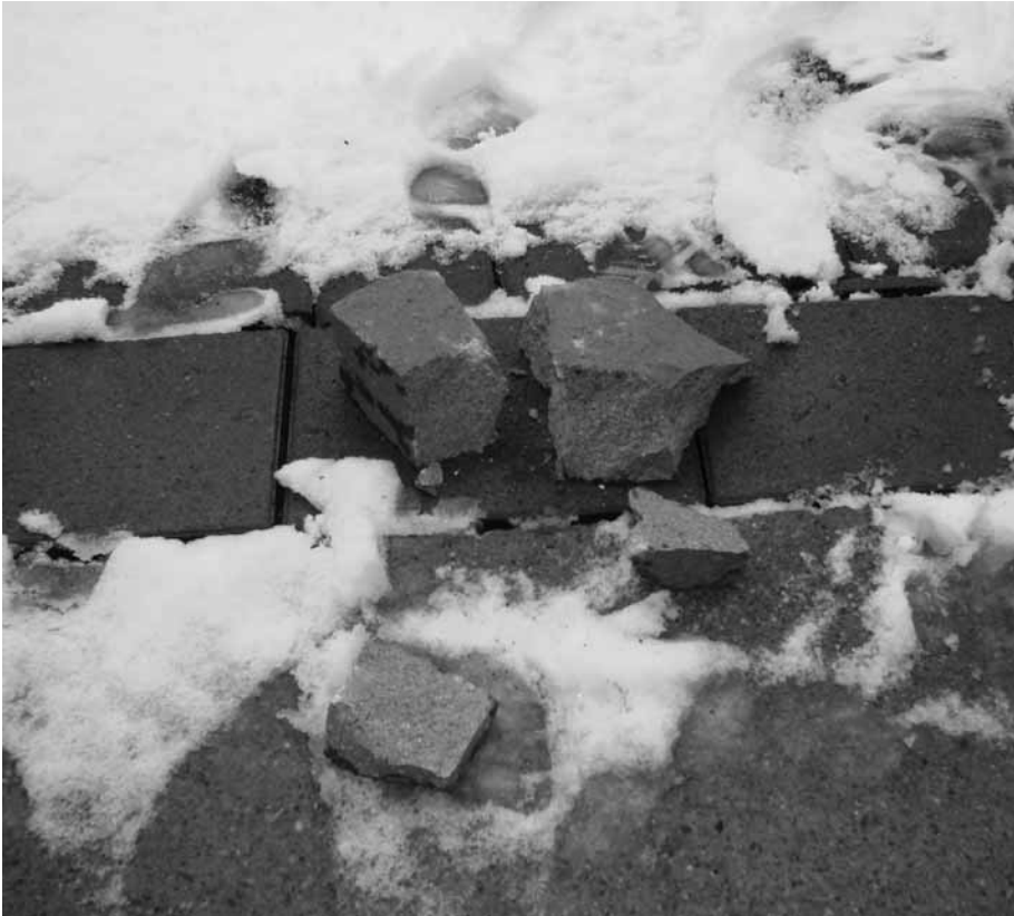
Abb. 13 - Das Ergebnis des heutigen Tages: vier verschieden große Gesteinstrümmer, wovon ein Exemplar zur Analyse an die Hochschule Augsburg in Bayern weitergeleitet wird. Die neu entstandenen Bruchflächen vermitteln noch mehr den Eindruck, es mit dem Werkstoffe Beton zu tun zu haben. Mal sehen, wie das Ergebnis lauten wird.

den wohl die aus vulkanischen Rohstoff bestehenden Bauteile gebrochen und auf Balsafloße (?) verladen.