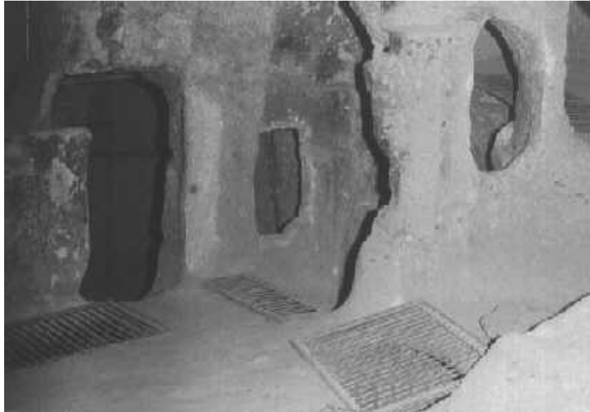
Ein Stollen in Derinkuyu.

Die Räume liegen in verschiedenen Stockwerken, bisher hat man in Derinkuyu bis tief in den Boden reichende 13 Etagen, bis in eine Tiefe von 85 Metern, freigelegt. Es dürften aber 18-20 Stockwerke sein.