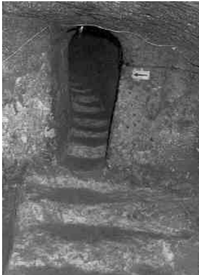
Ein Stollen in Derinkuyu

Kreuzes angelegt; manche Wissenschaftler bezeichnen sie als „Kleeblatt“. Gegenüber dieser Kirche liegt eine Aula mit drei Säulen und einem Warteraum - an die Säulen sollen Gefangene angebunden worden sein. Eine andere Vermutung ist, dass dieser Raum für „Kandils“ benutzt worden sei. Kandil ist die Bezeichnung für je eine der Nächte vor vier islamischen Festen, an denen die Moscheen mit Öllampen beleuchtet wurden.