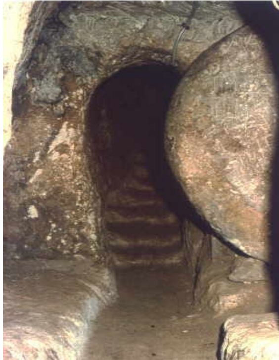
Zugang zu Derinkuyu. Rechts der mächtige Verschlussstein.

Manche der Städte wurden mit Steinen und Sand verfüllt. Als sich im 7. Jh. das Christentum ausbreitete, baute man Kirchen in die Höhlen hinein. Ende des 7. Jahrhunderts gehörte dieses Gebiet den Semschuken, die ihre Kirchen mit Felsbildern versahen. Im 14. Jahrhundert besiedelten die Osmanen das Gebiet. Die Vermutung der Archäologen, Christen hätten diese unterirdischen Städte angelegt, ist also alles andere als stichhaltig.