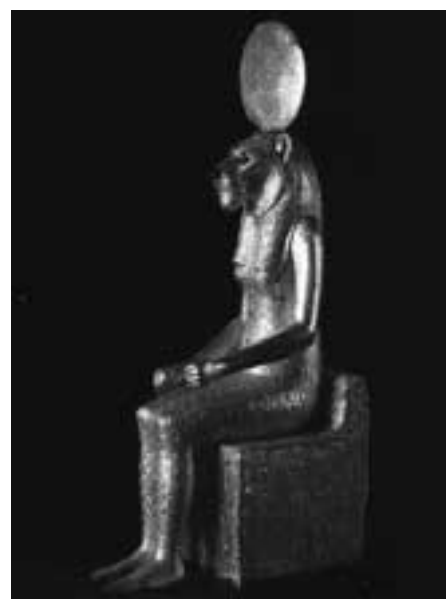
Statue der löwenköpfigen Sekhmet (Sachmet) von Memphis (Ägyptisches Museum Kairo)

Mit diesen Indizien darf man also die ägyptischen Löwengöttinnen ebenfalls als ursprünglich lokal verehrte „Große Muttergöttin“ identifizieren. Gleiches gilt für die kuhgestaltigen Göttinnen, wobei Neith in Unterägypten und Hathor in Oberägypten besonders deutliche Hinweise auf ihre einstige Bedeutung in prähistorischer Zeit in die pharaonische Epoche hinübergerettet haben.