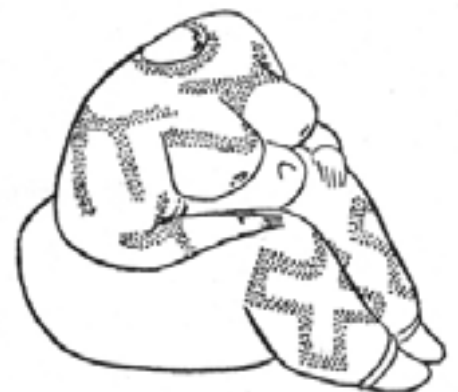
Bemalte Tonfigur einer Göttin (Catal Hüyük)

das Abendland gebracht hat, zu schweigen von den Folgeerscheinungen, die wir in Krieg, Kolonialismus und ungehemmtem, unkontrolliertem Fortschrittsdenken als Frucht dieses Aufstiegs des Mannes zur Macht registrieren müssen.“ [S. 100]