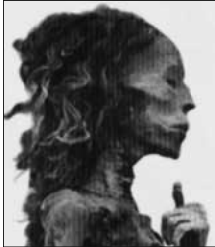
Königin Hatschepsut (rechts ihre Mumie)

nung als Pharao durch die Fachwelt." [S. 246].