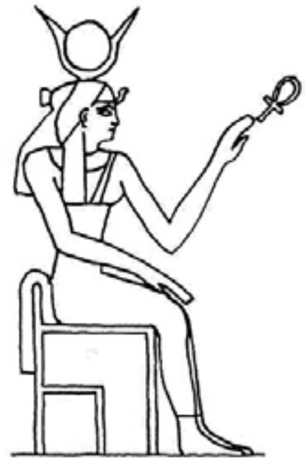
Die Göttin Hathor

Und der Autor Howard Reid ergänzt, dass der Glaube an Hathor bis weit in die vorpharaonische Zeit zurückreiche [„In Search of the Immortals“, S. 166]. Jüngste Grabungen an der oben erwähnten oberägyptischen Höhle haben sehr starke Beweise für die Existenz des Kuh-Fruchtbarkeitskultes der Hathor dort erbracht. Aus den Ergebnissen ergibt sich tatsächlich, dass die Höhle am Rand des Tals der Königinnen wie in Quercy als Leib der Großen Göttin verstanden wurde: