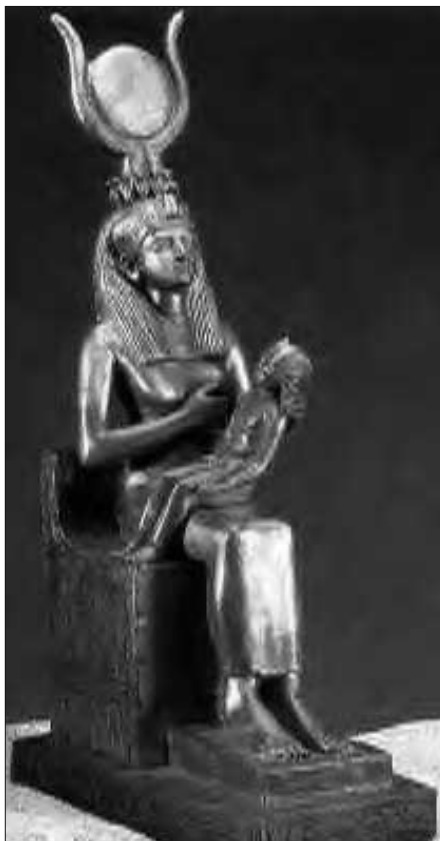
Isis säugt Horus

auch weitgehend totgeschwiegen oder im besten Fall verneint, so war man zu Beginn des 20. Jahrhunderts noch nicht so sehr in Dogmen und Konventionen gefangen.