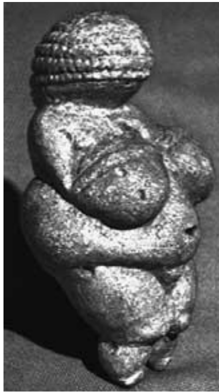
Die „Venus von Willendorf“

„Sie folgten aus den konsequenten Bestrebungen der von Überlegenheitsgefühl und Herrschsucht geprägten, in Jagd und Kampf führenden Männer, die Große