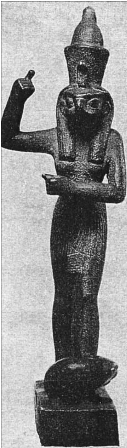
Horus mit Falkenkopf