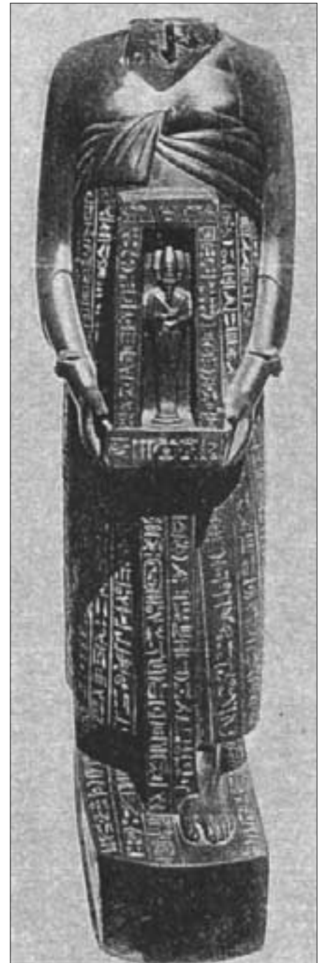
Uza-Hor-resnet, größter Arzt in Sais.

die Ausdehnung der in seinem Inneren freigesetzten Gasmassen. Dadurch wurde der Sintflutkomet in sieben große Einzelteile zersprengt. Fast alle Kometenfragmente schlugen in den Meeren ein, zwei im Nord- und Mittelatlantik, einer im Indischen Ozean, vier im Pazifik und seinen Randmeeren (Ostpazifik westlich von Guatemala und Feuerland, westpazifische Randmeere im Südchinesischen Meer und der Tasmansee) [Tollmann & Tollmann, S. 23-27]. Eindrucksvoll schildern die Tollmanns die aufgrund neuester Forschungen ermittelten Auswirkungen eines solches Ereignisses, bei dem die Energie von bis zu hundert Millionen Hiroshima-Atombomben freigesetzt wird: