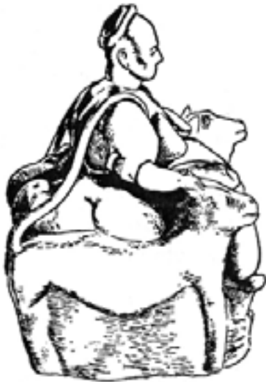
Tonstatuette einer gebärenden Göttin (Catal Hüyük)