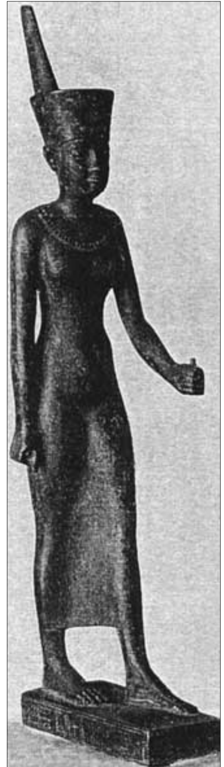
Göttin Neith von Sais

Wenn aber eine Göttin die beiden wichtigsten Attribute des gesamtägyptischen Königums in sich vereinte, liegt es da nicht nahe anzunehmen, dass jene Symbole erst nach der Reichseinigung eben wegen der Göttin gewählt wurden