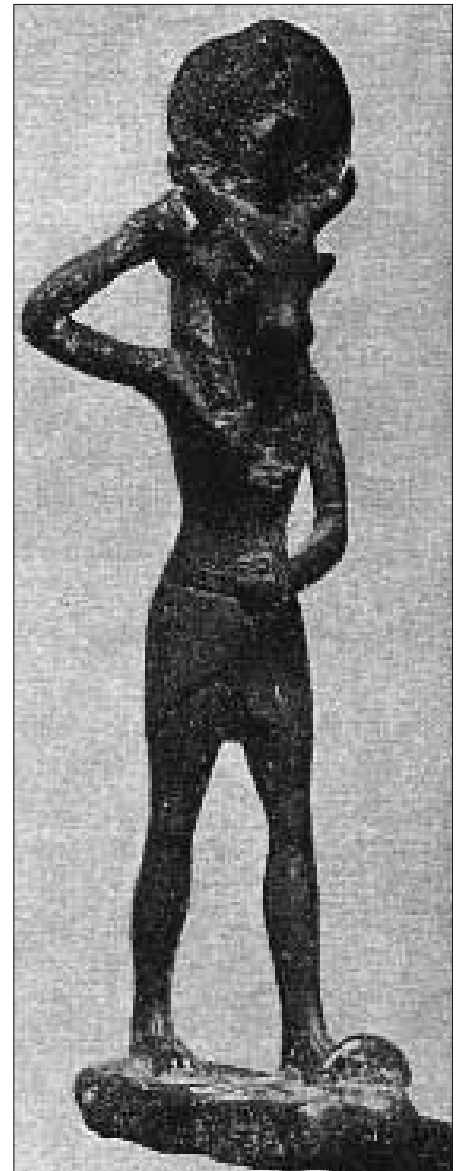
Horus mit Stierkopf

Heute vertritt fast nur der relativ unkonventionell denkende Christian