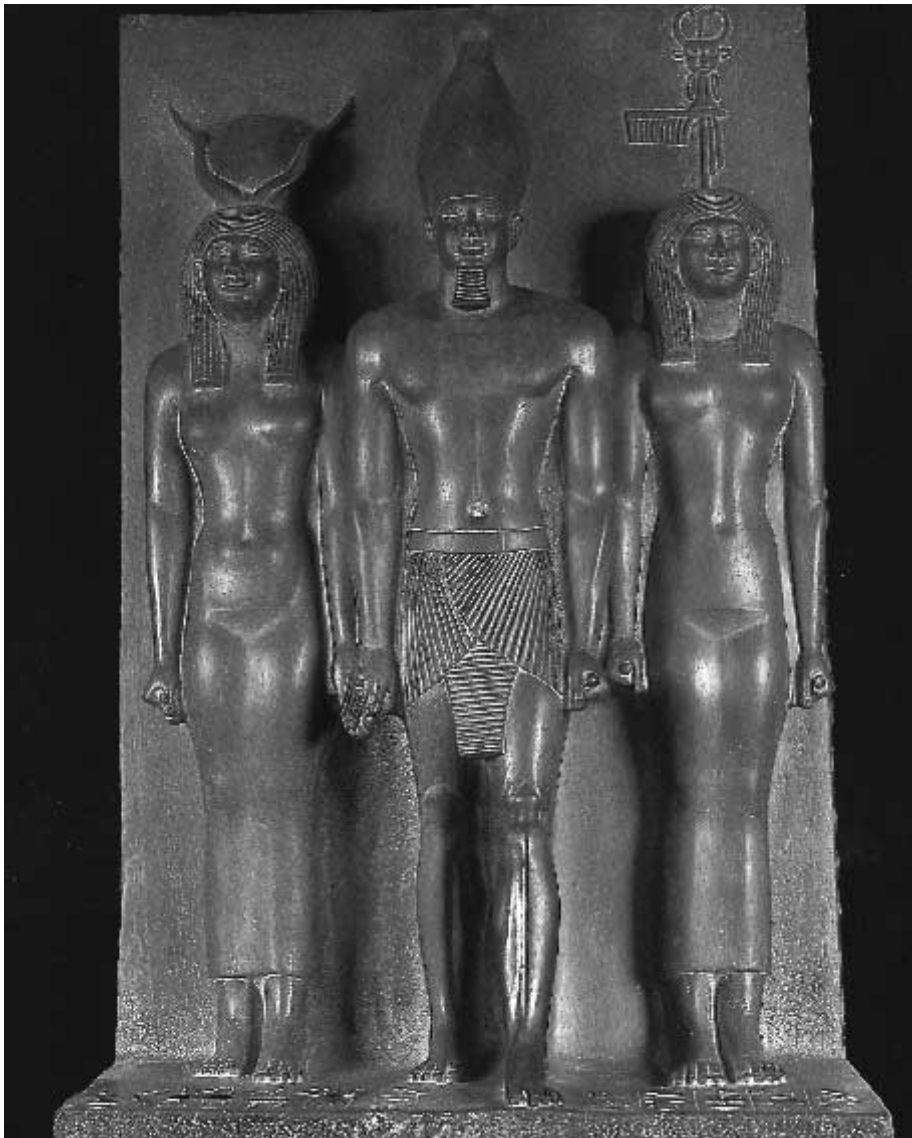
Mykerinos (Men-kaw-Rè) zwischen Hathor (links) und Gau-Göttin VII.

„Es entstand keine einem Atompilz ähnliche Explosionswolke, sondern aufgrund der unvergleichlich höheren Energieentwicklung wurde das beim Aufschlag verdampfte Gestein und Meerwasser in einer geraden Fontäne, wie eine Keule zum Himmel geschleudert. Der Explosionsstaub und -dampf dehnte sich erst in sehr großer Höhe aus und verdunkelte die Sonne. Die peripheren, nicht verdampfenden Wassermassen wurden wie ein Ring feuriger Todeszungen seitlich schräg hochgeschleudert ... Denn aufgrund dieser Forschungsergebnisse (die hier aus Platzgründen leider ausgespart werden müssen, der Leser sei an das Literaturverzeichnis verwiesen, Anm. d. V.) kennen wir heute genau die vollständige Palette der Ereignisse, die stets mit einem Großimpakt verbunden sind: Weltenbeben, Hitzeorkan, Weltenfeuer, Meeresflutwellen, Flutregen, Giftgasproduktion, erhöhte Radioaktivität, Säureregen, Impaktnacht, Impaktwinter und Massensterben.“ [ebd].