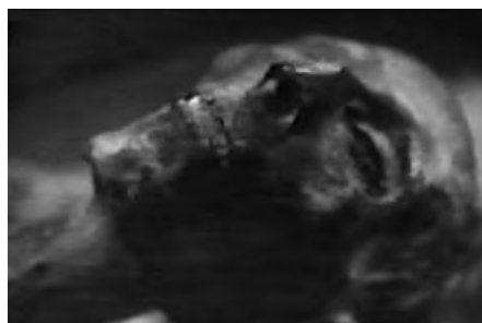
Mumie von Ramses II.

„Unbezweifelte, wenn nicht unheimliche Ähnlichkeiten von Kunstformen werden auf beiden Seiten des Pazifiks