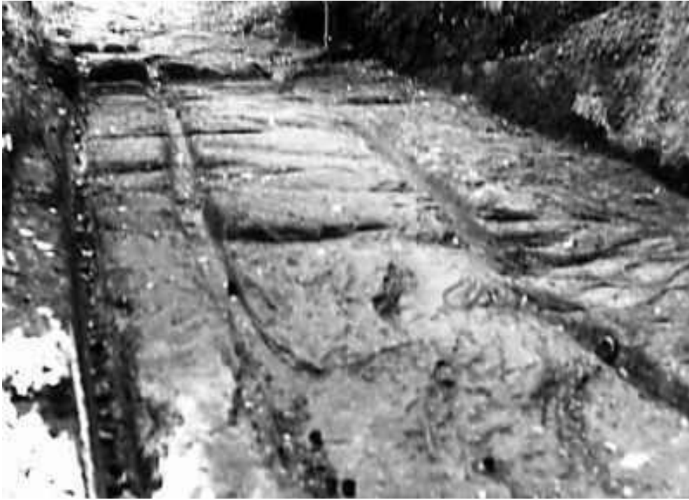
Gleisanlage beim keltischen Oppidum „Heidenstadt“