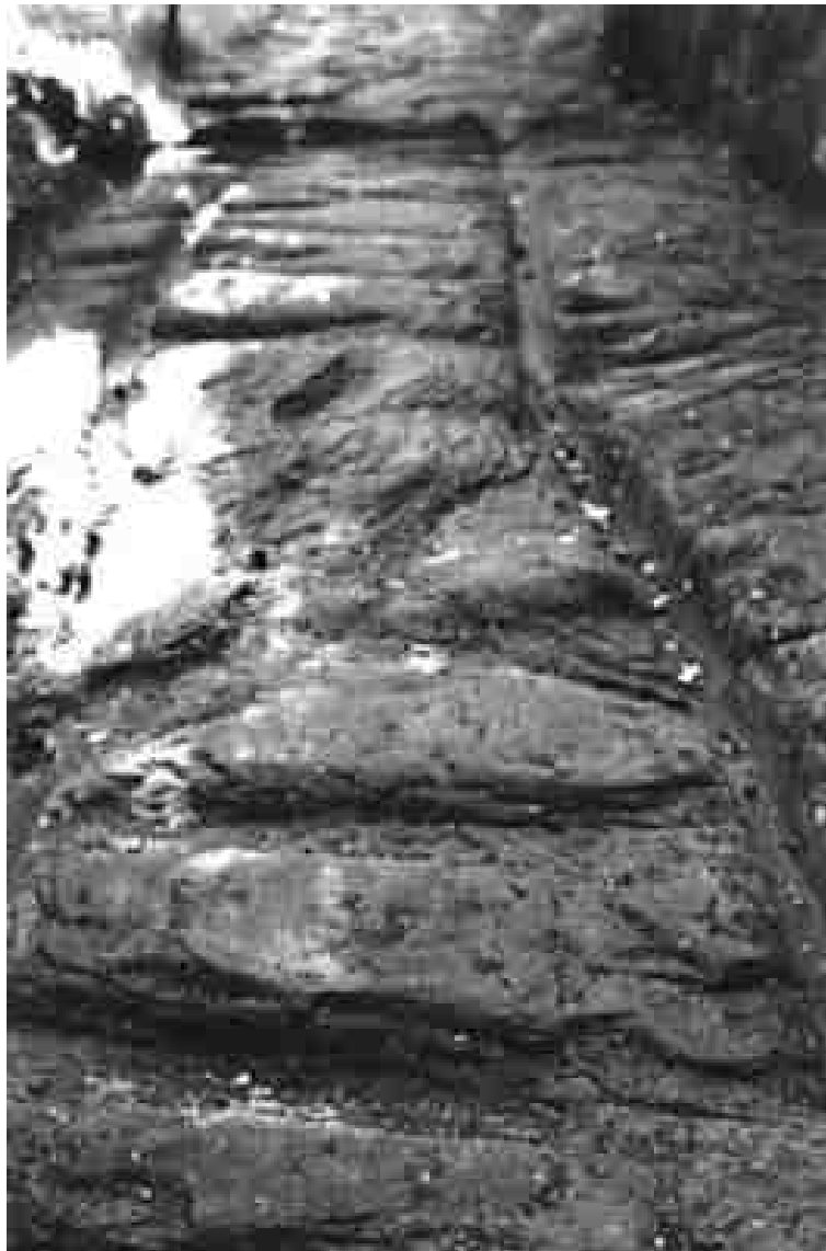
Gleisanlage beim keltischen Oppidum „Heidenstadt“

Katastrophe durch eine spätere Zivilisation (Kelten oder Römer) erneut benützt wurde, diesmal mit sehr viel kleineren Wagen. Die Auswirkung der Katastrophe ist auch hier als deutliche Verzerrung erkennbar, das alte Gleis war nicht nur zu groß für spätere Benützer, sondern offensichtlich durch Felsdeformation unbrauchbar geworden. Das gepflasterte Stück („Plattenweg“) enthält natürlich nur die Schmalspur, die Platten überdecken die ehemalige Außenrinne des breiten Gleises. Darum ist die wissenschaftliche Bezeichnung dieses frühgeschichtlichen Bodendenkmals als „Plattenweg“ verkehrt, sie lenkt von der eigentlichen großartigen Anlage ab und steckt den Römern eine Ehrenfeder mehr an den alten Hut.