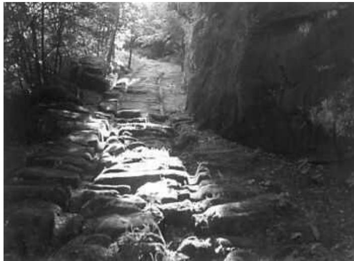
Gleisanlagen beim keltischen Oppidum „Heidenstadt“

Im Juni d.J. hatte ich endlich Gelegenheit, eins der bekannten keltischen Gleise in den Vogesen anzuschauen. Das keltische Oppidum „Heidenstadt“ liegt oberhalb des sehr bemerkenswerten christlichen (sicher uralten) Heiligtums St. Michel bei Zabern im nördlichen Lothringen. Zwei enorm breite und hohe Erdwälle, die einst den Zugang von Ost und West in die Stadt versperrten, sind noch gut erhalten, sonst sieht man fast nichts mehr von dem Oppidum. Die beiden gleisartigen Zugangsstraßen deuten allerdings darauf hin, dass die Anlage früher anders ausgesehen haben muss, die beiden genannten „Zangentore“ und Wälle zur Verteidigung der Stadt waren vermutlich noch nicht vorhanden. Zumindest die ehemalige Westeinfahrt missachtet das keltische Zangentor (siehe Zeichnung). Wiederum ergibt sich, dass zu den Gleisestraßen eine langwährende Friedenszeit gehört haben muss und die als Verteidigungsmaßnahmen erhaltenen Reste einer späteren Zeit zuzurechnen sind, hier vermutlich der keltischen Eisenzeit.