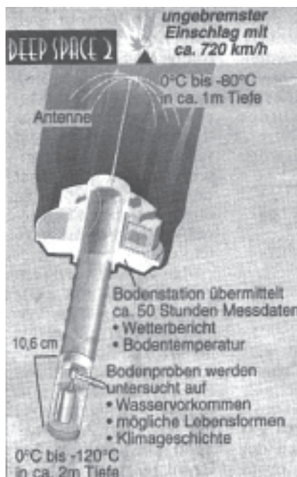
Die beiden Mini-Sonden vom Typ „Deep Space 2“ sollten in den Marsboden einschlagen und aus etwa zwei Metern Tiefe Daten liefern

Doch kurz vor der Landung brach die Funkverbindung ab. Zunächst erklärte die NASA, die Unterbrechung sei wegen des Landevorganges passiert, die Sonde sei inzwischen gelandet und man warte „nur“ ab, bis sich der aufgewirbelte Staub niedergeschlagen hätte. Doch dann stellte es sich heraus, daß auch mehrfache Versuche der NASA-Techniker, den Kontakt wieder herzustellen, scheiterten.