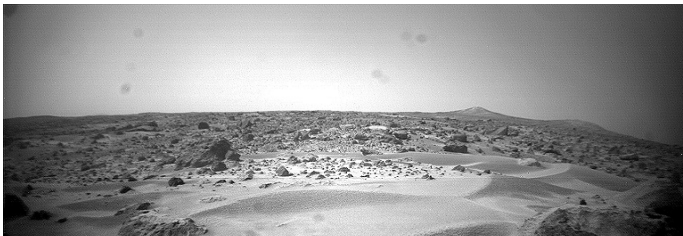
Marsoberfläche, gesehen vom „Mars-Rover“ Sojourner: Blick auf „Twin Peaks“, die zwei Hügel am Marshorizont.

wird das Wort ADaMa'H einerseits von ADa'M und andererseits von Ado'M. Beide Begriffe basieren ihrerseits wieder einmal auf der Wurzel DaM. Die wörtliche Übersetzung des Begriffes ADaMa'H muß folglich „Geröteter“ lauten, denn AdoM ist das hebräische Wort für Rot. Wobei - wie wir bereits gesehen haben - die Wurzel DaM „Blut“ bedeutet und als solches ebenfalls in einem engen Zusammenhang mit der Farbe Rot steht. Indem jedoch der Begriff in alter Zeit auch für den fruchtbaren Ackerboden (Erdkrume) benutzt wurde, müssen wir das Wort ADaMa'H zweifelsfrei als „gerötetes Erdland“ ins Deutsche übersetzen.