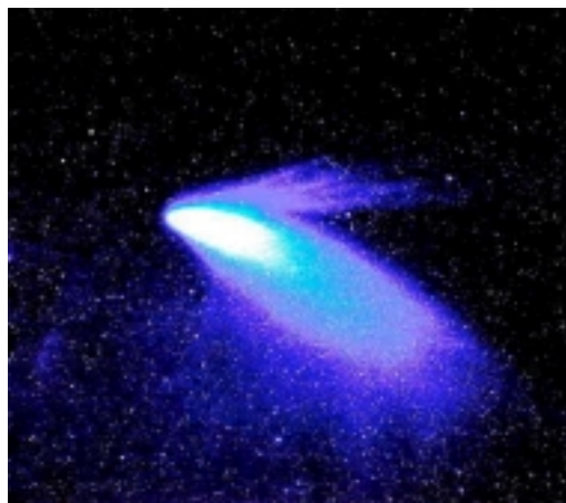
Hale-Bopp mit seinen zwei Schweifen

Geht man in die Vergangenheit der Menschheit zurück, dann müssen wir zugeben, dass die Panik der Menschen nicht unbegründet ist, denn sowohl auf dem Planeten Erde, auf dem Mond als auch auf anderen Planeten unseres Sonnensystems finden ständig derartige Katastrophen statt. Erst im Jahre 1994, als der nach dem Ehepaar Carolyn und Eugene Shoemaker und David Levy benannte Komet auf den Jupiter stürzte, wurde uns allen wieder bewusst, dass kosmische Zusammenstöße eben doch nicht ins Reich der Phantasie gehören. Astronomen konnten recht exakt beobachten, wie die bis zu zwanzig Kilometer großen Brocken - aufgereiht wie auf einer Perlenkette - in die Atmosphäre des Jupiter eindringen. Aber Jupiter ist keine Ausnahme. Wie wir heute wissen, gab es auch auf unseren Nachbarplaneten derartige Einschläge. Die gesichteten Krater auf dem Merkur, der Venus und dem Mars zeigen deutlich, dass Kollisionen mit Himmelskörpern ganz normal sind.