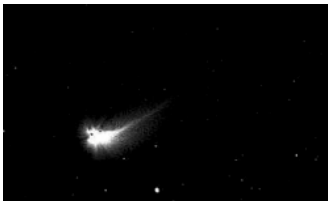
Hale-Bopp Anfang März 1997

Langsam ging die Sonne unter. Das blaue Meer wurde blutrot, und zögernd erschien am dämmerigen Nachthimmel der Mond als schmale, kaum wahrnehmbare Sichel. Vereinzelt wurden Sterne erkennbar und plötzlich - nicht unerwartet - wurde der Komet am beharrlich dunkler werdenden Himmel sichtbar.