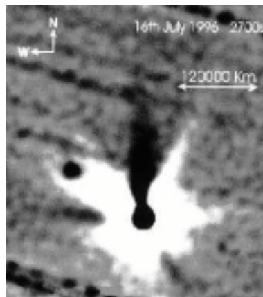
Die sechs Jets des Kometen (Observatorio del Teide/Teneriffa)

Die Heimat der meisten Kometen soll mit hoher Wahrscheinlichkeit der „Kuiper-Ring“ und die „Oortsche Wolke“ sein (4). Zumindest werden von professionellen Astronomen in diesen Regionen die meisten kometenartigen Objekte entdeckt. Im Jahr sind dies durchschnittlich immerhin sechs Stück.