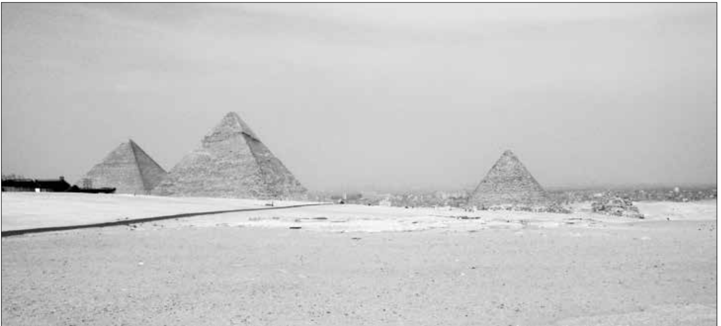
Die drei Gizeh-Pyramiden

Pyramide zu errichten. Vielmehr muss es als Gegebenheit betrachtet werden, dass der Großteil des Felskerns erhalten blieb und lediglich stufenweise abgetragen und so bearbeitet wurde, dass er den Wünschen seiner Baumeister entsprach. Für diese These spricht u. a., dass die Innenkonstruktion verhältnismäßig einfach strukturiert ist. Verblüffend ist bei dieser Einfachheit nur, dass sich alle Maße nach dem Scheitelpunkt und der exakten Mitte der Pyramide ausrichten. Mit heutigen Maßstäben verglichen, wäre dies nur mit modernster Vermessungstechnik möglich.