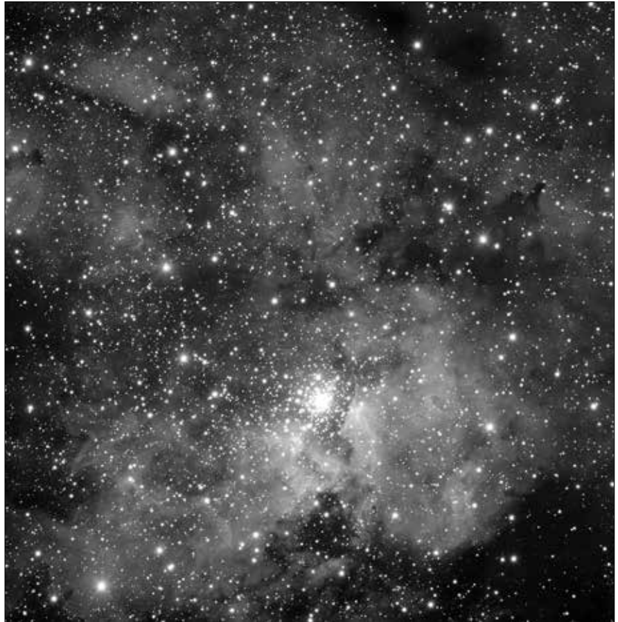
Abb. 1: Der Weltraum wimmelt von Aberbillionen Sternen (und Galaxien). Wie wir heute wissen, wird fast jeder Stern von Planeten umkreist. Selbst wenn nur ein kleiner Prozentsatz der Planeten erdähnlich sein sollte, sind das immer noch Billionen Planeten. Aber nur auf der Erde soll sich intelligentes Leben entwickelt haben?

Spielen wir solch ein Szenarium doch einmal durch: Ein fremdes For-