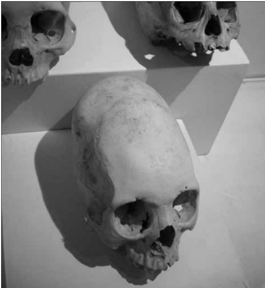
Abb. 2: „Blasenschädel“ im Inka-Museum in Cuzco (Peru). Schädel von Außerirdischen?

gen und dort auf einem „passenden“ Planeten zu landen. Zumindest über einen längeren Zeitraum müssten die Ankömmlinge in ihren Raumschiffen gelebt haben und irgendwelche Gegenmittel entwickelt haben, um eine gewisse Immunität gegen die irdischen Erreger zu erreichen. Ganz ähnlich wird es zukünftigen irdischen Raumfahrern gehen, wenn sie ein fremdes Sonnensystem erreichen.