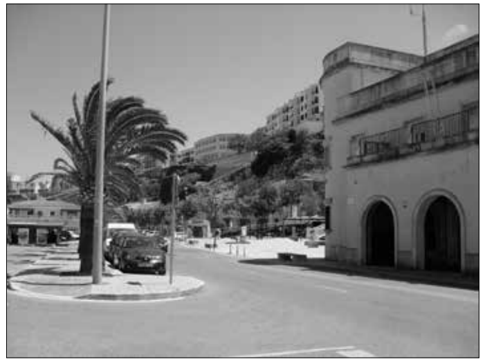
Links: Ein weiterer Unterstand, zusammengebrochen. Rechts: Hübsch angelegte Straße am Hafen.