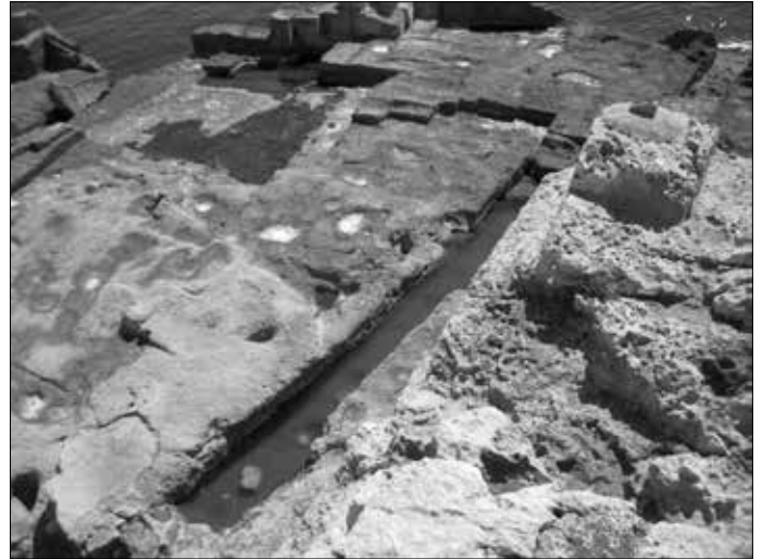
Weitere Steinbearbeitungen an der Küste Ciutadellas.