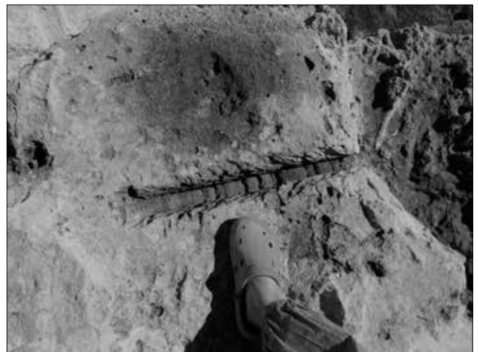
Links: Steinbearbeitungen, die teilweise überschwemmt sind. Rechts: Nahaufnahme eines Steinschnittes.

Die verwendeten Trennscheiben müssen einen Durchmesser von wenigstens einem Meter gehabt haben, was sich anhand der Schnittspuren erkennen lässt. Doch selbst wenn man davon ausgeht, dass die Steinbearbeitungen „nur“ einige Hundert Jahre