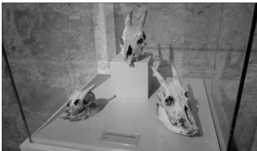
Schädel von irgendwelchen Urtieren im Museu Municipal de Ciutadella.

Reise- und Besuchstipps für Sehenswürdigkeiten oder Objekte abseits normaler Fahrtrouten