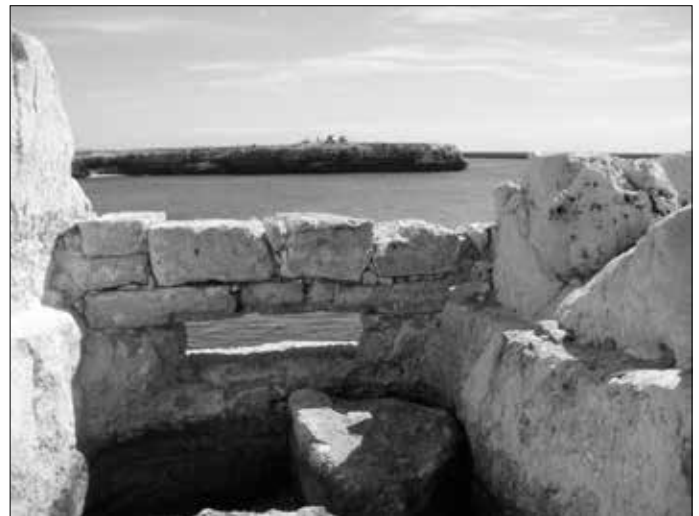
Links ein Unterstand und rechts eine Art Schießscharte aus geschichtlicher Zeit, als man hier Verteidigungsanlagen schuf.