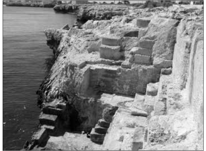
Die Steinbearbeitungen an der Küste, treppenförmig wie auf Mallorca.