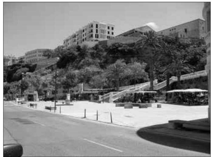
Links: Am Hafen, im Hintergrund liegen teure Yachten vor Anker. Rechts: Gegenüber kleine Krimskrams-Buden und Straßencafés.

Verteidiger gegen Angreifer verschanzen konnten.