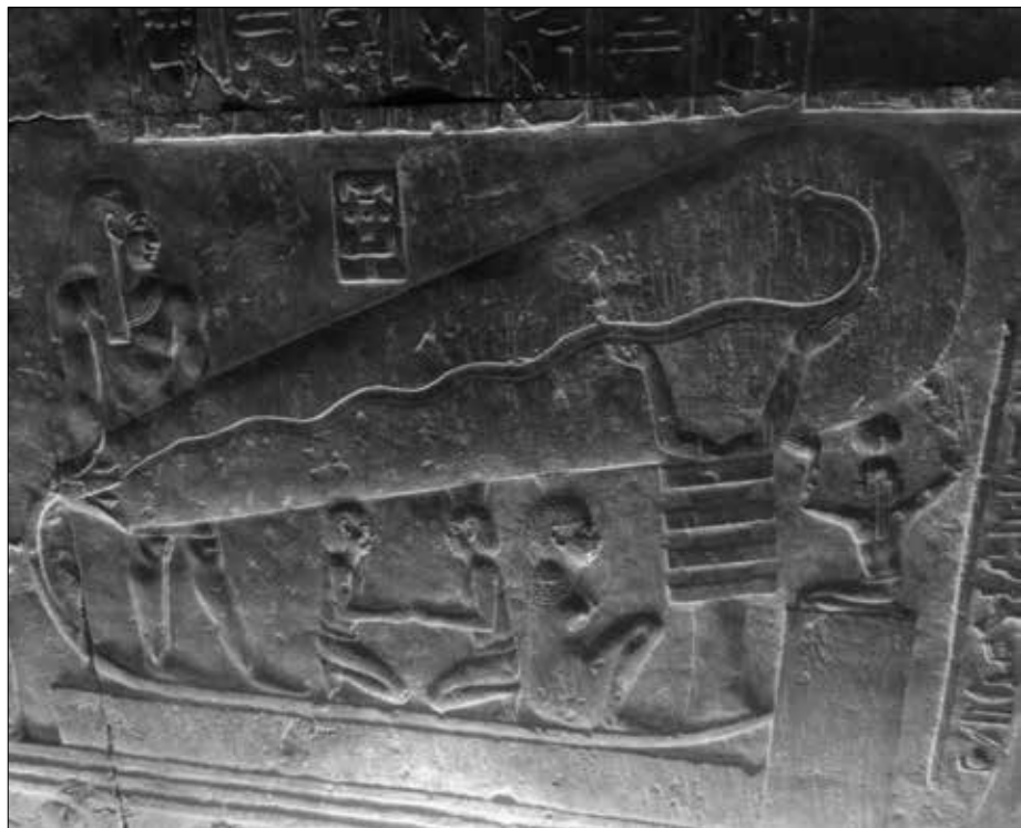
Eine weitere „Glühbirnen“-Darstellung in der Krypta. Auch hier das „Kabel“, das zu einem „Batteriekasten“ führt, daneben ein Djed-Pfeiler in Kombination mit der Lebenskraft „Ka“. Um das Ka noch zu verdeutlichen, hat man es hinter dem Djed nochmal als Figur dargestellt.

Weiterhin kommt bei diesen Darstellungen die „Schutzmacht Ka“ hinzu. Ka wird im allgemeinen durch ein Symbol abgewinkelter Arme mit nach oben gerichteten Handflächen dargestellt. Ka wird als Lebenskraft definiert, die stets