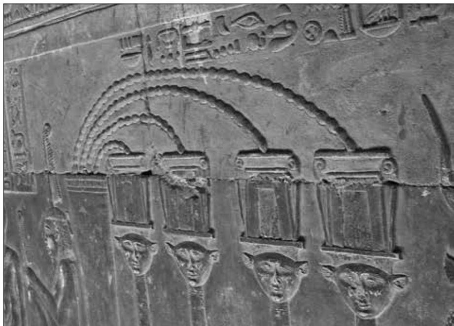
Modern interpretiert sieht es hier aus, als ob Stromkabel zu verschiedenen Batteriekästen führen würden. Darunter die Kopf-Darstellungen der Göttin Hathor mit ihren Kuhohren.

mit einem Körper (oder Ersatzstatue) verbunden war und diesen schützte. Ka ist immer im Spiel, wenn dieses Symbol verwendet wird, auch in Verbindung mit Djed-Pfeilern oder Personen oder Göttern.