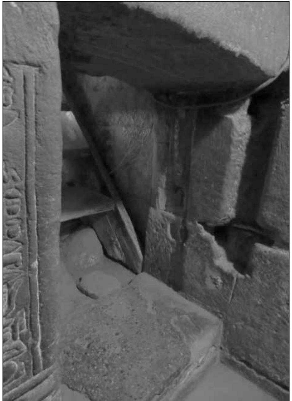
Der sehr enge, beschwerliche Zugang zur Krypta, aufgenommen aus dieser.

Neben der großen Tierkreis-Darstellung (das farbenfrohe Original befindet sich im Pariser Louvre, im oberen Stockwerk des Dendera-Tempels befindet sich heute nur eine schlechte Schwarzweiß-Nachbildung) wurde dieser Tempel durch seine Krypta bekannt, die nur durch einen fast versteckten, engen Zugang erreichbar ist. Die Krypta ist mit bearbeiteten Granitsteinen