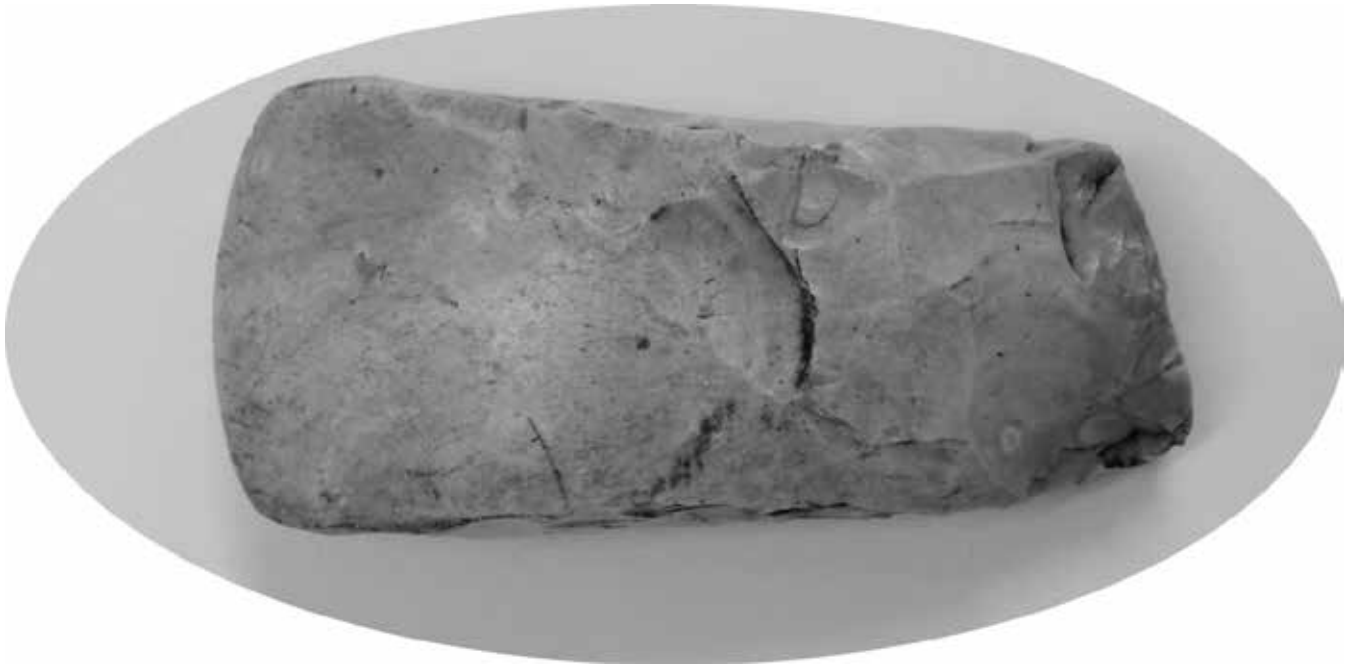
Abbildung 1: Das Steinbeil von Vehlow