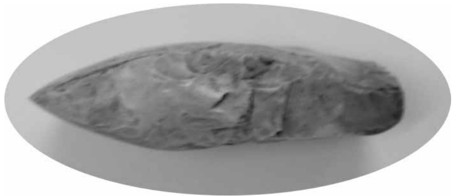
Abbildung 2: Das Steinbeil von Vehlow

Die Anlage der „Wikingerburgen“ ist etwa 4000 Jahre alt; die Naturkonstante und Kreiszahl \pi wurde bei ihrem Bau schon lange nicht mehr konstruiert, sondern mit der Größe 22/7 berechnet. Das Wissen um die Größe e dagegen ist min-