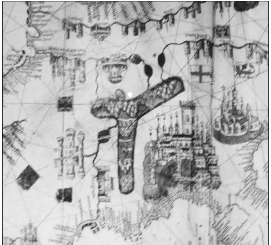
Abb. 3: Portolan von Albino de Canepa, 1489.

Deutlich sichtbar wurde der damals offensichtlich gut bekannte Küstenverlauf von Mittelmeer und Atlantik in allen Portolanen sehr genau eingezeichnet (bis auf die nördlichen Regionen), während das Landesinnere eher ungenau (bildhaft - oder sagenhaft?) dargestellt wird. Augenscheinlich konnte damals nur auf dem Wasser – mit einem zuverlässigen Horizont – navigiert, und mit Hilfe von Orientierungspunkten an den Küsten unter Verwendung von Windstrichlinien exakt vermessen werden. Die friesische und angelsächsische Nordseeküste sowie die Ostsee erscheinen entgegen der heute bekannten Gestade stark stilisiert. Offensichtlich war damals der sich dort früher wohl noch ständig ändernde Küstenverlauf bis kurz nach dem „Letzten Großen Ruck“ (oder die „grote Manndrank“) etwa um ~ +1350 noch nicht genauer bekannt. Betrachtet man die (hier nur teilweise gezeigten) kompletten Karten, fällt auf,