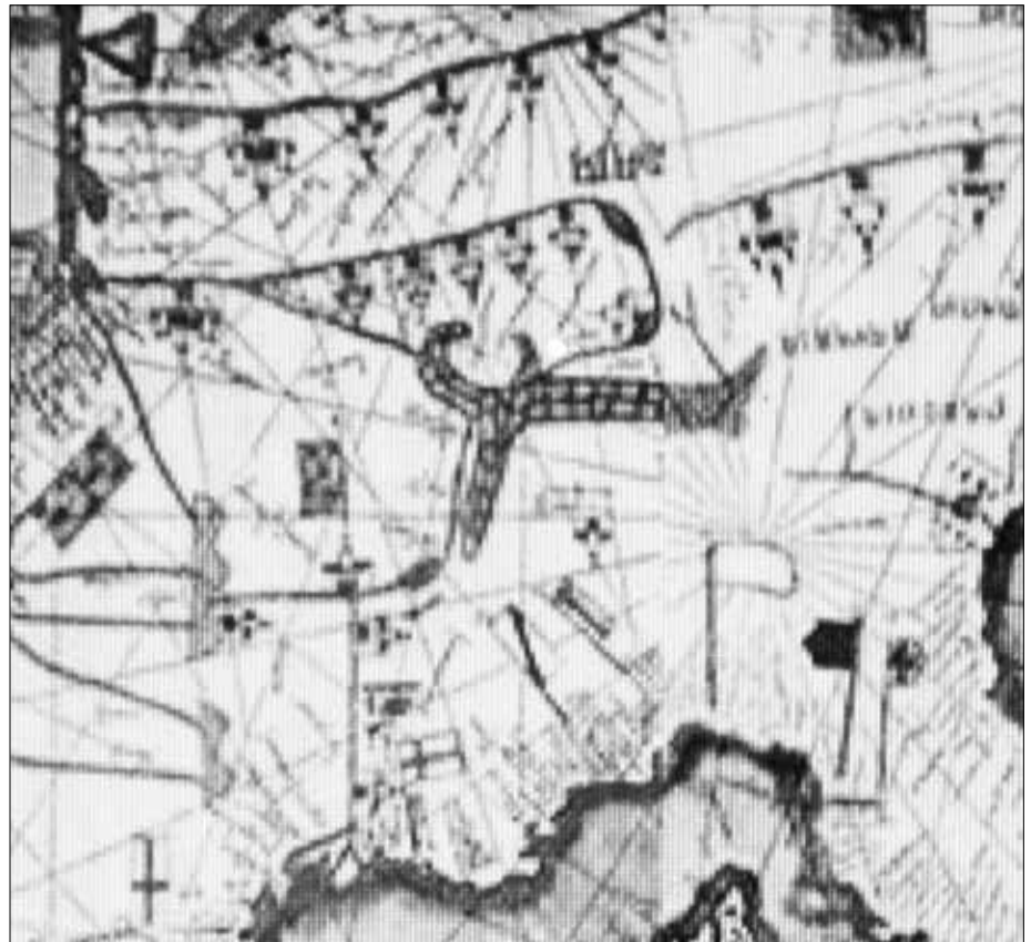
Abb. 2: Katalanischer Atlas von Abraham Cresques, 1375.

Da also das Binger Loch, wie in der „Thurmbergsage“ beschrieben, irgendwann vor der sogenannten „Römerzeit“ tatsächlich mehr oder weniger geschlossen war und den Fluss auch im Hochrheingebiet bis über den Bodensee hin zu einem See aufgestaut hatte – den oben erwähnten Karten nach mit Ab- bzw. Zuflüssen in nördlicher und südlicher Richtung – könnte dies natürlich ein guter Grund zur Erbauung der von mir entdeckten „Wall-Stadt“ bzw. Terrassenanlage gewesen sein. War unsere „keltische Ansiedlung“