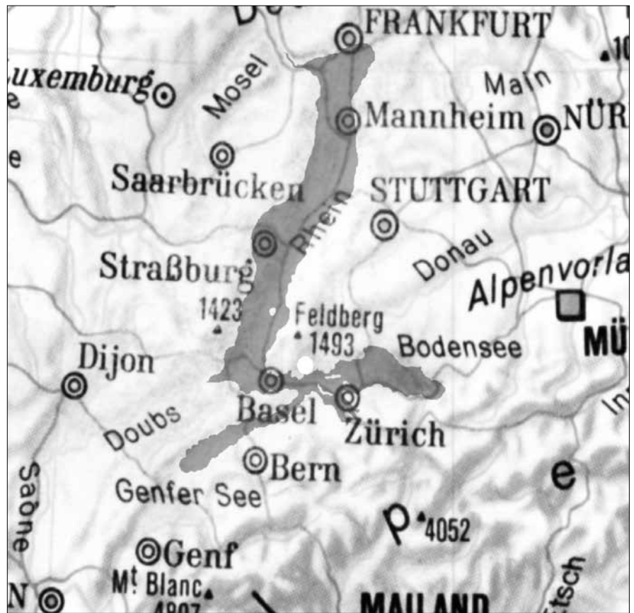
Abb. 1: Nach heutiger Topografie würde ein See im Rheintal etwa so aussehen, wenn das Binger Loch bis in eine Höhe von ca. 430 m ü. NN verstopft wäre.

Bei dem Heidenthurm, welcher auf dem Gipfel des Berges steht und so tief in den Grundboden hinabgeht, als er daraus hervorragt, befand sich vordem eine stattliche Burg. Darin hausten zur Zeit, als das untenliegende Rheinthal noch einen einzigen See bildete, Seeräuber, welche ihre Gefangenen in das feuchte Verließ des Thurmes an Stricken hinabzuversenken pflegten, um sie nie wieder das Licht des Tages erblicken zu lassen. Einst erbot sich ein Gefangener, das Thal vom Wasser zu befreien, wenn man ihm dafür die Freiheit schenkte. Nachdem dieser Vertrag eingegangen war, begab sich der Gefangene zu dem damals noch geschlossenen Binger Loche