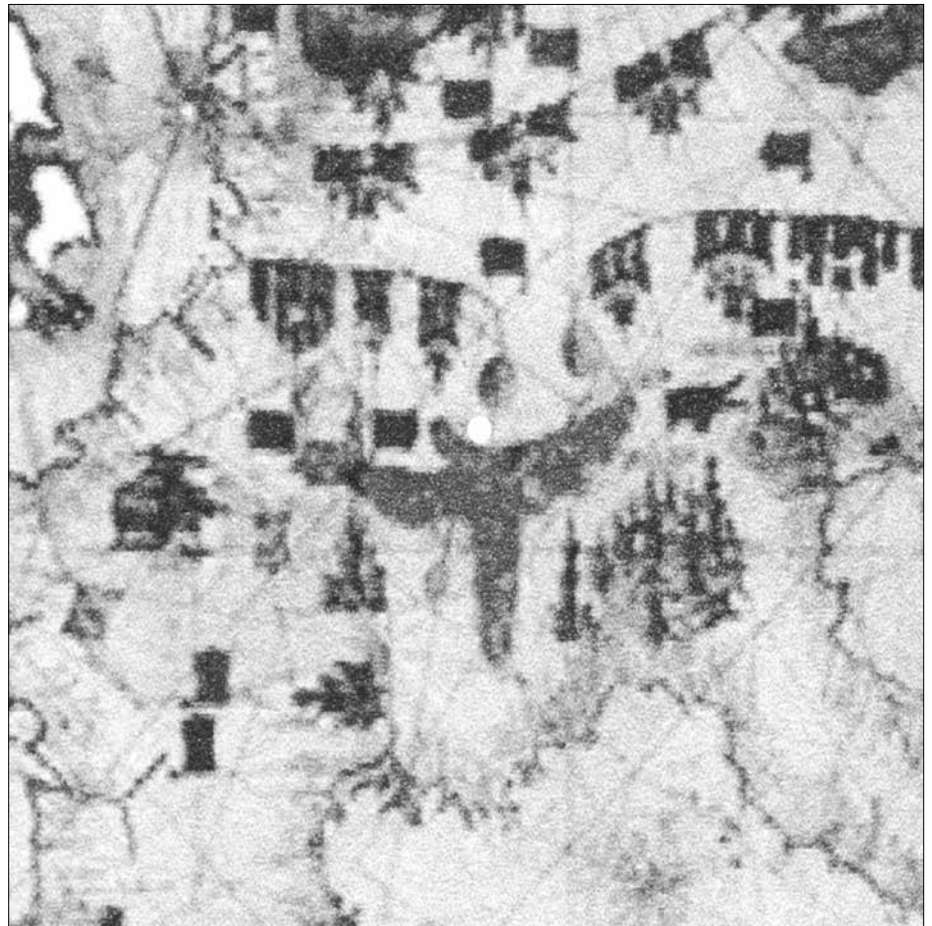
Abb. 4: Portolan von Ibn Ben Zara, 1487.

Gut erkennbar entspringen in all diesen Karten aus bzw. an diesem verwirrenden Gebilde, das also entweder irrtümlich die Alpen oder aber eher einen verdrehten See darstellt, jeweils vier Flüsse, wovon zwei nördlich davon zwei eher kleine Seen bilden, aus denen Donau und Rhein abfließen. Rhein und Elbe fließen ungewohnt parallel miteinander, in auffälligerweise eher west/südwestlicher Richtung, während Rhone und Donau – bis auf ihren Ursprung – etwa ihren heutigen Lauf zeigen. Auch ist in allen Karten Richtung W bzw. NW ein weiterer, in den Rhein mündender Abfluss zu erkennen (vielleicht floss er durch Teile des Moseltals?). Nach Süden hin besteht ein parallel zum südlichen Teil des Gebirges bzw. Sees (eigentlich das verdrehte Hochrheintal mit Bodensee) verlaufender Abfluss in den offensichtlich damals schon existierenden Genfer See und das Rhonetal. Die Übereinstimmung dieser vier Karten, deren Erstellung angeblich immerhin fast 150 Jahre auseinander liegt, ist in diesem Punkt schon bemerkenswert. Bei A. C., A. d. C. und A. D. erkennt man in einem Rheinknie einen weiteren kleineren See. Am merkwürdigerweise nach Westen hin fließenden und vergleichsweise kurzen Rhein entlang sind bei BenZara und Canepa drei große Städte eingetragen, bei Cresques sind es immerhin fünf. In allen drei Karten sind sie auffälligerweise entgegen aller