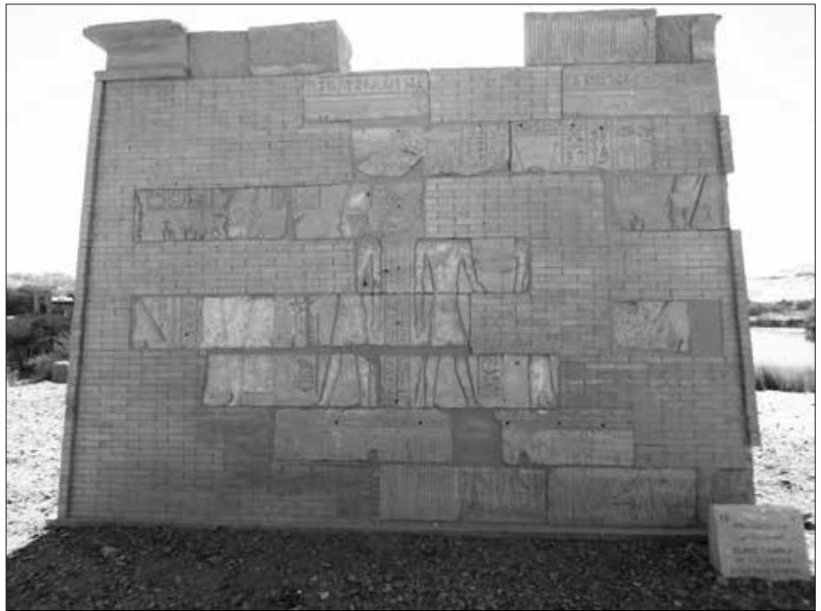
Ein Beispiel, wie von den deutschen Archäologen ein alter Tempel rekonstruiert wird, einzig aus ein paar Steinblöcken, die bereits in einem anderen Tempel verbaut waren. Rechts unten im Bild die Erklärungstafel, um welchen Tempel es geht und wer ihn erbaute.

Im Süden der Insel liegt das zum Teil bis zu zwölf Meter hoch anstehende Ruinenfeld der altägyptischen Stadt Abu. Die Stadt wurde ursprünglich auf zwei Granithügeln angelegt, die dazwischen liegende Senke hat man erst zum Ende des Alten Reiches aufgeschüttet. Die Besiedelung erfolgte bereits etwa -3500, am Ende dieser Zeit errichtete man bereits das erste Satet-Heiligtum. Am Ende der 1. Dynastie legte man nahe der Südspitze der Insel eine Festung an. Das bestehende Satet-Heiligtum wurde