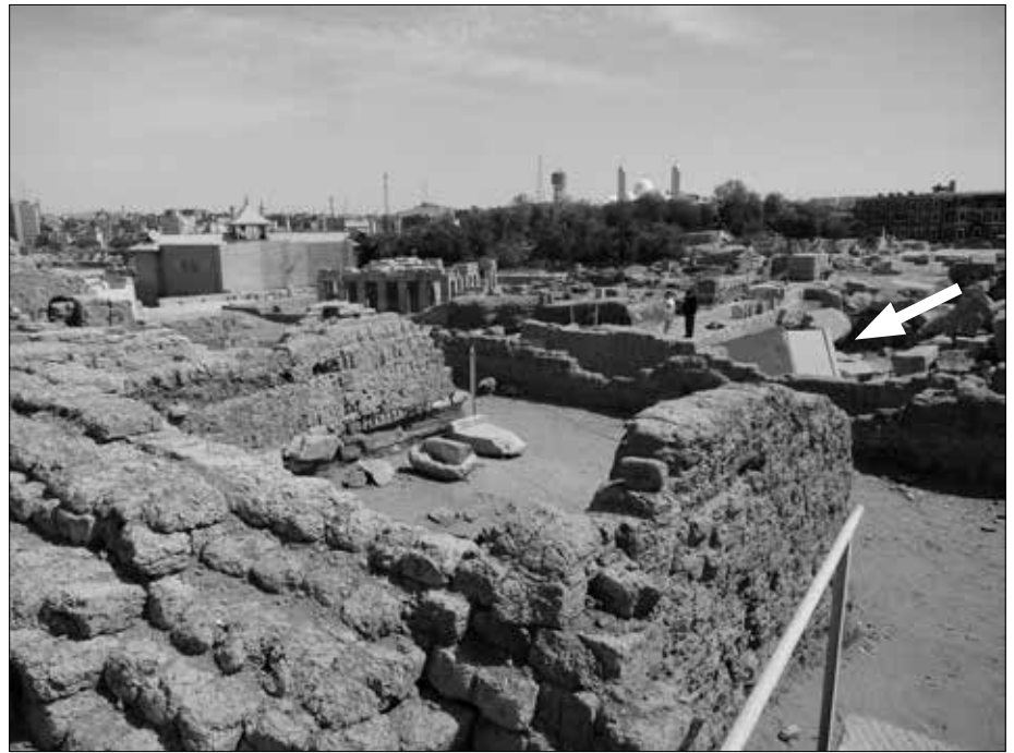
Mitten im Trümmerfeld liegt ein Objekt, das so gar nicht hinein passt (Pfeil).

Die meisten Zerstörungen der dortigen Heiligtümer geschahen allerdings ganz offensichtlich durch die Römer, obwohl man uns erzählt, die Römer seien tolerant gegenüber anderen Göttern