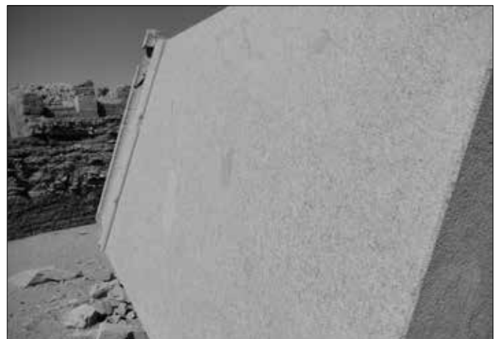
Links: Innenraum mit Kernbohrungen oben links und rechts. Rechts: Das makellose Seitenteil.