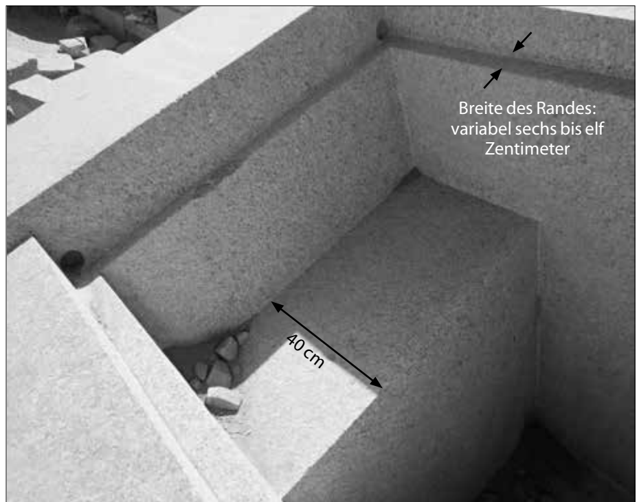
Blick in den Innenraum mit der Stufe, auf der eine Götterstatue gestanden haben soll. Oben links und rechts sind zwei der Kernbohrungen erkennbar. Sie haben jeweils einen Durchmesser von sechs Zentimetern und sind jeweils fünf Zentimeter tief in den Granit eingelassen. Auf diesem Bild nicht erkennbar: Knapp oberhalb der Stufe verläuft eine mit Rötelfarbe angebrachte Linie rund um den Innenraum.

Beim Durchschreiten durch das Trümmergebiet an der Südseite der Insel fiel uns ein Objekt auf, das so gar nicht zwischen die anderen Bruchstücke passt, weil es absolut plane Wände und so gut wie keine Zerstörungen aufweist. Es handelt sich um eine Art Schrein, der umgekippt auf dem Rücken im Sand liegt, gefertigt aus einem einzigen riesigen Rosengranitblock. Er stammt aus dem Granitsteinbruch auf der anderen