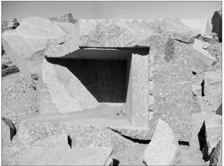
Das zweite Objekt, ebenfalls ein ehemaliger Götterschrein? Es besteht aus Basalt und liegt auf der Seite. Rechts sieht man, wie man mit Brachialgewalt versucht hat, es zu zerstören oder in Einzelteile zu zerlegen.

Dieses Objekt (eventuell ebenfalls ein ehemaliger Götterschrein?) weist eine weitere Besonderheit auf: Auf der rechten Seitenwand (die jetzt in gekipptem