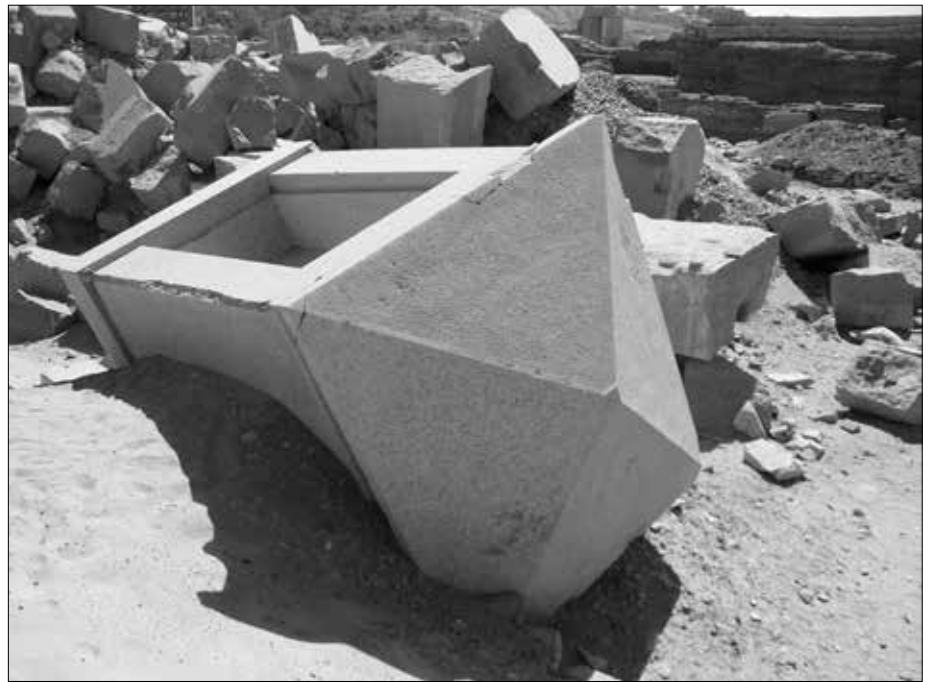
Ein ehemaliger Götterschrein? Aus einem einzigen riesigen Granitblock gefertigt. Das Dach ist etwas zur hinteren Seite (die jetzt im Sand liegt) verschoben angefertigt worden.

gewesen. Die Römer verhielten sich als Besatzungsmacht wohl ganz ähnlich wie die Amerikaner heute. Gerade im Süden der Insel, der eine einzige riesige archäologische Ausgrabungsstätte darstellt, haben die Römer fast alles mit ihren primitiven Nilschlammziegelbauten übersät. Die teilweise riesigen Granitblöcke, die zum Bau der Tempel verwendet wurden, haben die Römer versucht, mit Brachialgewalt in handliche Stücke zu zerlegen. Die traurigen Ergebnisse sieht man heute noch.