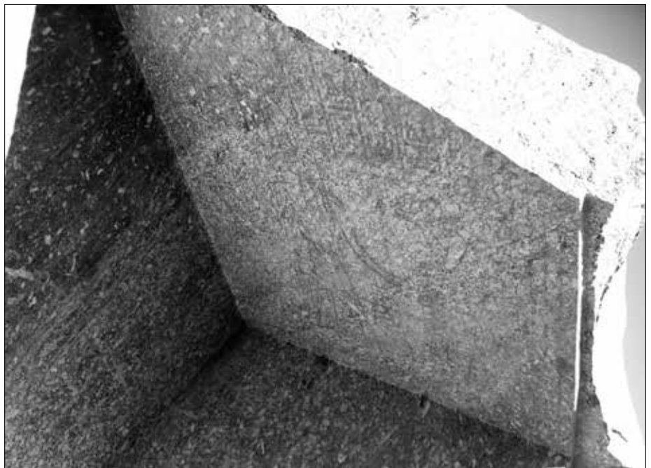
An der linken Innenseite, die jetzt in gekipptem Zustand die Decke ist, erkennt man mit Rötelfarbe ausgeführte Pharaonen- oder Götterdarstellungen sowie Reste von Hieroglyphentexten (kontrastverstärkt, sonst kaum erkennbar).

tem Zustand die Decke darstellt) hatte man mit Rötelfarbe Pharaonen- oder Götterfiguren sowie Hieroglyphentexte aufgemalt, die jedoch kaum noch erkennbar sind.