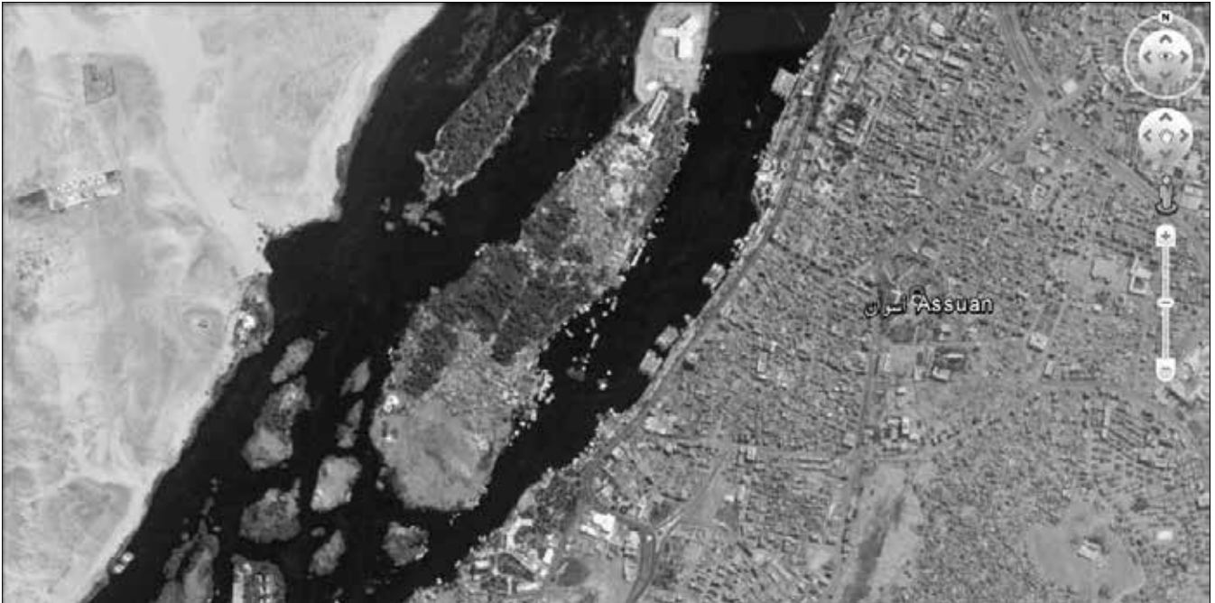
Die Nilinsel Elephantine.