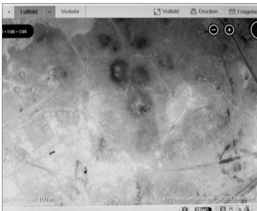
Abb. 1 und 2: Die Brennstellen-Lage zur Großen Ziggurat von Ur.