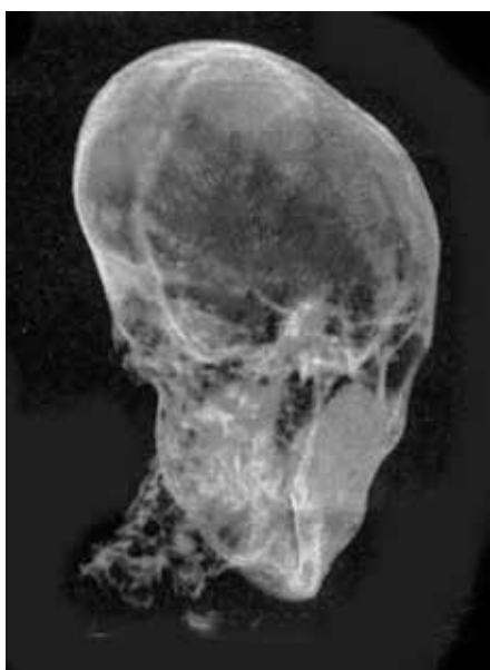
Abb. 6: Röntgenbild eines „langen“ Kinderschädels aus dem Umfeld des Tutanchamun. (Foto DDP IMAGES; AP/DPA Picture Alliance).

Eine meiner Aufnahmen zeigt zudem einen erst kürzlich angelegten Militärflugplatz in geringer Entfernung vom Fundplatz Ur (Ziggurat!). Die in meinen diversen Veröffentlichungen erläuterten Rückschlüsse auf das Alter der Bodenverfärbungen werden ermöglicht, weil die gegenüber ihren kulturellen Altertümern gegenwärtig „brandschatzenden“ Salafisten im Irak diese beweisträchtigen Indizien noch verschont haben, durch den schon seit geraumer