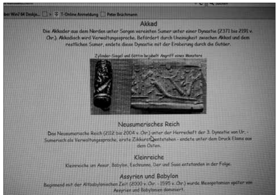
Abb. 9: Google-Bild des Urnamma-Steins direkt in der Mitte der offiziell bisher nicht als solche erkannten Raketten-Brennstelle.

schungen: Das in der Programmzeitschrift abgebildete Röntgenbild konnte nicht komplett aus der Zeitschrift kopiert/fotografiert werden, weil ein in den Rahmentext eingebauter optischer Code das verhindert. Die abgebildete Aufnahme gibt also lediglich ein „bearbeitetes“ Foto wieder.