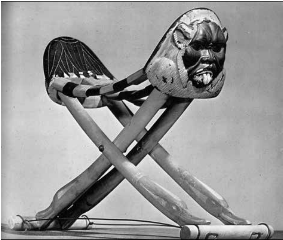
Abb. 5: Die zweite der in der Grabkammer Tutenchamuns gefundene Nackenstütze