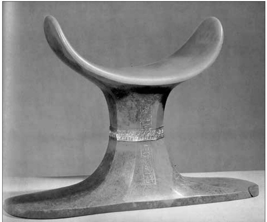
Abb. 4: Eine der Nackenstützen des Tutanchamun, die von den Archäologen fälschlicherweise als „Kopfstützen“ bewertet werden.

lehnt werden müssen, um die Gefahr einer Aufdeckung der wahren und entscheidenden Motive des Zweiten Weltkrieges zu verhindern. Persönliche Kommentare muss ich in diesem Rahmen nicht abgeben.