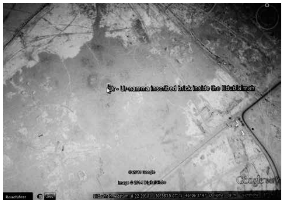
Abb. 7: Google-Hinweis auf die Fundstelle im „Eubla mah“, mit dem in Stein konservierten Hinweis auf Urnamma.