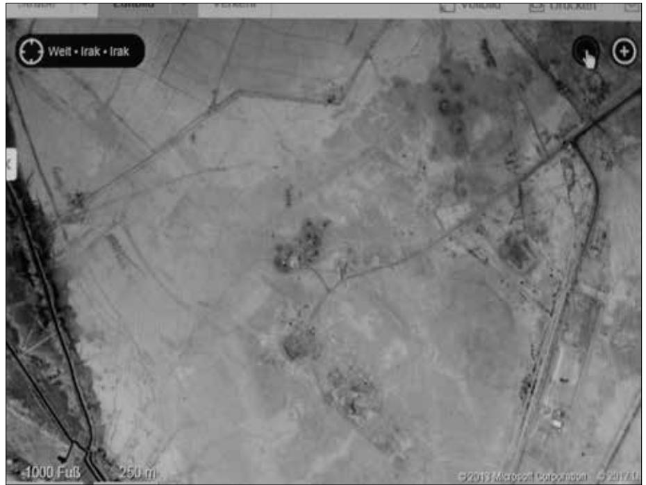
Abb. 3: Von der Großen Ziggurat (unterhalb der Bildmitte) konnte man in Richtung „Betriebsflugplatz“ blicken, der oben rechts im Bild gut zu identifizieren ist. Die Entfernung beträgt etwa 750 Meter und entspricht dem planvollen Sicherheitsabstand zur „Stadt“.

Man darf davon ausgehen, dass man den deutschen Reststaat möglichst lange in dem ihm international zugewiesenen Schuldstatus halten wird. Ich vermute, dass diese demnach bekannte Situation heute (2015) amtlich/behördlich verschwiegen wird, womit bedauerlicherweise auch meine wissenschaftlichen Arbeiten abge-