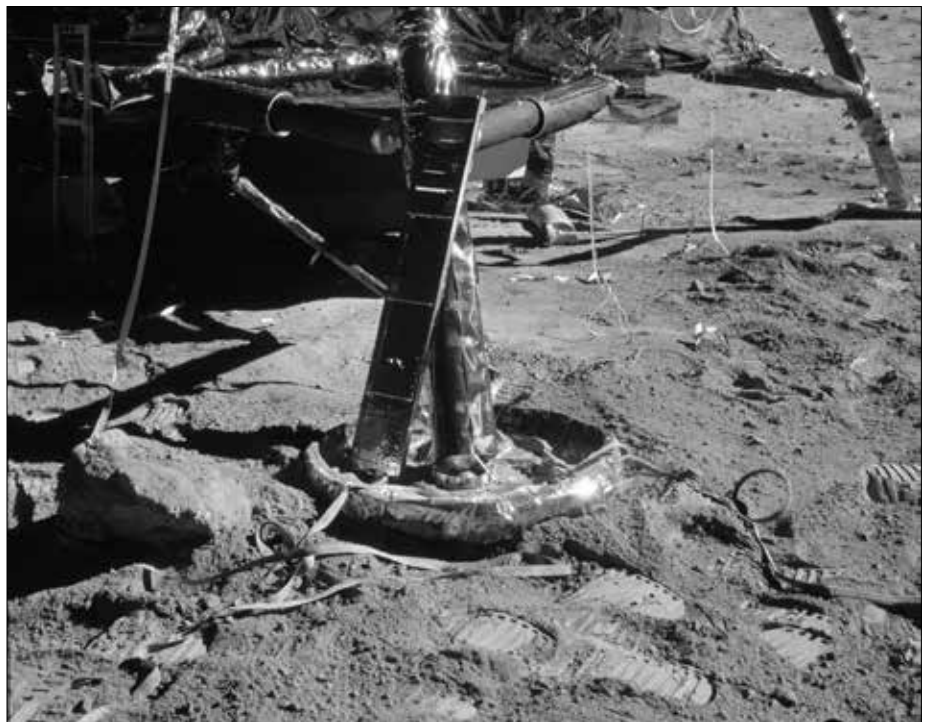
Apollo 16: Fußspuren im Staub rund um die Landefähre. Wenn doch erst nach der Landung das Triebwerk abgeschaltet wurde, wieso wurde der Staub nicht weggeblasen? (as16-107-17441).

Auch die berühmte Aussage „Contact light - - - Engine stop!“ wurde von verschiedenen Apollo-Missionen gezeigt (bzw. der Originalton eingespielt). Nur: