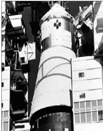
Die Apollo 1-Kapsel nach dem Brand an der Spitze der Saturn 5-Rakete (NASA-Bild-Nr. 10074798).

Die „Mondlandung“ fing ja nicht erst mit Apollo 11 statt. Nein, die wurden sozusagen aus den vorher stattgefundenen Gemini-Raumfahrzeugen (für jeweils zwei Astronauten vorgesehen, welche die Erde umkreisten) entwickelt, natürlich mit Ausnahme der Mondlandefähre (LEM bzw. LM), die vollkommen neu entwickelt werden musste.