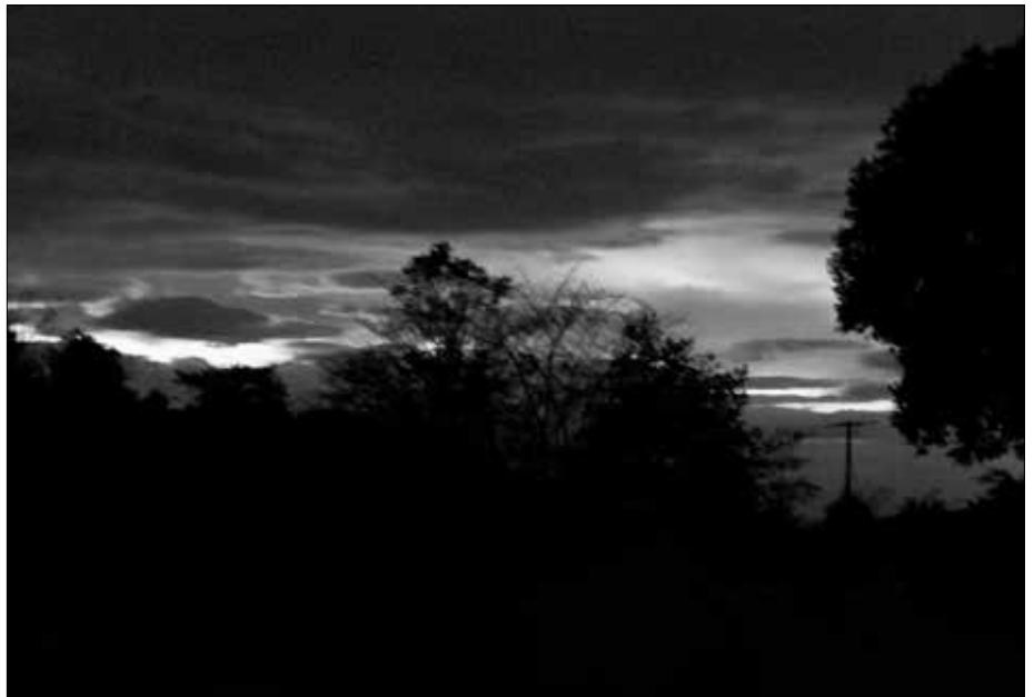
Bild 3: Hier waren Lichter im Westen. Das war allerdings die untergehende Sonne.