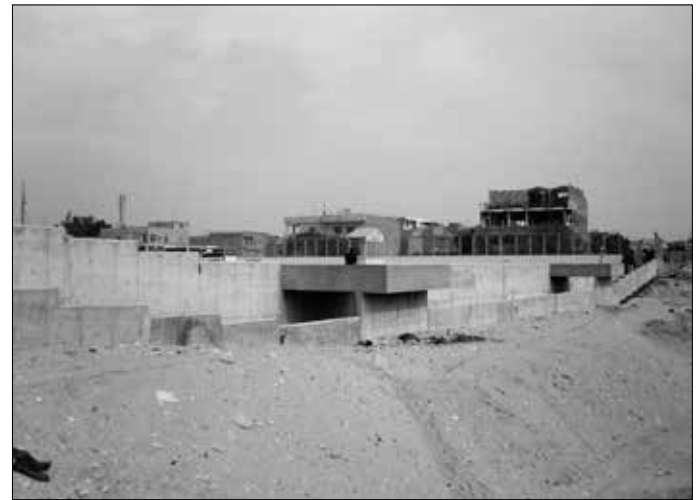
Hinter der Krähenmauer zunächst ein „Schutzzaun“, weiter hinten die betonierte Abspernung mitsamt Gizeh-Zaun und Wachpersonal.