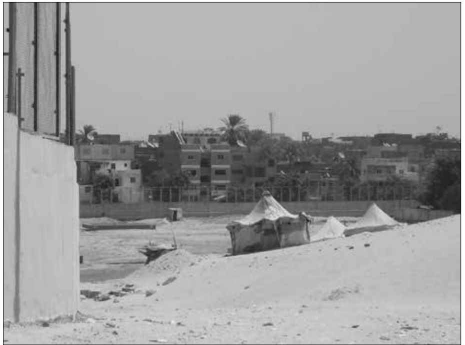
Wir nähern uns den Beduinenzelten und der Krähenmauer. Links und im Hintergrund wieder die Gizeh-Mauer.

oder ob man irgendwann „nur“ die Verkleidungssteine abgeräumt hat, ist ungewiss. Deshalb wird auch darum gestritten, ob es wirklich eine Pyramide war/werden sollte, oder ob es nur eine größere Mastaba war. Auf jeden Fall sieht man, dass die Erbauer raffinierterweise für dieses Bauwerk einen bereits vorhandenen Felshügel integriert hatten. Dieser umfasst etwa zwei Drittel des Bauwerks, wodurch natürlich eine Menge Baumaterial eingespart werden konnte. Den Hügel hat man pyramidenförmig bearbeitet, sodass man heute noch gut erkennen kann, wie die Außenverkleidungssteine aufgelegt wurden (oder wie es geplant war). Die Grabkammern befinden sich innerhalb des Hügel und sind nicht begehbar. Auf diesen Hügel hatte man dann noch einige Steinlagen aufgetürmt, wohl um die Form einer Pyramide zu erhalten.