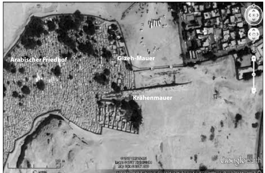
Der arabische Friedhof mit der Krähenmauer. Darüber ist die Gizehmauer zu erkennen (Google Earth, Beschriftung von mir).

zurückgeht. Letztendlich ist es nicht ganz ungefährlich, durch den Sand zwischen den Mastabas herumzulaufen, weil man immer wieder unversehens vor einem bis zu dreißig