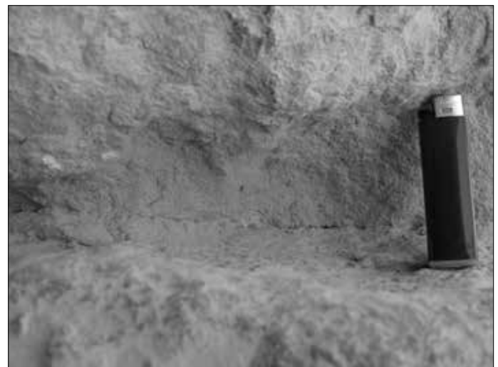
Das Krähentor. Rechts sieht man, wie überexakt die Steinblöcke geschnitten waren. Zum Größenvergleich mein Feuerzeug.

sollen nach seiner Ansicht die Arbeiter gelebt haben, die am Bau der Gizeh-Pyramiden beteiligt waren. Man darf das abgezaunte Grabungsgelände nicht betreten, da sofort irgendein Aufpasser auftaucht, der einen freundlich, aber bestimmt zurück weist.