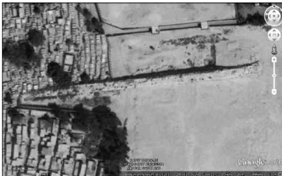
Die Krähenmauer.

In der Nähe des arabischen Friedhofs steht auch die Pyramide der Königin Chentkaus (4. Dynastie), die verschiedentlich auch als „vierte Gizeh-Pyramide“ bezeichnet wird, obwohl sie kleiner als die Mykerinos-Pyramide ist. Ob sie jemals fertiggestellt wurde