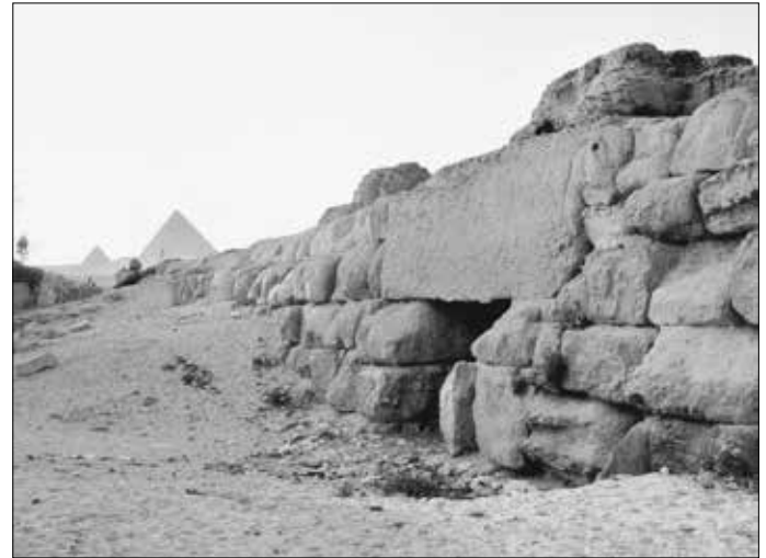
Das Krähentor. Rechtes Bild: Im Hintergrund die Gizeh-Pyramiden.