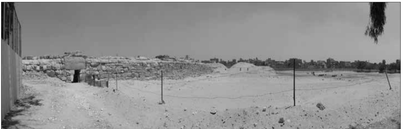
Und da ist sie, die Krähenmauer! Am linken Bildrand die Gizeh-Mauer um den arabischen Friedhof.

Geht man an der Gizeh-Mauer entlang, um den arabischen Friedhof herum, so erreicht man irgendwann – der Weg zieht sich! – die sogenannte Krähenmauer (Heit el-Ghorab). Aufgrund des beschwerlichen Weges durch den Sand verirren sich nur recht wenige Touristen hierher, ebenso wie zu der Chentkaus-Pyramide.