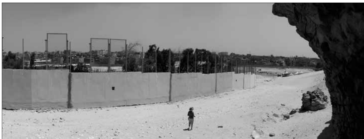
Der beschwerliche Weg durch Sand und Geröll entlang der Gizeh-Mauer um den arabischen Friedhof. Im Hintergrund rechts einige Beduinenzelte.