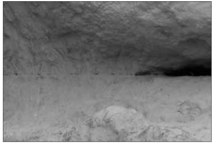
Weitere Beispiele für die exakte Steinbearbeitung. Selbstverständlich sind die Blöcke im Laufe der Jahrtausende oberflächlich verwittert.