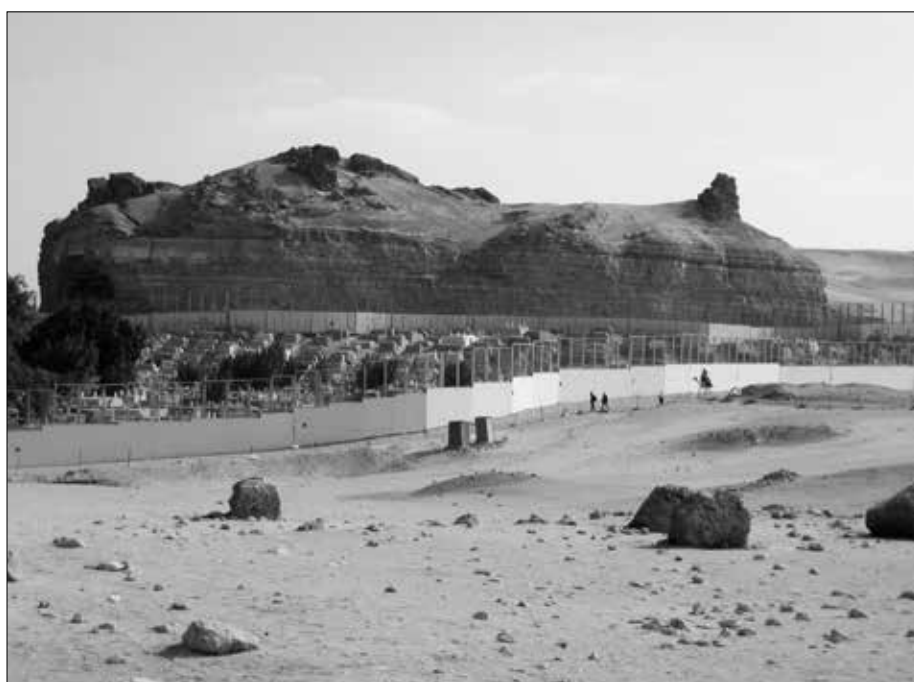
Der durch die Gizeh-Mauer eingezäunte arabische Friedhof.