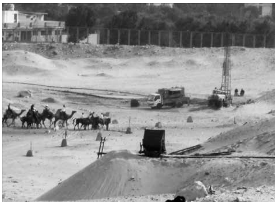
Die ersten Ausgrabungen.

treten kann, ohne einen Eintrittspreis bezahlt zu haben.