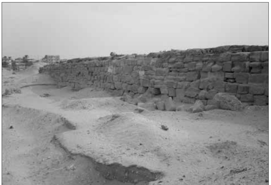
Die „Rückseite“ der Krähenmauer.