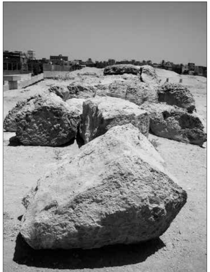
Auf der Mauer. Links: Die Mauer ragt in den arabischen Friedhof hinein. Zu ihrem Schutz wurde dazwischen die Gizeh-Mauer errichtet. Rechts: Blick in die andere Richtung. Die oberen Steinblöcke haben im Laufe der Jahrtausende arg gelitten.