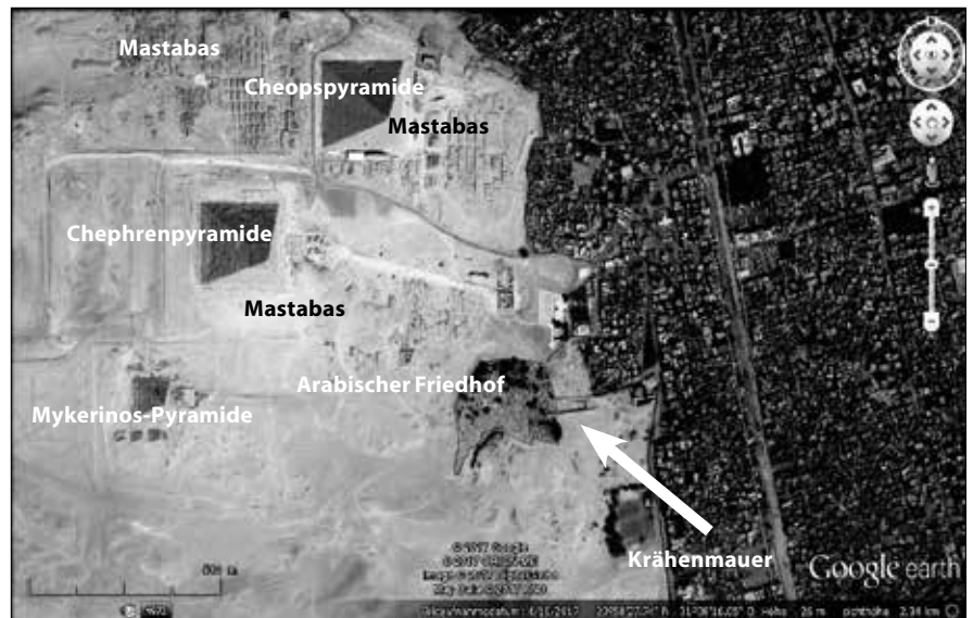
Das Gizeh-Plateau von oben. Ziemlich in der Bildmitte der Sphinx mit seinen beiden Tempeln. Der entfernt hufeisenförmige Fleck darunter ist der arabische Friedhof, rechts davon (Pfeil) ragt die Krähenmauer aus ihm heraus (Google Earth, Beschriftung von mir).

Begibt man sich also etwa in Richtung der Mastabafelder, so muss man damit rechnen, von einem der Aufpasser angesprochen zu werden, der zunächst erwartet, dass man wieder