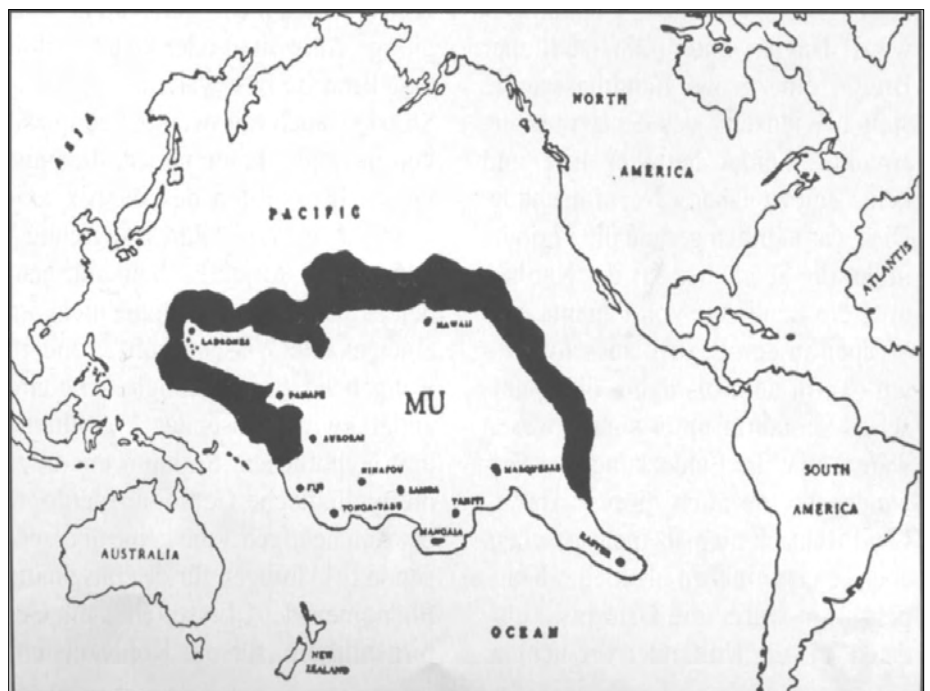
Bild 3: Die geografische Lage von Mu (Zeichnung von James Churchward)

Für ein derartiges Forschungsprojekt wäre der „Kontinent Hiva“ ein guter Ausgangspunkt. Teil einer solchen Untersuchung müsste selbstredend ein