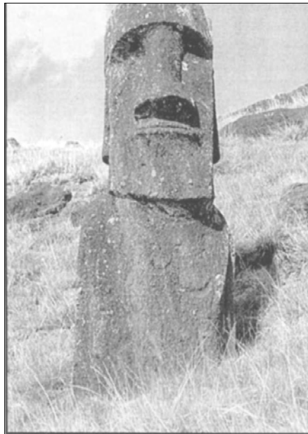
Bild 2: Die heutige isolierte Lage der Osterinsel einerseits und die auf ihr zu findenden archäologischen Besonderheiten andererseits lassen vermuten, dass dereinst Verbindungen zu einer größeren, nördlich gelegenen Landmasse bestanden und die Osterinsel eine Art Vorposten war. Wurden die Arbeiten an den Statuen beendet, als das Land nördlich der Osterinsel unterging?

So kann uns etwa die lyellistische Geologie-Ideologie bis zum heutigen Tage keine überzeugende Erklärungen für das rätselhafte Phänomen der „Eiszeiten“, für Gebirgsbildung, für die Kohleentstehung, über die genauen Umstände von Fossilisierung, für Erdbeben oder dafür liefern, wie es kam,