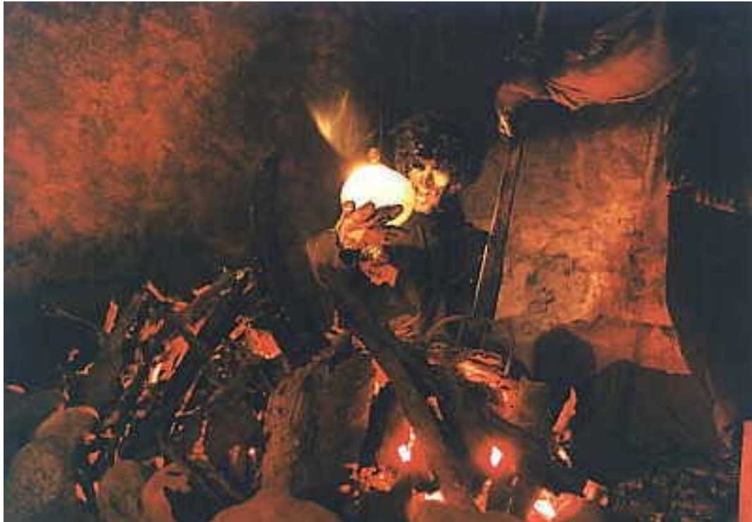
Ein Blick in den Scheinwerferstrahl der Signalkugel.