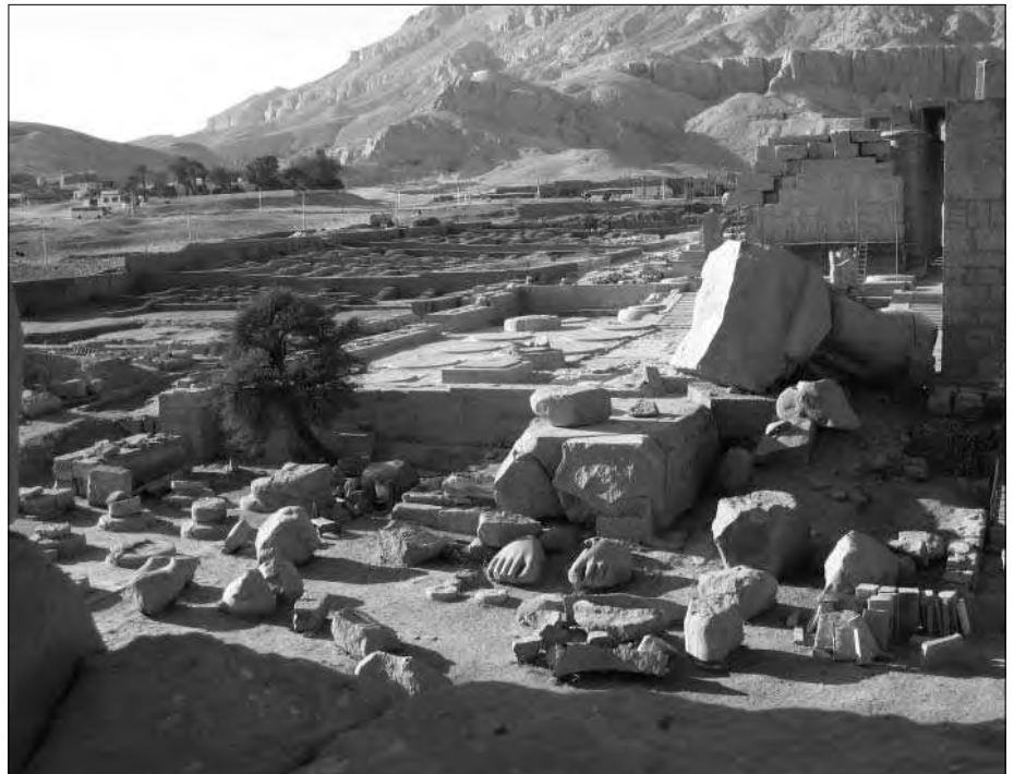
Das Ramesseum auf der Westbank von Luxor: eine einzige große Trümmerstätte, die mühsam rekonstruiert wird. Im Vordergrund die zerbrochene Riesenstatue von Ramses II. aus poliertem Rosengranit.

Die Gizeh-Pyramiden standen bereits dort, wo sie heute noch stehen, und mit großer Wahrscheinlichkeit auch die um sie gruppierten „Tempelanlagen“ und Mastabas, da sie größtenteils ebenfalls aus megalithischen Steinblöcken in ähnlicher Bauweise erbaut sind. In