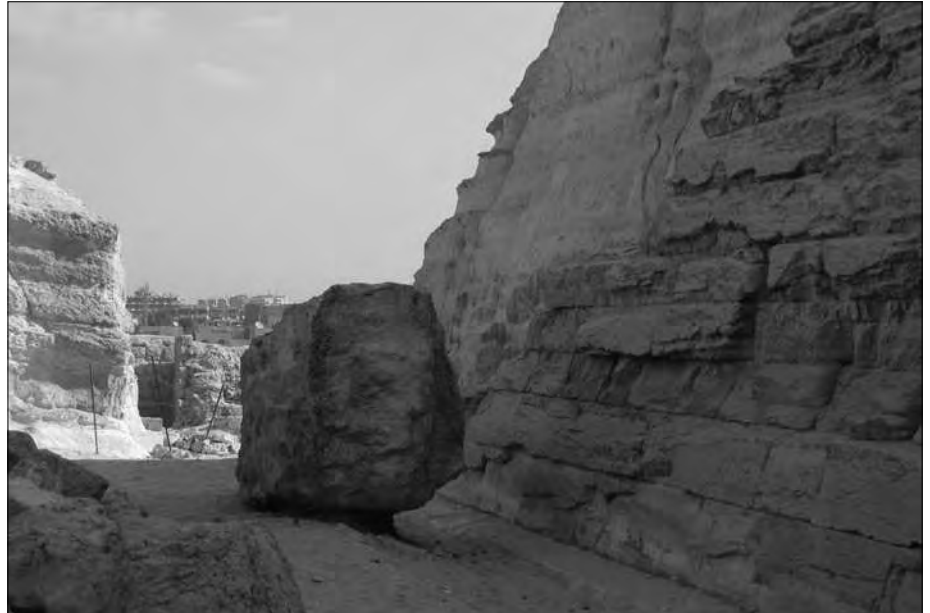
Die Nordseite der Chentkaues-Pyramide (rechts) mit dem rund zehn Meter breiten Durchgang. In der Bildmitte ein herab gestürzter Felsblock.

Nicht nur der heran wehende Sand ist ständig dabei, die Mastabas unter sich zu begraben. Der allgegenwärtige Müll scheint die größere Gefahr darzustellen, unter dem so mancher Schacht und Grabeingang zu verschwinden droht. Was könnte man hier eine Goldgrube auf tun, wenn man diesen Müll, der überwiegend aus Plastikflaschen und Plastiktüten besteht, recyceln würde! Sicher würde die Errichtung einer Recycling-Anlage zunächst eine große Investition darstellen, aber einmal installiert, würde sie nur noch mit Gewinn arbeiten. Das sehen wir ja auch bei uns in Deutschland. Der positive Nebeneffekt wäre, dass die ägyptischen Altertümer entmüllt werden würden. Und allein das wäre die Sache wert!