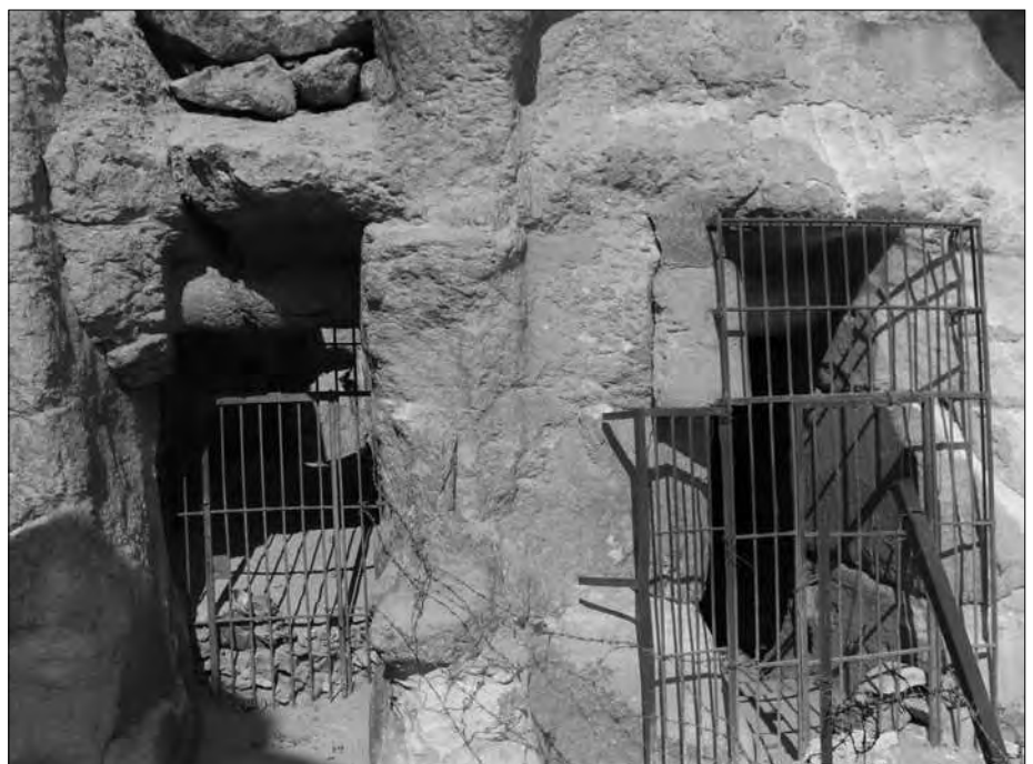
Zwei durch Gittertüren gesicherte Felsengräber auf dem Gizeh-Plateau.