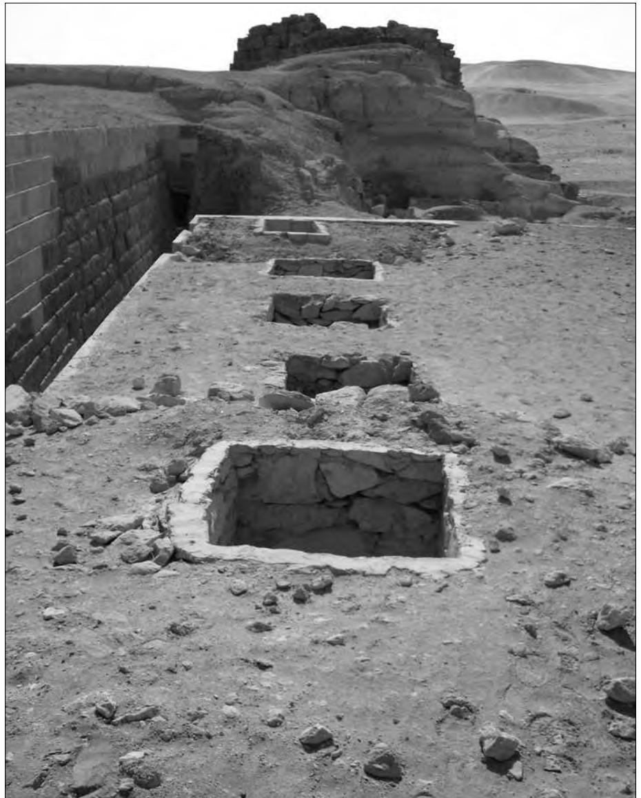
Schachtreihe auf dem Dach einer Mastaba. Vom Boden bis zum Dach sind die Schachtwände aufgemauert. Darunter sind die Schächte weitere zig Meter tief in den Felsboden getrieben.

Man stellt sich unwillkürlich vor, welche Strapazen es gewesen sein müssen, allein die senkrechten Schächte in den Felsboden zu treiben, denn so eng diese Schächte sind, kann nur ein einziger Arbeiter darin gestanden haben. Das dortige Gestein ist Sandstein, was sich zwar relativ leicht bearbeiten lässt (im Gegensatz zu den Schächten im