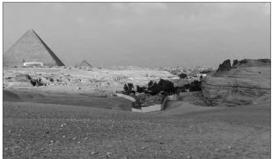
Das Gelände südöstlich der Cheopspyramide (linke Bildseite). In der Bildmitte erkennt man den alten arabischen Friedhof mit der ihn umgebenden Gizeh-Mauer, die hier inzwischen weiß angestrichen wurde. Zwischen der Cheopspyramide und dem Friedhof liegt ein ausladendes Mastaba-Feld. In der Ebene davor werden wohl irgendwann Ausgrabungen stattfinden.

Aber es befinden sich auf dem Gizeh-Plateau ja nicht nur einer, sondern hunderte solcher Schächte. Gut, die meisten haben nur eine Tiefe bis zu rund zwei Metern. Das ist wohl