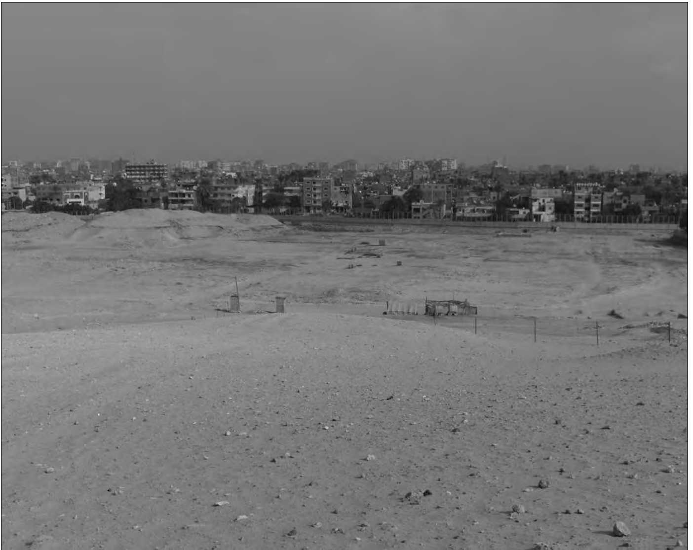
Auf dem Gelände im Hintergrund werden archäologische Ausgrabungen gemacht, Stücke in der Erde überziehen rasterartig das Gebiet. Die „Krähenmauer“ befindet sich links außerhalb des Bildes. Im Hintergrund Kairo mit der Gizeh-Mauer. Am rechten Bildrand eine primitive Hütte dort lebender Nomaden, die sich ihr Bleiberecht wohl damit erkaufte haben, dass sie Touristen daran hindern, das Ausgrabungsgelände zu betreten.

Vom Ägyptischen Museum in Kairo, das man bequem einen Tag besichtigen kann, ohne alles gesehen zu haben, ist bekannt, dass nur rund zwei Prozent aller Exponate ausgestellt sind. Die restlichen 98 Prozent liegen mehr oder weniger schlecht gelagert in den Kellern des Museums und verfallen dort. Das war übrigens auch einer der Gründe für den Entschluss, bei den Pyramiden das neue Museum zu bauen.