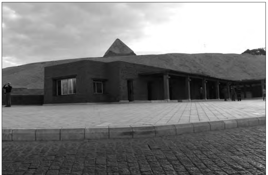
In diesem Gebäude erhält man jetzt die Eintrittskarten und muss vor dem Betreten des Gizeh-Plateaus eine Sicherheitsschleuse durchlaufen.

Das geplante neue Ägyptische Museum, das westlich der Cheopspyramide entsteht, soll bis etwa 2011 angeblich fertig sein. Fertig sind bisher erst die Parkplätze und eventuell einige Grundmauern, was man jedoch vom Plateau-Zugang nicht erkennen kann. Da dieses Museum das „größte