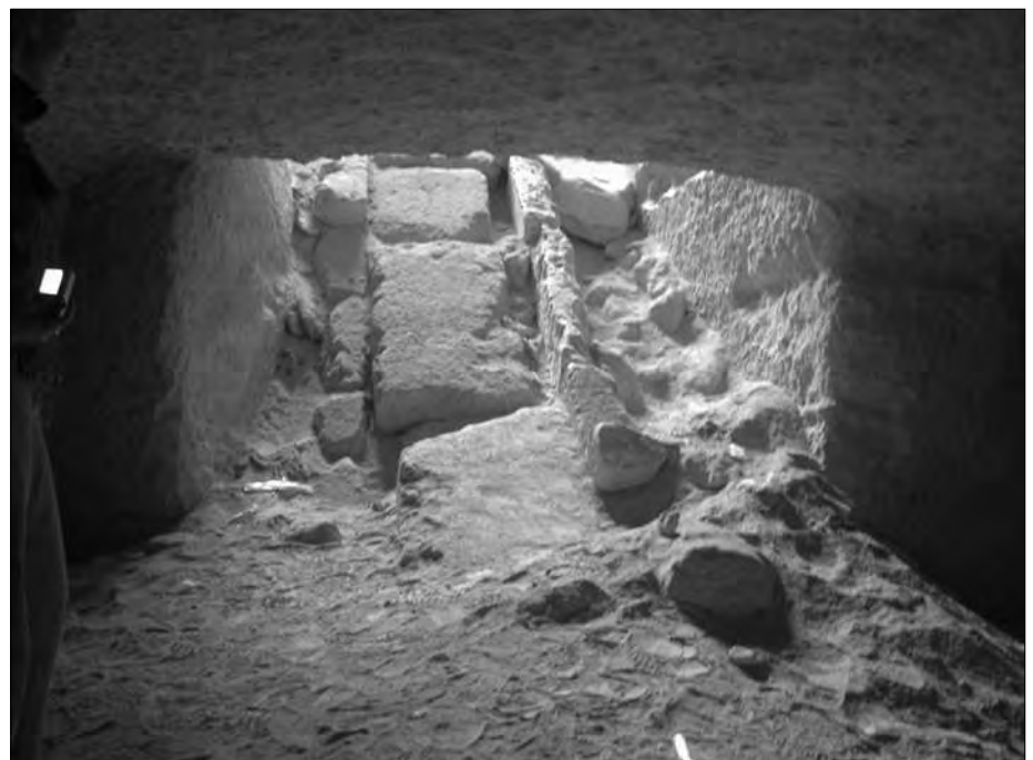
Blick zurück zum Zugang