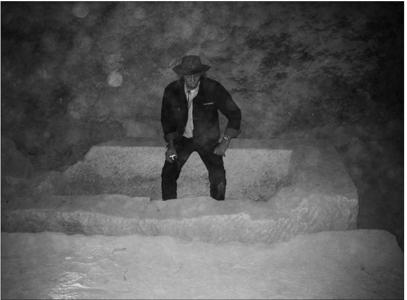
Oben: Der Sarkophag ist an zwei Seiten beschädigt. Der Deckel (unten) liegt hinter dem Zugang und ist fast ganz durch Geröll und Sand verschüttet.

Decke führt direkt in die relativ grob bearbeitete Grabkammer, in der ein Sarkophag steht, der ebenfalls relativ grob hergestellt wurde. Man kann deutlich die Bearbeitungsspuren sehen. Der Sarkophag ist an zwei Seiten beschädigt, wohl von den Grabräubern, die den Deckel hinweg wuchteten, der nun im vorderen Bereich der Grabkammer liegt und vor Schutt und Müll kaum noch zu erkennen ist.