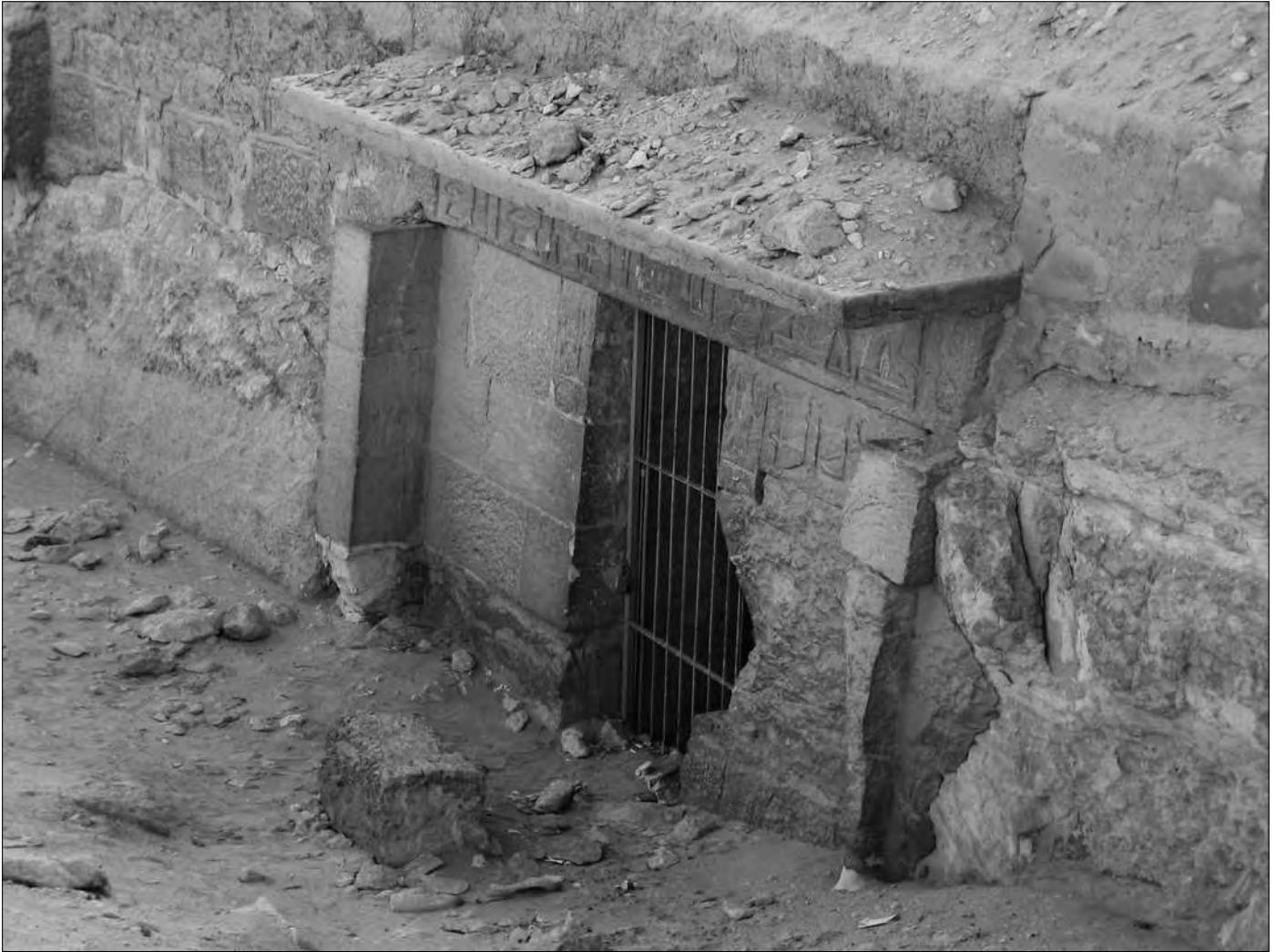
Mastaba mit Hieroglyphen-Inschrift auf dem Türsturz und neben dem Eingang.

Granit des Assuan-Steinbruchs). Aber stellen Sie sich vor, dass der Schacht schon einige Meter tief ist und darin ein Arbeiter werkelt. Alle paar Minuten musste der Abraum aus dem Schacht befördert werden, was wohl mit Behältnissen und Seilen geschah. Aber in dieser Enge, in der ein Bücken kaum möglich ist?