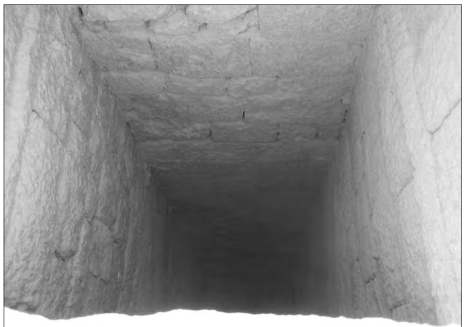
Einer der Schächte. Im oberen Bereich wurde er noch aufgemauert.

Im Bereich des arabischen Friedhofs (östlich der Mykerinos-Pyramide) und der „Krähen-Mauer“ sind größere Gebiete mit Vermessungspflöcken abgesteckt worden, die archäologisch untersucht oder freigelegt werden sollen. Ein Einheimischer sagte, Dr. Mark Lehner (der zweitwichtigste Ägyptologe nach Zahi Hawass) würde hier ausgraben.