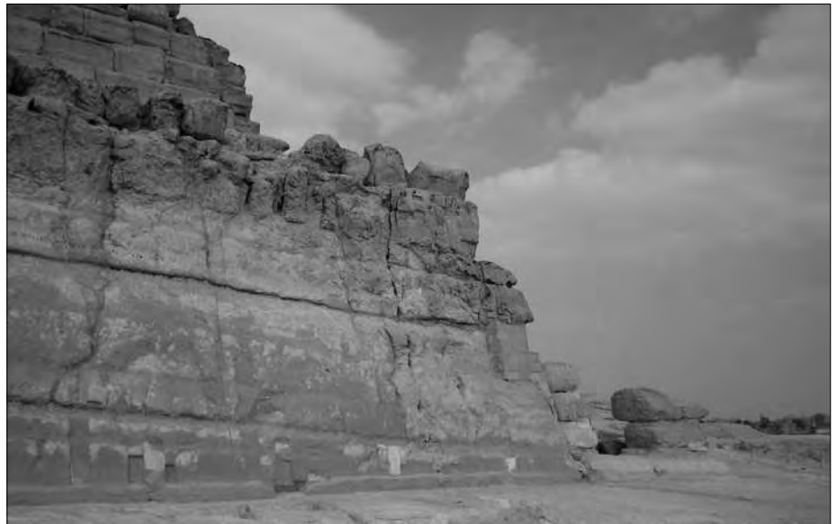
Die Südseite der Chentkaues-Pyramide