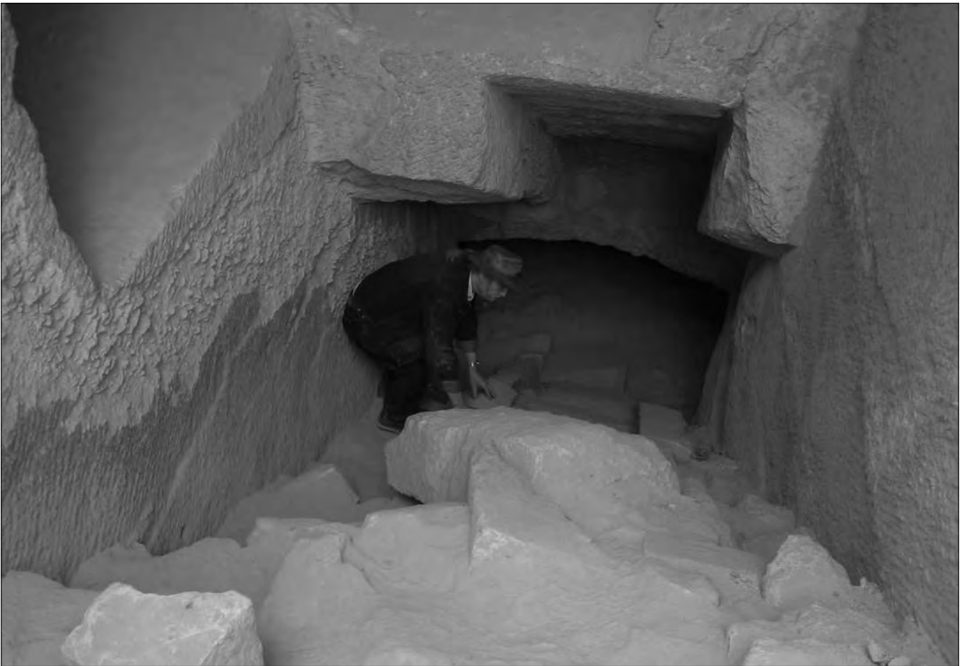
Abstieg in ein weiteres Felsengrab.

Laie nicht entscheiden. Jedenfalls sind die Sarkophagwände und der Deckel sauber bearbeitet und geglättet. Es wäre vorstellbar, dass der Sarkophag vor Ort in der Kammer hergestellt wurde, indem man den inneren Kern der Kammer entsprechend bearbeitete. Das muss jedoch eine ungeheuer schwierige Arbeit gewesen sein, aufgrund des fehlenden Platzes und der mangelhaften Be- und Entlüftung. Weiterhin hatte man ja schließlich keinerlei Garantie dafür, nachdem man einen schmalen Gang um den inneren Block gehauen hatte, ob sich dieser Block überhaupt für die Herstellung eines Sarkophages eignete. Es hätte ja sein können, dass das Gestein hier Risse zeigte, dann wäre die ganze Arbeit (Gänge, Schächte, Kammern) umsonst gewesen.