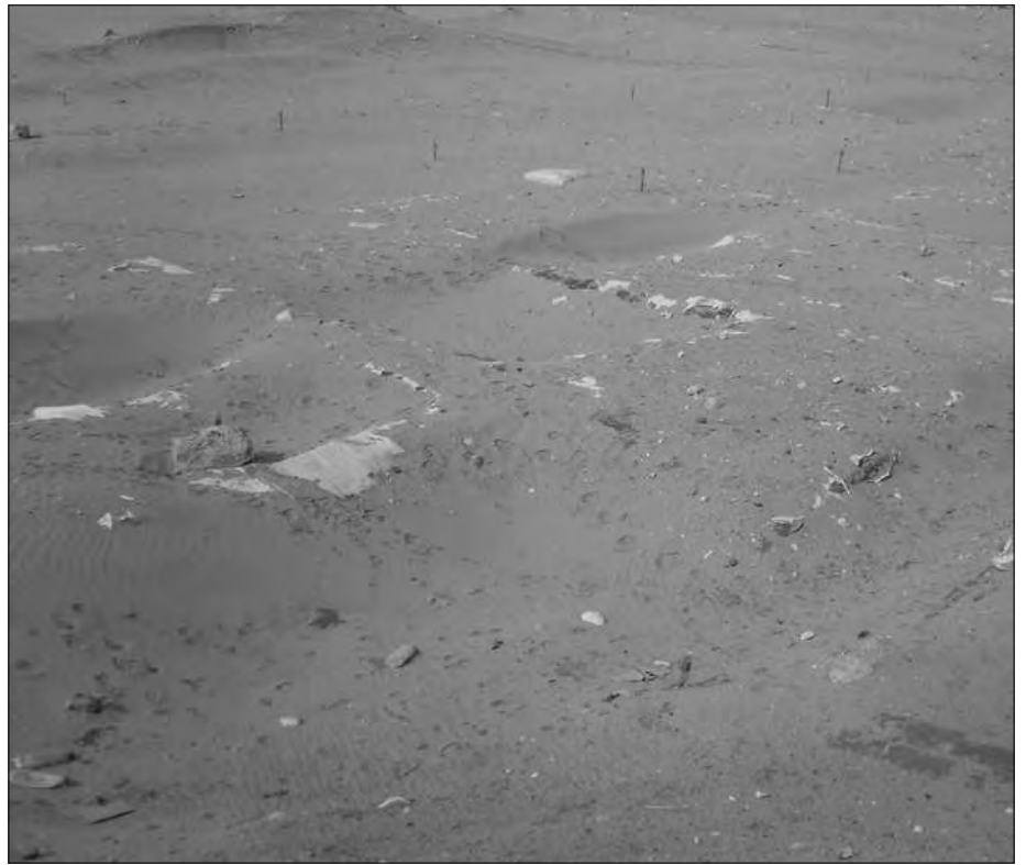
Die Ebene zwischen den Mastabas und dem arabischen Friedhof. Hier sind bereits Vermessungspflöcke in den Sandboden gesteckt.

Anders die Mastabas, die oberirdisch errichtet wurden. Sie scheinen aus späteren Zeiten als die Schachtanlagen zu stammen, obwohl sich auch in ihnen Schächte befinden, allerdings