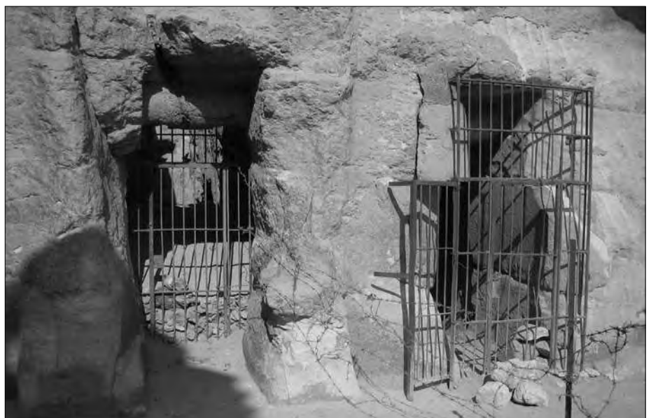
Zugänge zu Felsengräbern gegenüber der Nordseite der Chentkaues-Pyramide.