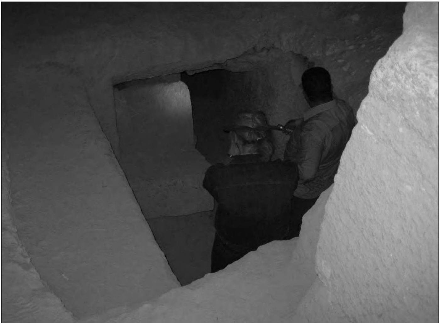
Über einen Schacht geht es in die Tiefe, zum engen Durchgang, der zur Grabkammer führt.