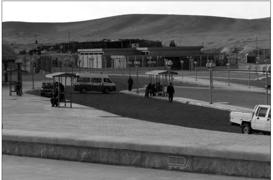
Der Parkplatz vor dem Zugang zum Gizeh-Plateau. Im Hintergrund die ersten Rohbauteile des geplanten neuen Ägyptischen Museums.

Man nimmt es gelassen und fragt sich andererseits, wie es die vielen Bettler, Souvenirverkäufer, Kamel- und Pferdetreiber schaffen, in den inneren Bereich der Gizeh-Mauer zu gelangen, denn es ist unwahrscheinlich, dass auch sie ihre immerhin 60 Pfund (ca. 7,50 Euro) Eintritt pro Person und Tag bezahlt haben.