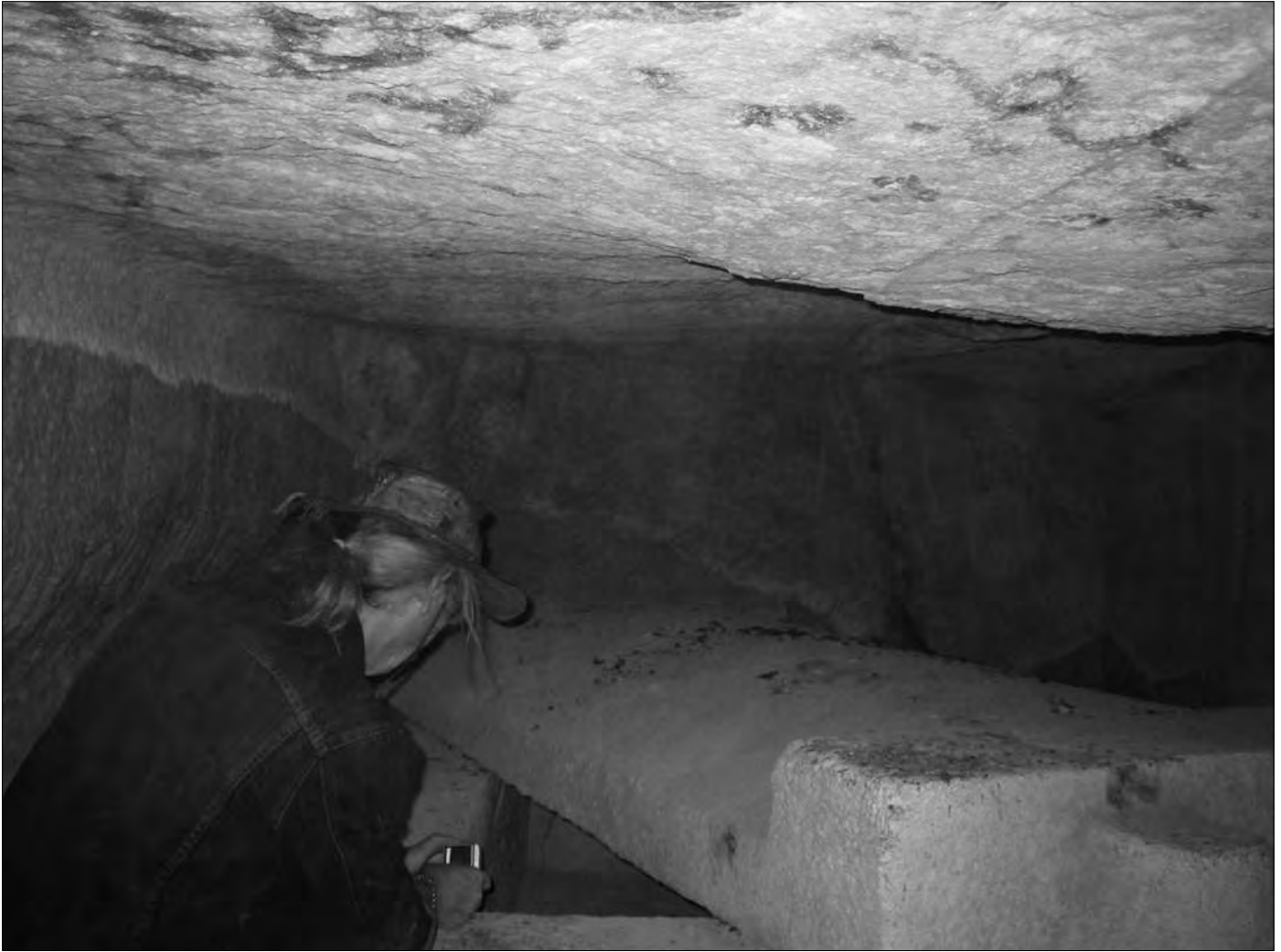
Der Sarkophag mit dem verschobenen Deckel ist zu groß, dass man ihn durch den engen Zugang in die Kammer geschafft haben könnte.