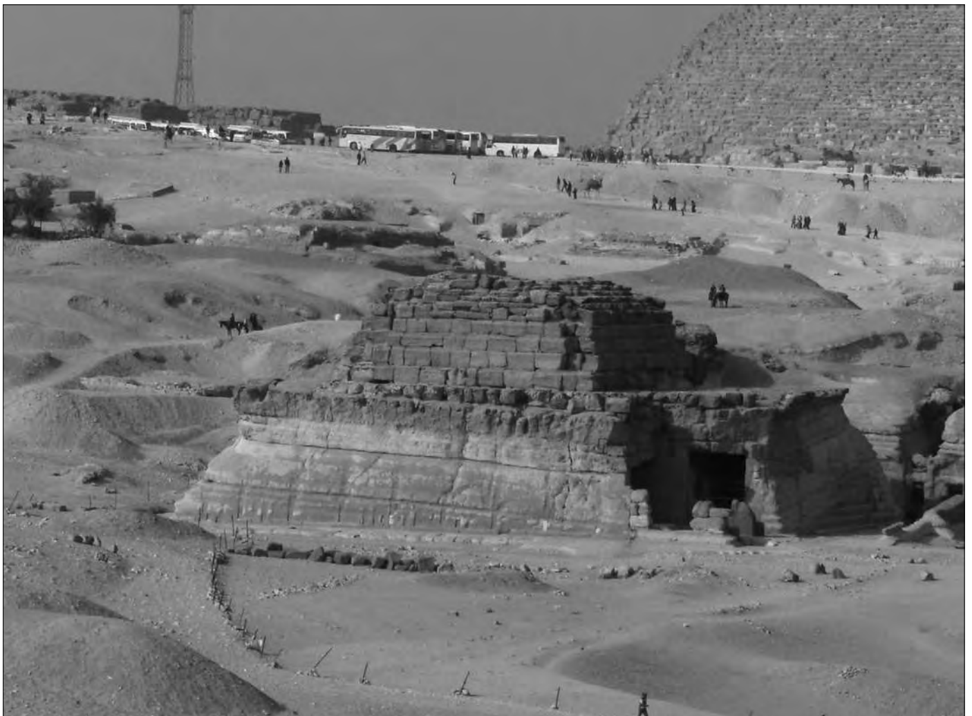
Die Pyramide der Chentkaues (Chentkaus I.), gesehen von Osten. Im Hintergrund die Chephren-Pyramide, deren Entfernung ziemlich nahe wirkt, was jedoch täuscht, weil die Pyramide herangezoomt wurde.