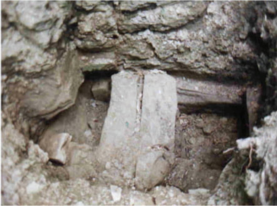
Abb. 3: Deckstein