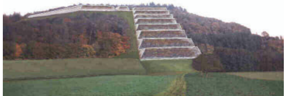
Abb. 2: Rekonstruktion

Normierung, Standardmaße - wir kennen den ägyptischen Fuß, der als Grundeinheit die Längen und Höhen, alle Bauwerksproportionen bestimmte, und - will's der Zufall - findet doch unser Vereinsvorstand Bernd Zilly auf dem ursprünglichen Verschlussstein die Gravur eines Fußes von 28 cm Länge (Bild 5)! Das ist die Maßeinheit, die praktisch in allen Hochkulturen aller Kontinente vorkommt und von der frühesten Pharaonenzeit bis tief ins Mittelalter hinein angewendet wurde.