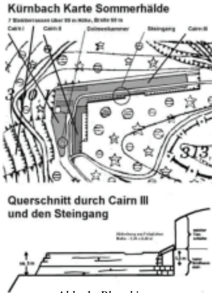
Abb. 1: Planskizze