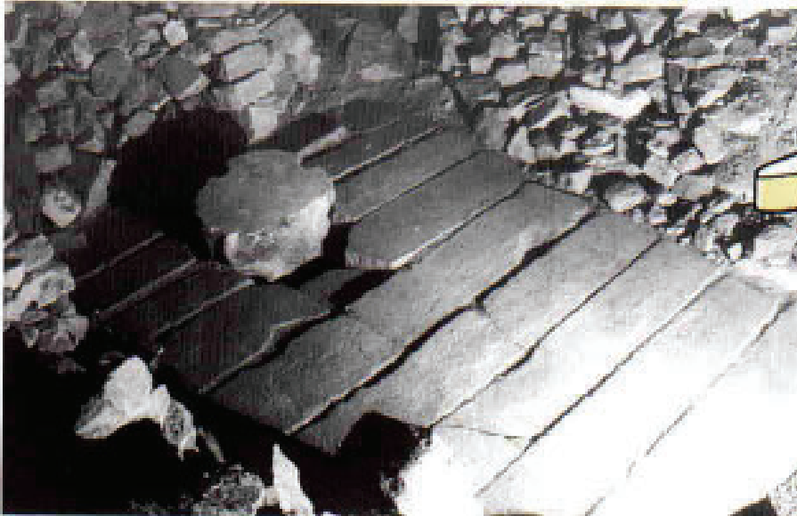
Abb. 4: Grabgewölbe der Stufenpyramide des Djoser