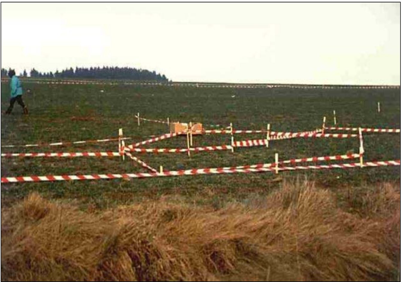
Die austrassierte Schanze bei Petershausen/Obermarbach

Wir kamen zu dem vorläufigen Befund, dass es sich hier um eine Keltenschanze gehandelt hatte, die anscheinend zu einem späteren Zeitpunkt mit einem römerekastellähnlichen Burgkomplex überbaut worden war. Auch von den Grundmauern dieses Komplexes ist oberirdisch nichts mehr erkennbar.