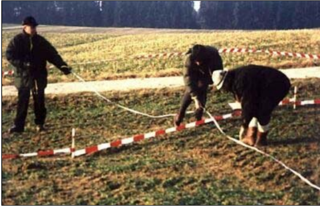
Beim Austrassieren der Schanze

22./23. Mai, eine weitere Begehung dieser Gelände bei Petershausen ins Auge gefasst. Bis dahin wird auch (hoffentlich) das Wetter besser sein.