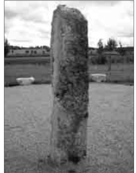
Die Steinsäule (Menhir) in der Mitte des Steinkreises.