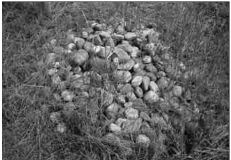
Oben: Der Steinhaufen mit dem „Mini-Stonehenge“ (im oberen Bereich des Bildes).