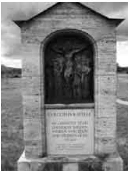
Der am Zugangsweg stehende Grabstein.