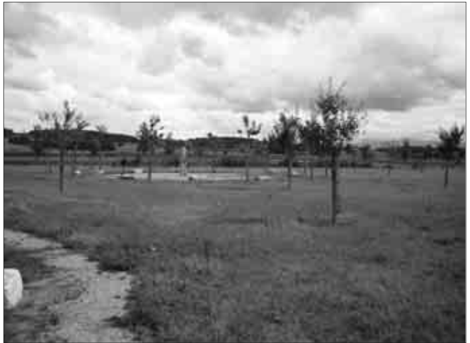
Der Steinkreis von Weilheim i. OB. Im Vordergrund links der „Schaltstein“.

Neun quer liegende Steinquader von etwa 70 x 50 cm Länge und etwa 30 bis 40 Zentimetern Höhe liegen kreisförmig um eine vom Rand aus sechs Meter entfernt mittig aufrecht