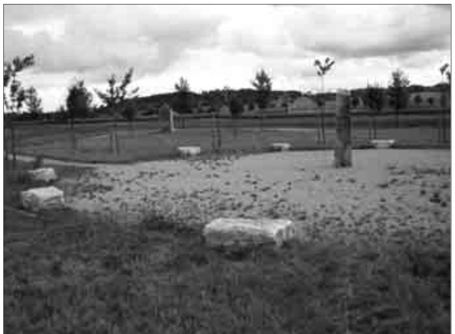
Der Steinkreis von Weilheim i. OB.