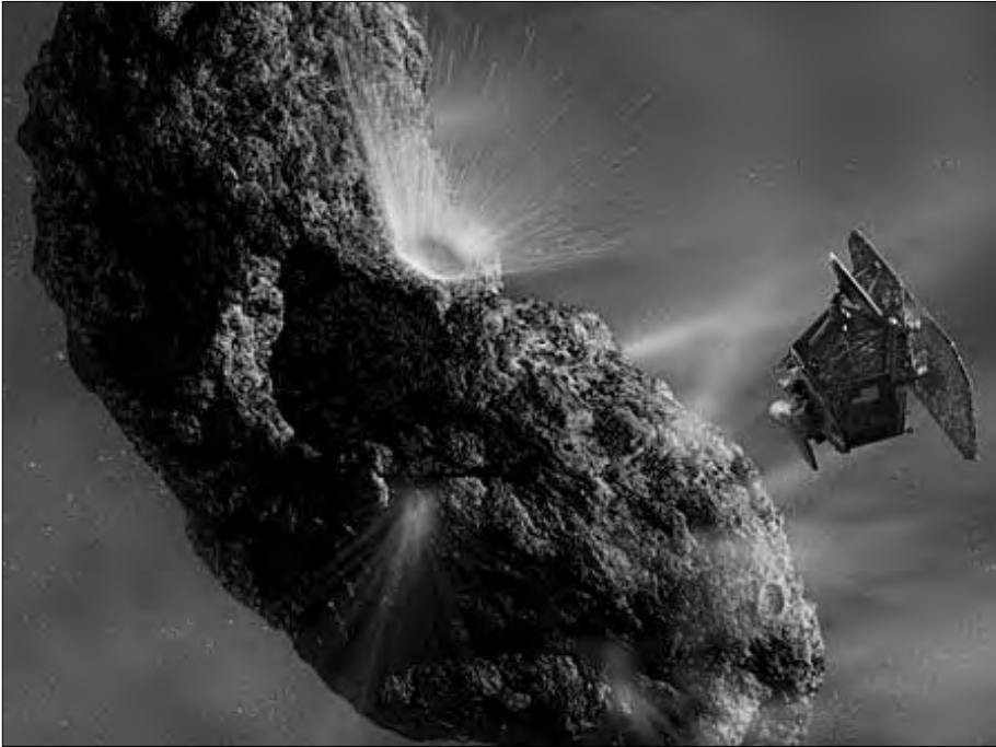
Die NASA-Sonde „Deep Impact“ bombardierte den Asteroiden „Temple I“ mit einem sogenannten Impaktor. Der Asteroid blieb heil und setzte seine Flugbahn ungestört fort (NASA).

inzwischen wissenschaftlich nachgewiesen wurde, dass ein Teil des amerikanischen Grand Canyon laut archäologischen Untersuchungen vor rund 1300 Jahren innerhalb kurzer Zeit entstand. Dies kann nur durch gewaltigen Wassereinsatz passiert sein, über dessen Herkunft sich die Archäologen allerdings noch nicht so recht im Klaren sind.