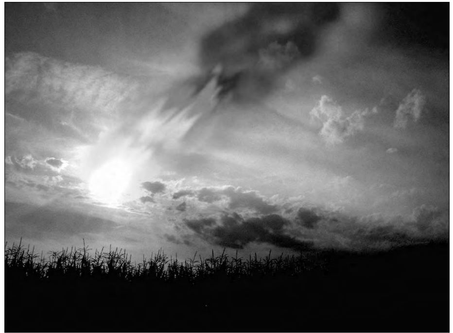
Kurz vor dem Untergang: Ein Himmelskörper-Einschlag.

Generationen vergingen. Bei so manchen Volksstämmen blieb eine vage Erinnerung an die Katastrophe erhalten, wenn auch in stark abgemilderter Form. So sagen „römische“ Überlieferungen aus, dass die Kelten vor niemandem Angst hätten, außer, dass ihnen „der Himmel auf den Kopf fallen“ würde. Diese Aussage bezieht sich zwar nicht auf die gigantische Katastrophe vor rund 1300 Jahren, sondern auf frühere Ereignisse, denn es gab immer wieder Himmelskörper-Einschläge. Beispielsweise seien hier die „Osterseen“ im bayerischen Oberland genannt, die wahrscheinlich durch einen zerbrochenen Kometen eingeschlagen wurden. Noch heute kann aufgrund der ovalen Form festgestellt werden, aus welcher Richtung der Komet kam.