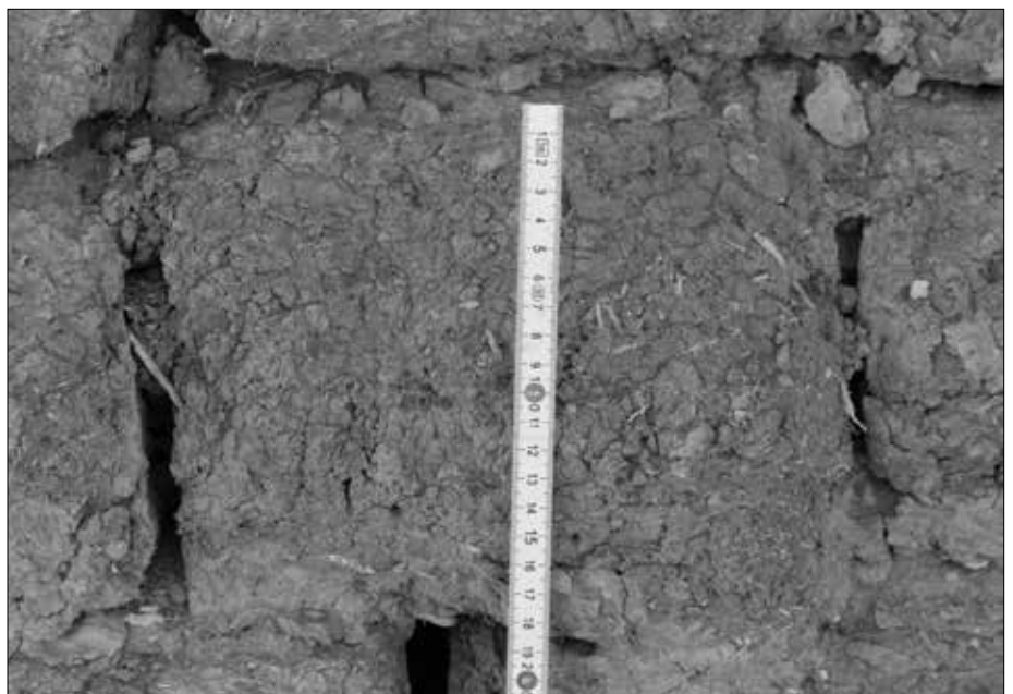
Nahaufnahme der in der Hawara-Pyramide verbauten Nilschlammziegel.