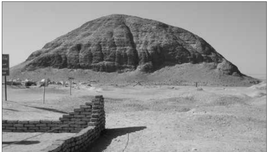
Die Hawara-Pyramide von Pharao Amenemhet III. wurde ebenfalls aus luftgetrockneten Schlammziegeln errichtet. Man kann sich nur wundern, dass heute überhaupt noch etwas von ihr steht!