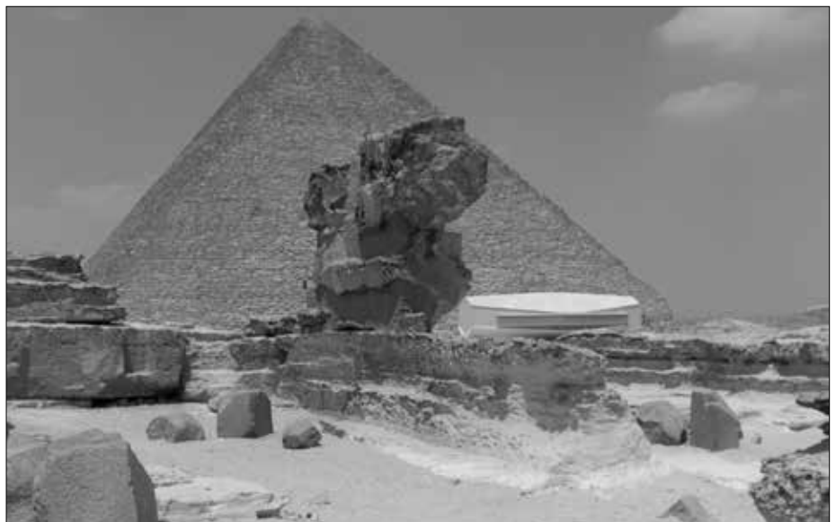
Detail des Chephren-Totentempels. Der Einfluss der gewaltigen Wasser-Zerstörungskraft ist nicht zu übersehen. Im Hintergrund die Cheopspyramide mit dem hässlichen Boots-Museum.