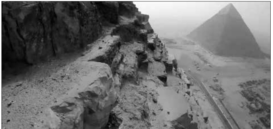
Auch in den höheren Bereichen haben die Baumeister große und kleine Steine verbaut, die wohl ursprünglich nur grob zurecht gehauen waren. Kein Mörtel ist zwischen den Steinblöcken zu sehen (YouTube-Einzelbild).