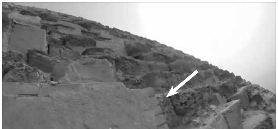
Mit Ziegelsteinen ausgebesserte Stelle (Pfeil).