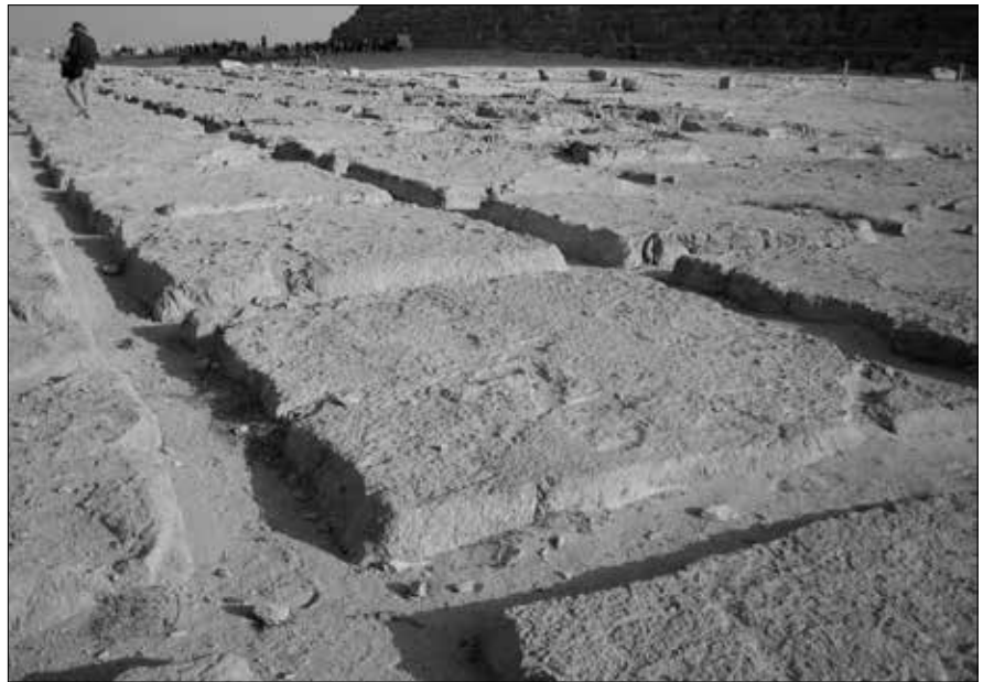
An der Nordseite der Chephren-Pyramide befinden sich Einschnitte im Boden, wovon die Ägyptologen behaupten, hier seien einst die Steinblöcke für den Bau der Cheopspyramide gebrochen worden, was mir jedoch recht unwahrscheinlich erscheint.