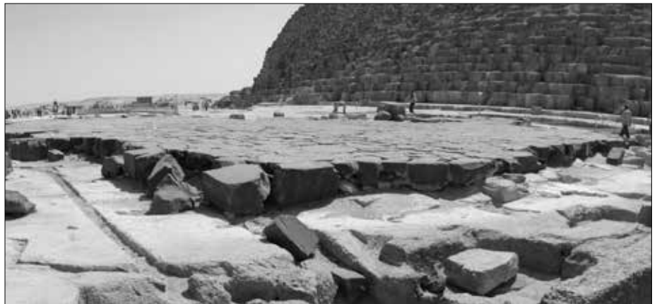
Der ehemalige Cheops-Totentempel – wenn es denn einer war – besteht nur noch aus Basaltplatten und -blöcke, die sorgfältig dem Untergrund angepasst wurden. Wo sind die Tempelreste? Stand hier wirklich ein Tempel? Die Ägyptologen sind davon überzeugt (Cheopspyramide, Ostseite).