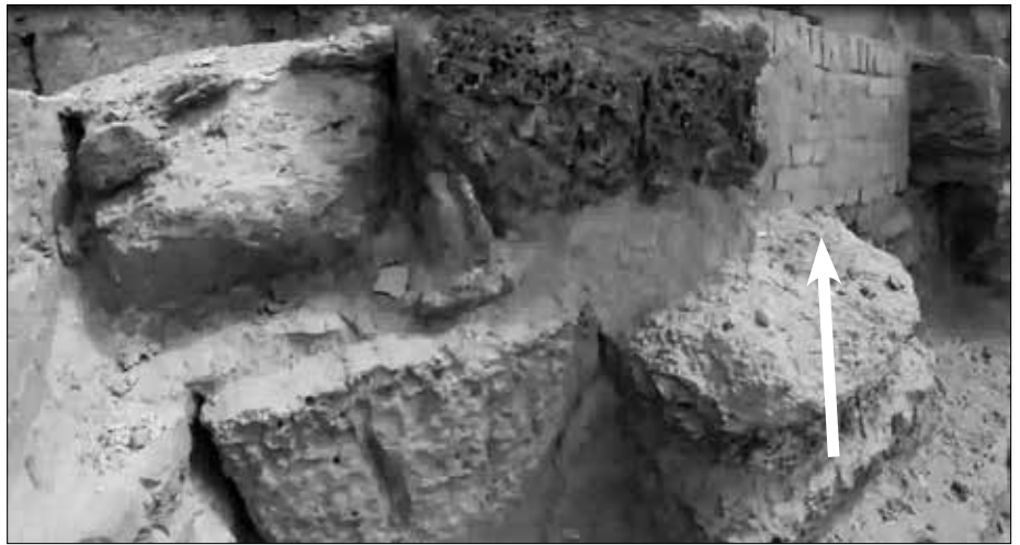
Im oberen Viertel der Pyramide sieht man mit Ziegelsteinen ausgebesserte Stellen.

Vielleicht sollte ich noch erwähnen, dass es nicht damit getan ist, dass eine kilometerhohe Flutwelle über das Land schwappte. Das Wasser als solches bewirkt kaum solche Schäden. Es bringt zwar Gebäude zum Einsturz. Aber solch eine Flutwelle schleppt alles mit sich, was nicht niet- und nagelfest ist: von Felsbrocken über Geröll und Sand bis zu entwurzelten Bäumen. Und dieses erzeugt wie mit Schmirgelpapier die ausgeschliffenen deutlich sichtbaren Spuren.