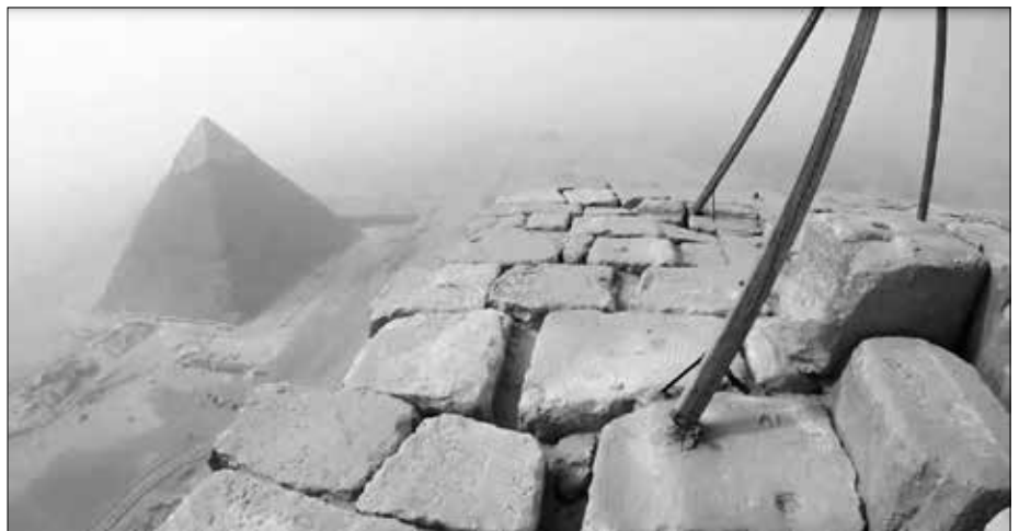
Auf der Spitze der Cheopspyramide: Auch hier kein Mörtel (YouTube-Einzelbild).