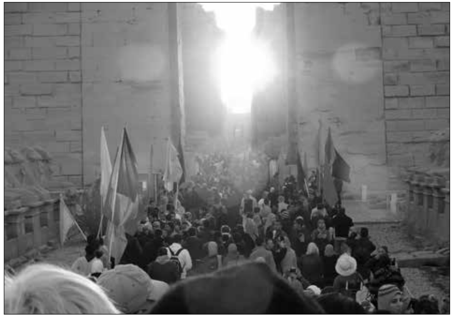
Die Sonne ist aufgegangen, die Menschen jubeln, singen und tanzen, bunte Fahnen werden geschwenkt. So ähnlich muss es auch zu pharaonischen Zeiten gewesen sein!

Die Weiße Kapelle (auch Chapelle blanche ) wurde in der 12. Dynastie durch Sesostri I. aus hellem Gestein errichtet, daher ihr Name. Sie ist das älteste erhaltene Bauwerk der Tempelanlage. Auf einem 1,18 Meter hohen Sockel steht ein 6,54 × 6,54 Meter großer Kiosk, dessen Dach von vier mal