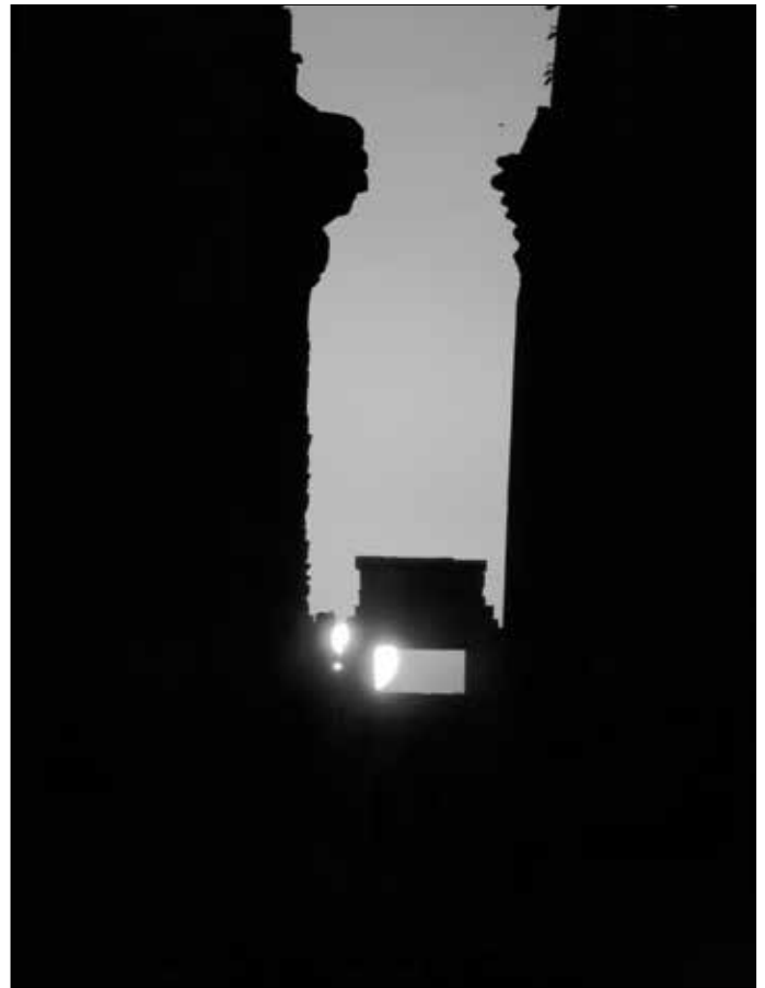
Ganz langsam und majestätisch geht die Sonne hinter der Tempelanlage auf.

zufällig entdeckt! Deshalb ist es auch nicht verwunderlich, dass man darüber weder im Internet noch in Ägyptenbüchern etwas lesen kann.