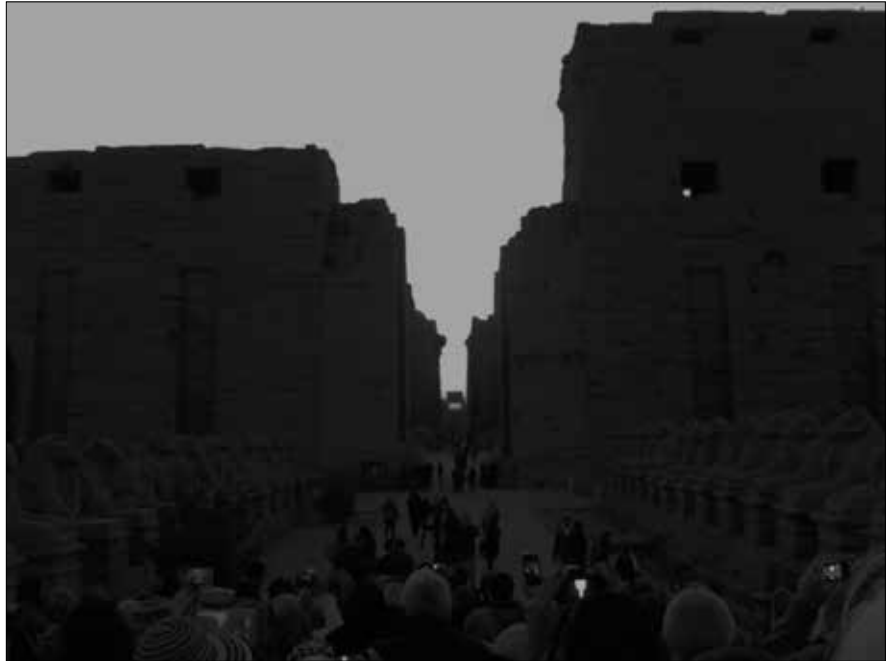
Kurz vor dem Sonnenaufgang vor dem Karnak-Tempel. Blick von außen in den Durchgang.

Obwohl an der Karnak-Tempelanlage bereits ganze Ägyptologen-Generationen gearbeitet und restauriert haben, ist ihnen (und den Millionen Touristen, die diese Anlage bereits besucht haben) bisher entgangen, dass zur Wintersonnenwende beim Sonnenaufgang das Licht exakt durch diesen Durchgang fällt. Erstmals hat man diesen Effekt im Jahre 2012 rein