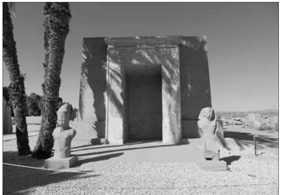
Eine weitere Kapelle (ohne Beschriftungstafel).

Es steht dort eine weitere Kapelle, bei der allerdings eine Beschriftungstafel fehlt. Davor hat man schön dekorativ links und rechts je eine Pharaonenfigur aufgestellt.