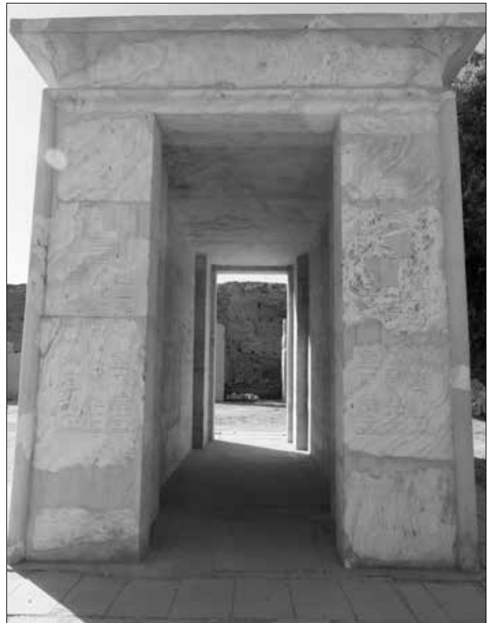
Links: Die Rote Kapelle von Hatschepsut. Rechts: Die Alabasterkapelle von Thutmosis IV (oder Amenhotep I.?)

um. Bei Restaurierungsarbeiten kamen 319 Blöcke aus schwarzem Granit und rotem Quarzit der Kapelle zum Vorschein. Aus diesem Material wurde die Rote Kapelle restauriert und im nördlichen Außenbereich der Karnak-Tempelanlage wieder neu aufgebaut.