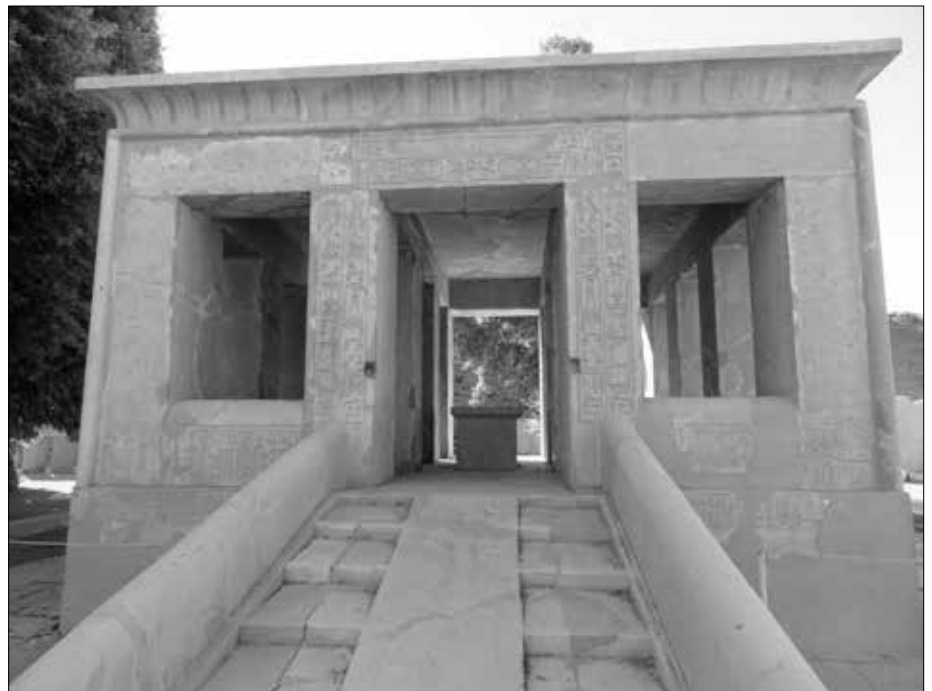
Die Weiße Kapelle von Sesostri I.

vier Pfeilern getragen wird. Die Weiße Kapelle wurde als Barkensanktuar gebaut und diente somit bei verschiedenen Festlichkeiten als Stationskapelle für die Götterbarke. In der Mitte des Durchganges steht ein Altar aus Granit, auf dem möglicherweise einst die Kultbarke gelagert wurde.