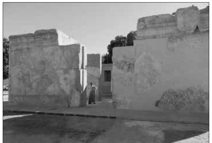
Der restaurierte Tempel an der Nordseite der Karnak-Umfassungsmauer.