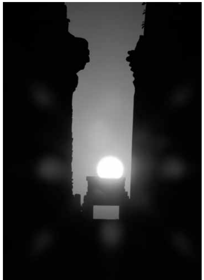
Und dann strahlt die Sonne majestätisch durch die Tempelanlage.

Wir waren (ebenfalls zufällig) zu diesem Zeitpunkt in Luxor und konnten das „Sonnenwunder“ am Karnak-Tempel selbst bestaunen. Glücklicherweise hat uns in Luxor jemand am Tag vorher darauf hingewiesen, denn wir wussten nichts davon. Am 22. Dezember war dann die Tempelanlage bereits morgens ab 6:00 Uhr geöffnet, und es wurde für dieses Ereignis noch nicht einmal Eintritt verlangt! Um einen guten Platz zum Fotografieren zu haben – wir wussten ja nicht, wie viele Menschen dorthin kamen – waren wir natürlich bereits lange vor 6:00 Uhr dort und froren uns die Beine ab, denn im Dezember ist