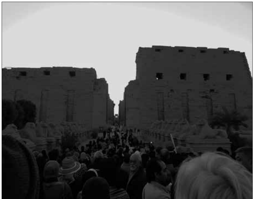
Noch ist es nicht soweit, auch wenn es bereits heller wird.